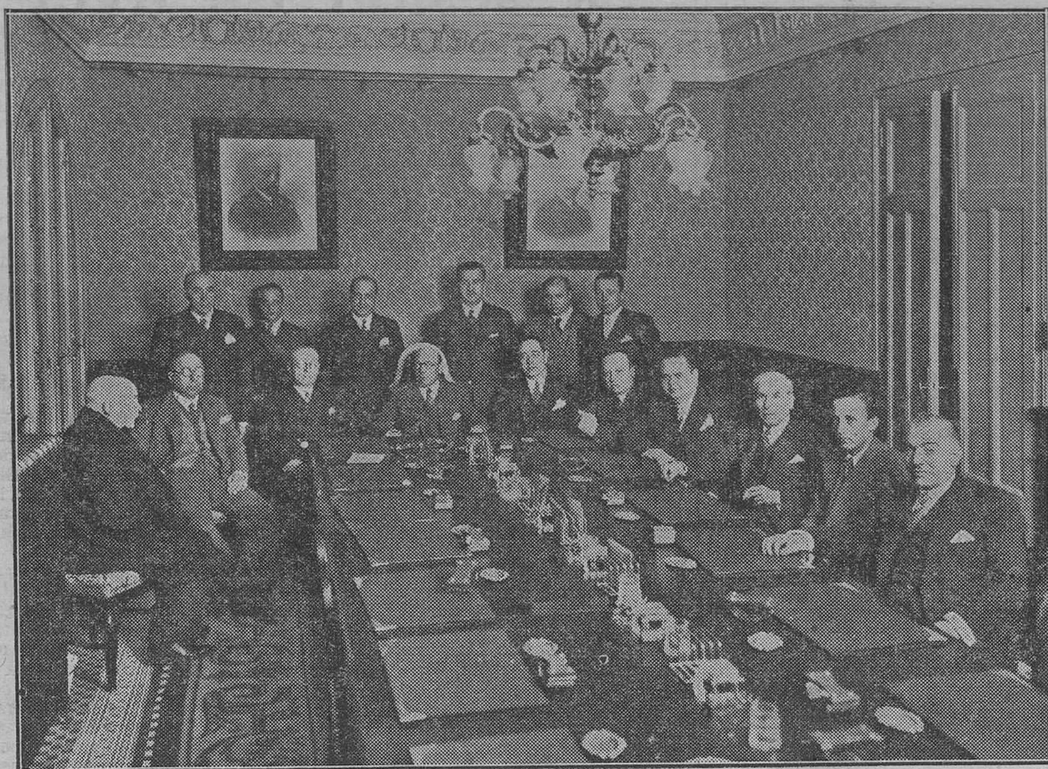
En el salón de Juntas de la Caja de Previsión Social se firmó el domingo el convenio entre dicha entidad y el Ateneo Mercantil, en virtud del cual la Caja de Previsión facilitará dos millones de pesetas al Ateneo para la construcción de su nuevo edificio, acto al que concurrió el presidente de esta sociedad, hoy ministro de Industria y Comercio, don Ricardo Samper

Coincidente con este despejo del horizonte social, al menos por una temporada, ha resurgido entre los radicales el optimismo. Nada mejor para difundirlo entre la hueste, que un banquete en el cual el señor Martínez Barrios había de jurar—¡pues no faltaba más!—lealtad eterna a don Alejandro. Como se pedía: don Diego habló ayer en la sobremesa eufórica, para decir lo que se le pedía. Y luego don Alejandro abrazó a don Diego. Un abrazo con sordina, porque el señor Lerroux estaba afónico. Hubo su poco de "marchoseria", de jactancia y de... broma; porque broma parece afirmar campanudamente que el partido radical es el árbitro de la vida de estas Cortes, en las cuales el partido radical es prisionero, o, dicho mejor limosnero y pordiosero de las derechas.