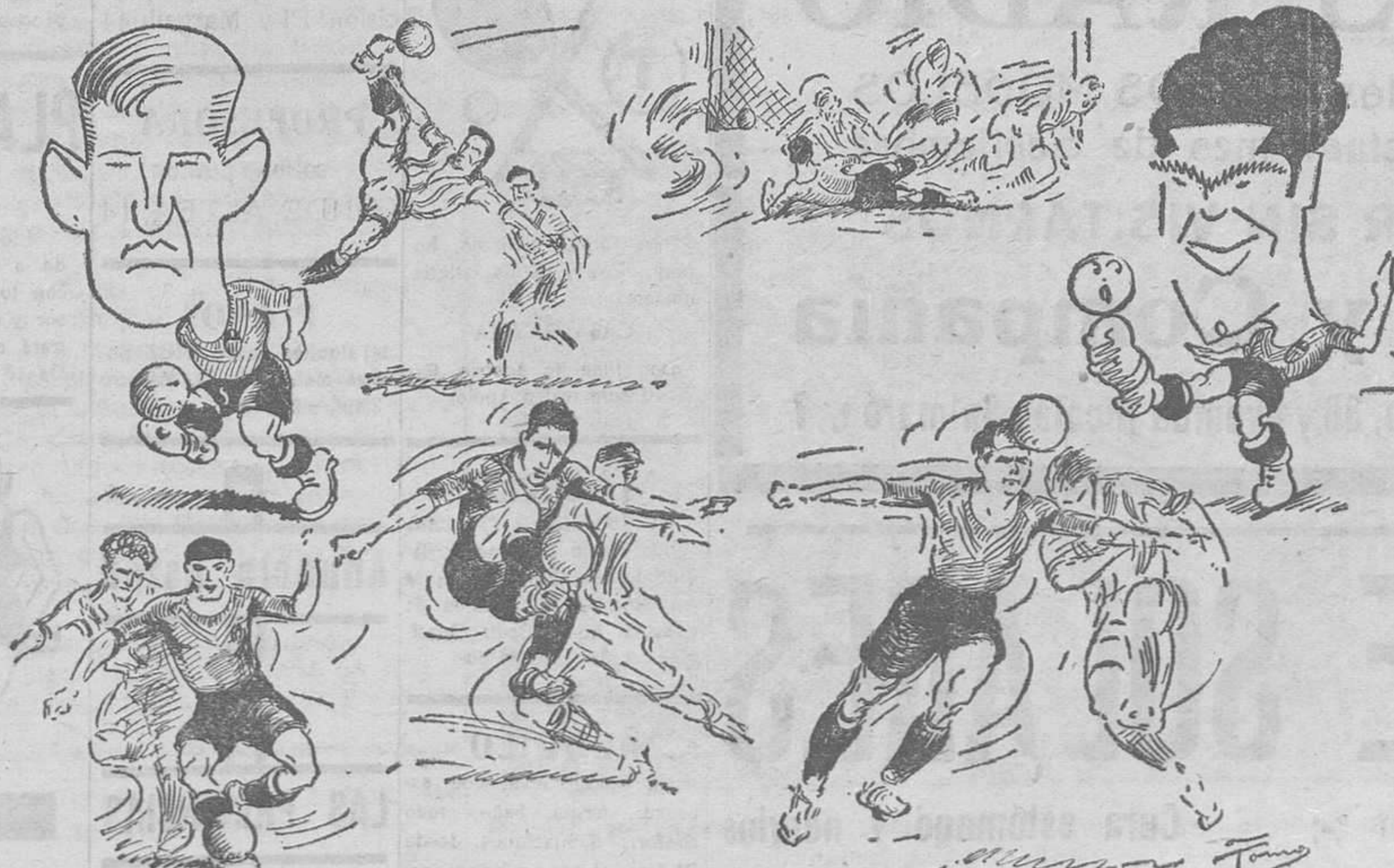
VARIOS MOMENTOS DEL PARTIDO VALENCIA-BETIS