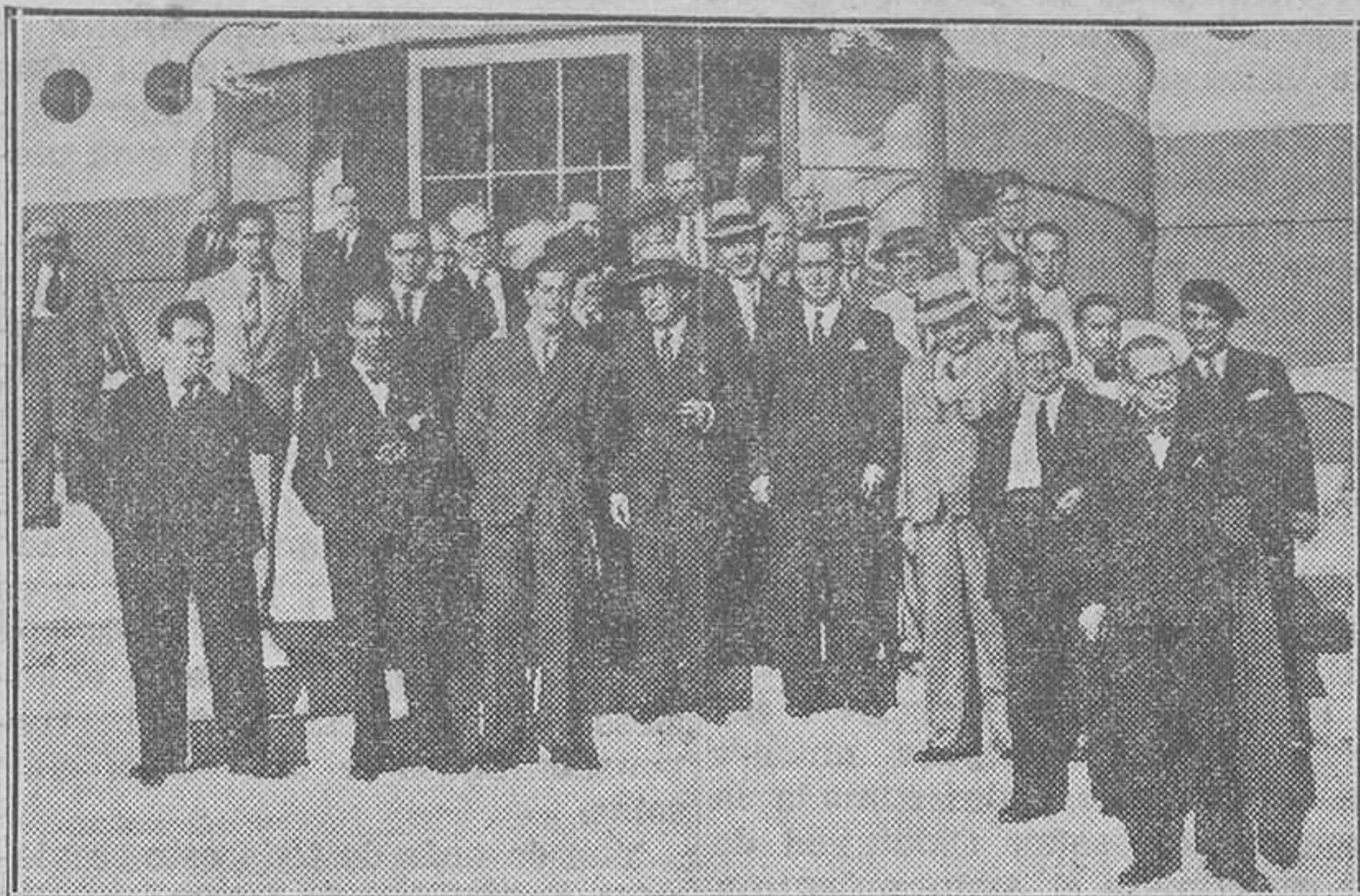
El jefe del Gobierno, señor Samper, con los periodistas madrileños y los valencianos que comieron con él en el Club Náutico.

Hay, pues, desde el primer minuto en que las Cortes se reúnan el día 1.º de Octubre una función genuinamente parlamentaria que se antepone a toda otra, en urgencia y en gravedad: la fiscalización en defensa de la seguridad del Estado y, por ende, la tarea de facilitar la acción de la Justicia, concediendo inmediatamente los suplicatorios para procesar a presuntos reos de un delito. No debería haber en las Cortes una sola voz que disintiese los hechos relacionados con el complot revolucionario. Pero aunque la haya, ¿para qué han de servir los doscientos veintitantos votos de las derechas, a los que, lógicamente, deben sumarse los cien radicales, sino para hacer efectiva la influencia de la mayoría que entre todos integran e imponer la concesión de los suplicatorios para procesar a Azaña y Prieto?... No creemos que las derechas—unidas una vez más y, en este caso, por encima de las dife-