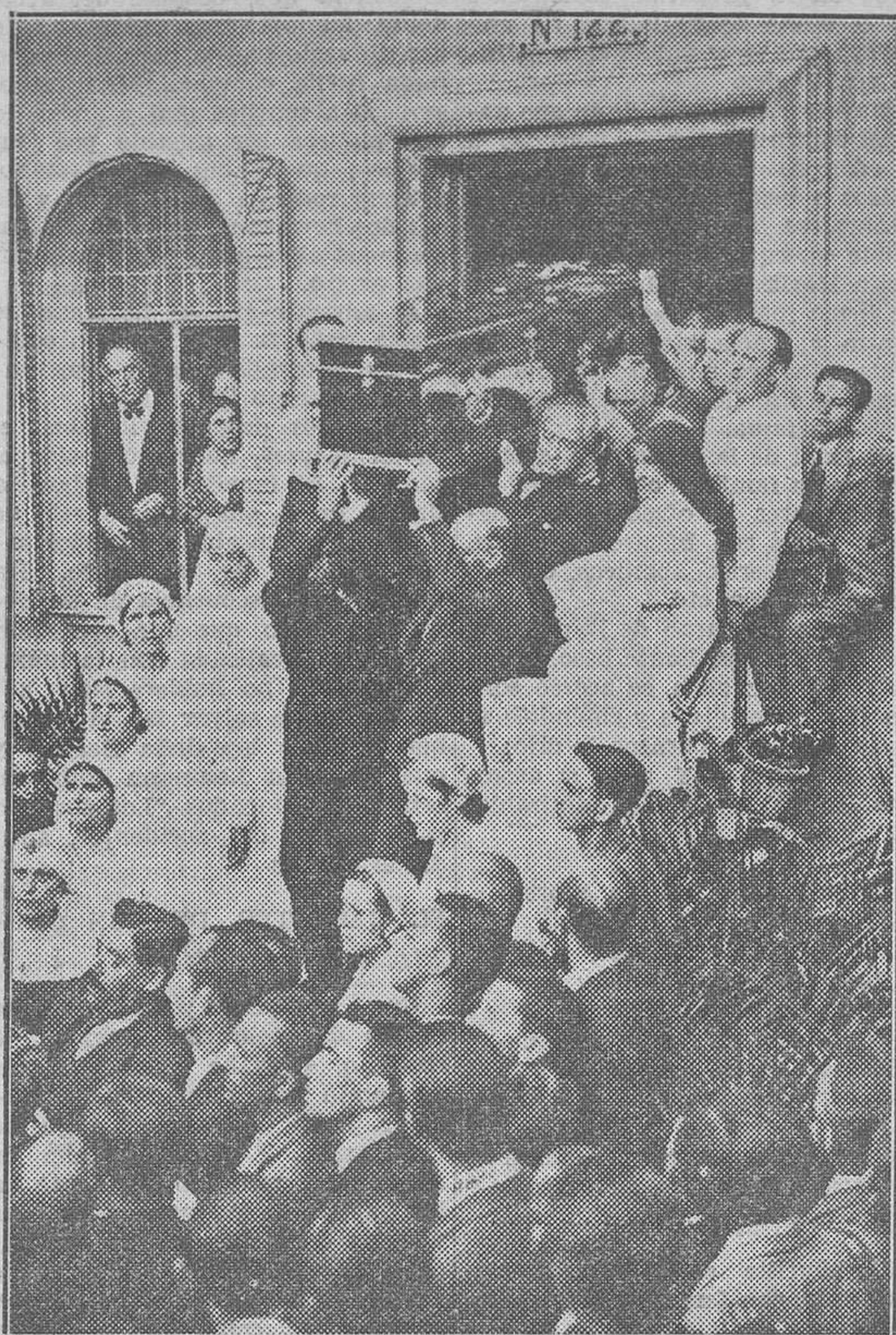
Momento de ser sacado el cadáver del diestro Sánchez Mejías de la casa mortuoria.

"El Debate" tiene también razón al recordar que el órgano comunista, "Mundo Obrero", derrocha, respecto de la cuestión de los Ayuntamientos vascos, toda su literatura truculenta y habla de "las masas populares de Euzkadi". Y como si algo faltara para completar el cuadro, se encargó de ello el mismo "El Día" con un parrafito, en el que se combate el patriotismo español acusándole de ser una reminiscencia de la marcha de "Cádiz". ¡Exactamente igual que en el 98! ¡Exactamente el mismo concepto de los "responsabilistas" de Marruecos! ¡Exactamente la misma idea que la An-