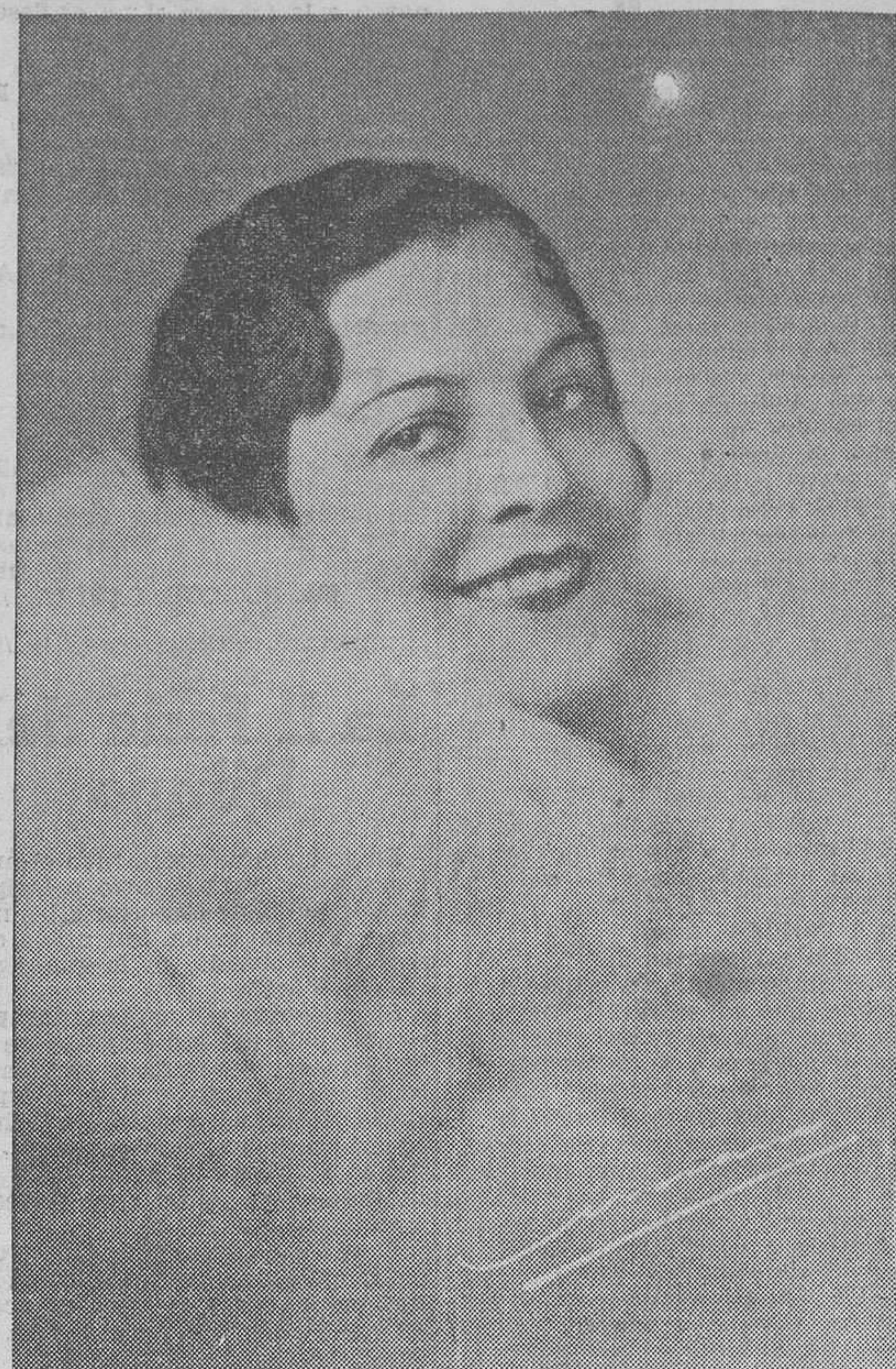
Angela Rossini, notable contralto que actuará mañana en "Las Golondrinas"

RUZAFÁ.— A las 6 tarde y 10'15 noche: Cine sonoro. APOLO.— A las 10 noche: La leyenda del romero (estreno); La Dolorosa. CAPITOL.— A las 6 tarde y 10'15 noche: Pilarín Llorá y Orquesta Dolz. LAS ARENAS.— A las 10'30 noche: Cine sonoro. CLUB NAUTICO.— A las 6 tarde: Atracciones. FRONTON VALENCIANO.— A las 5 tarde y 10'15 noche: Partidos de pelota de cesta a punta. LIRICO.— A las 5'30 tarde y 10 noche: Cine sonoro COLISEUM.— A las 5 tarde y 9'15 noche: Cine sonoro. AVENIDA.— A las 5'30 tarde y 10 noche: Cine sonoro. TYRIS.— A las 5 tarde y 9'30 noche: Cine sonoro. GRAN TEATRO.— A las 5'30 tarde y 9'30 noche: Cine sonoro.