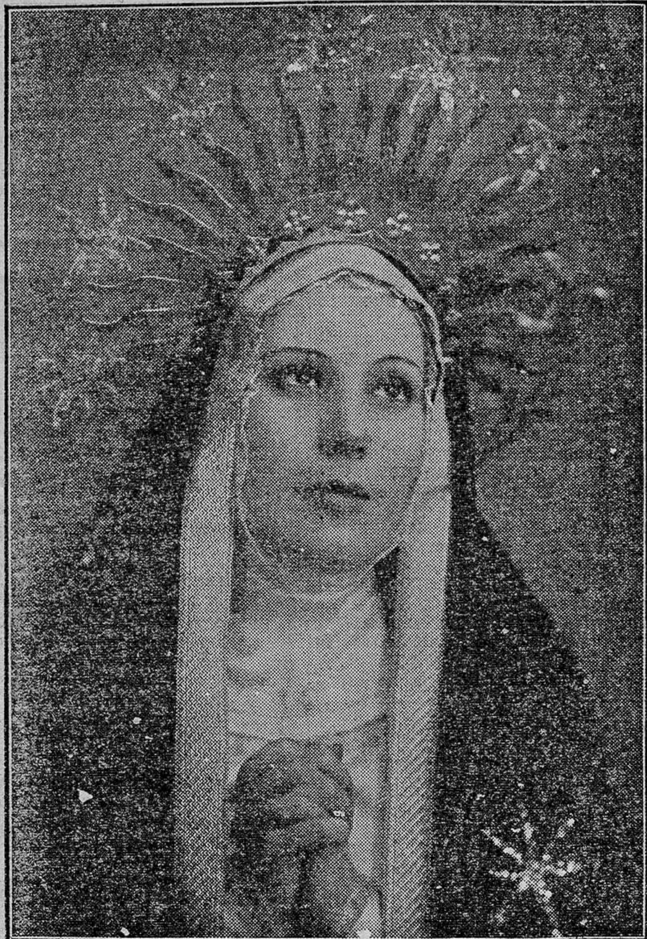
Rosita Díaz, la genial actriz española, hasta hoy indiscutible en los papeles frívolos, alcanza su mayor triunfo y su mejor consagración en el rol dramático de Dolores. En la foto aparece reencarnando a la Virgen, tal como la imagina en su dolor el Hermano Rafael

rrano. Y valenciano fué el primero que trazó el guión cinematográfico de "La Dolorosa" con magistral trazo: Maximiliano Thous.