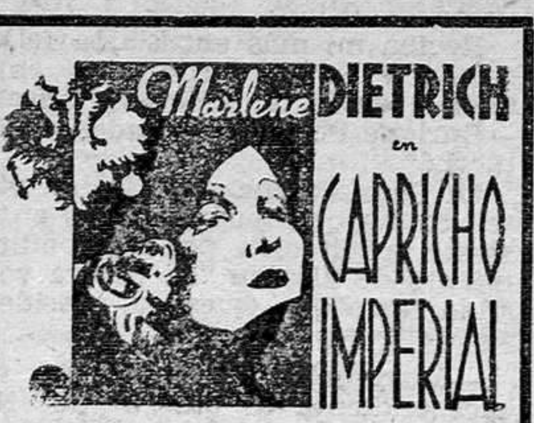
El film espectacular del año

Cuarto 25 A las 5 EL VENCEDOR Por Kate de Nagy y Jean Murat LADRONES En español por Laurel-Hardy ESPIAS EN ACCION Por Brigitte Helm DIBUJOS SONOROS