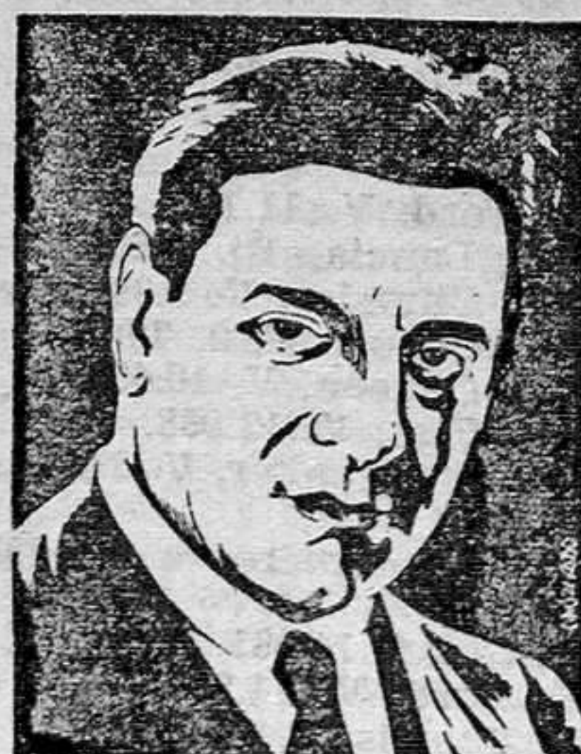
TITO SCHIPA Precios de costumbre.

ESTRENO de la extraordinaria comedia lírica de gestivo asunto, TRES CABALLEROS DE FRAC Creación como actor y cantante del famoso tenor de fama mundial