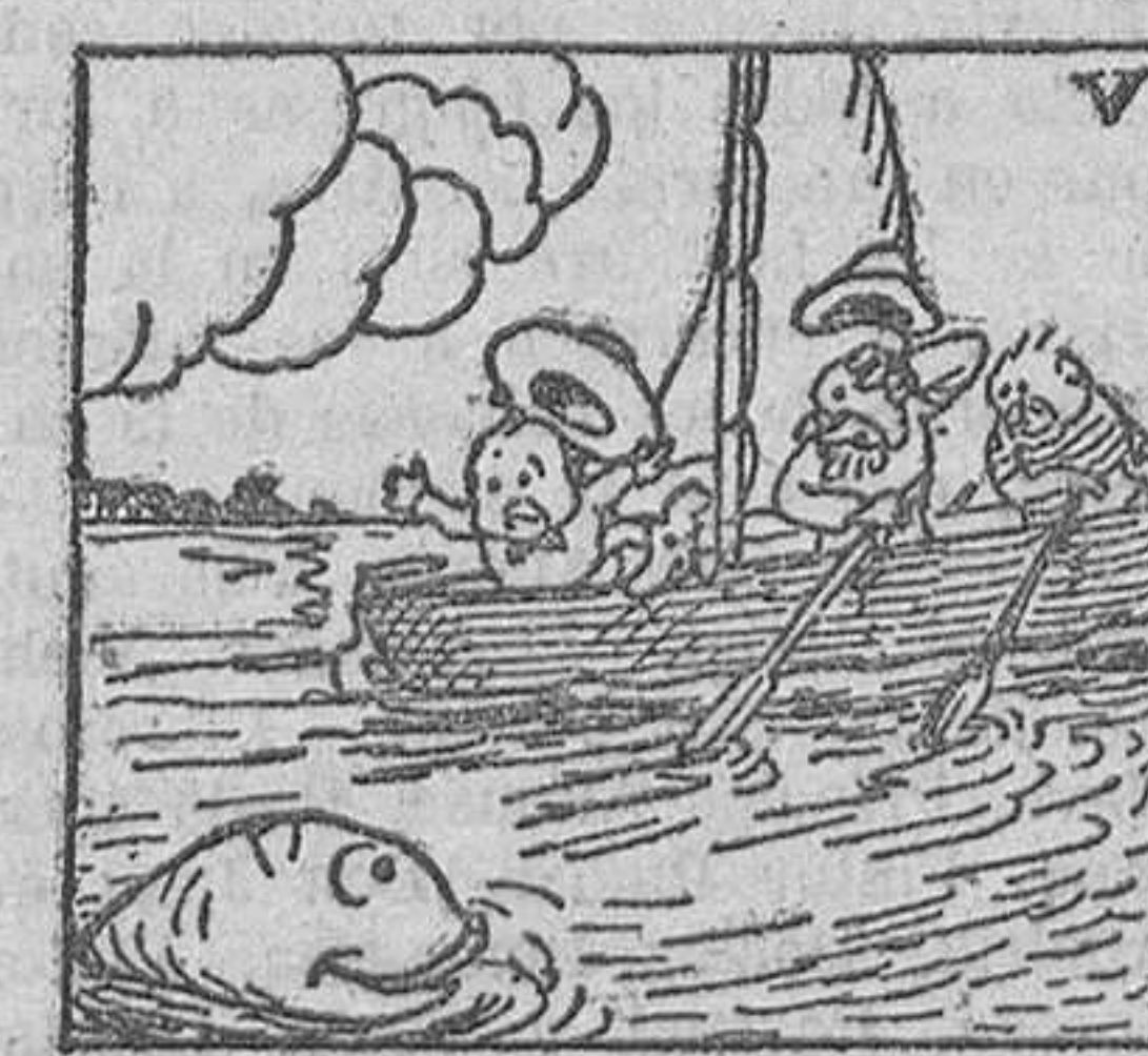
5. Mas quiso su estrella que se tropezara con un ballenato, que acababa de reñir con la suegra,