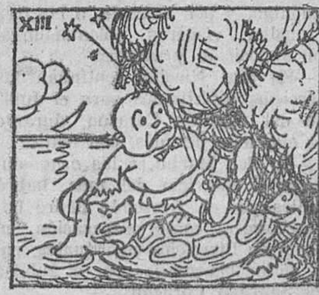
13. Llegando por fin a la casa de la tortuga, cuya puerta era tan baja, que no permitió su paso,