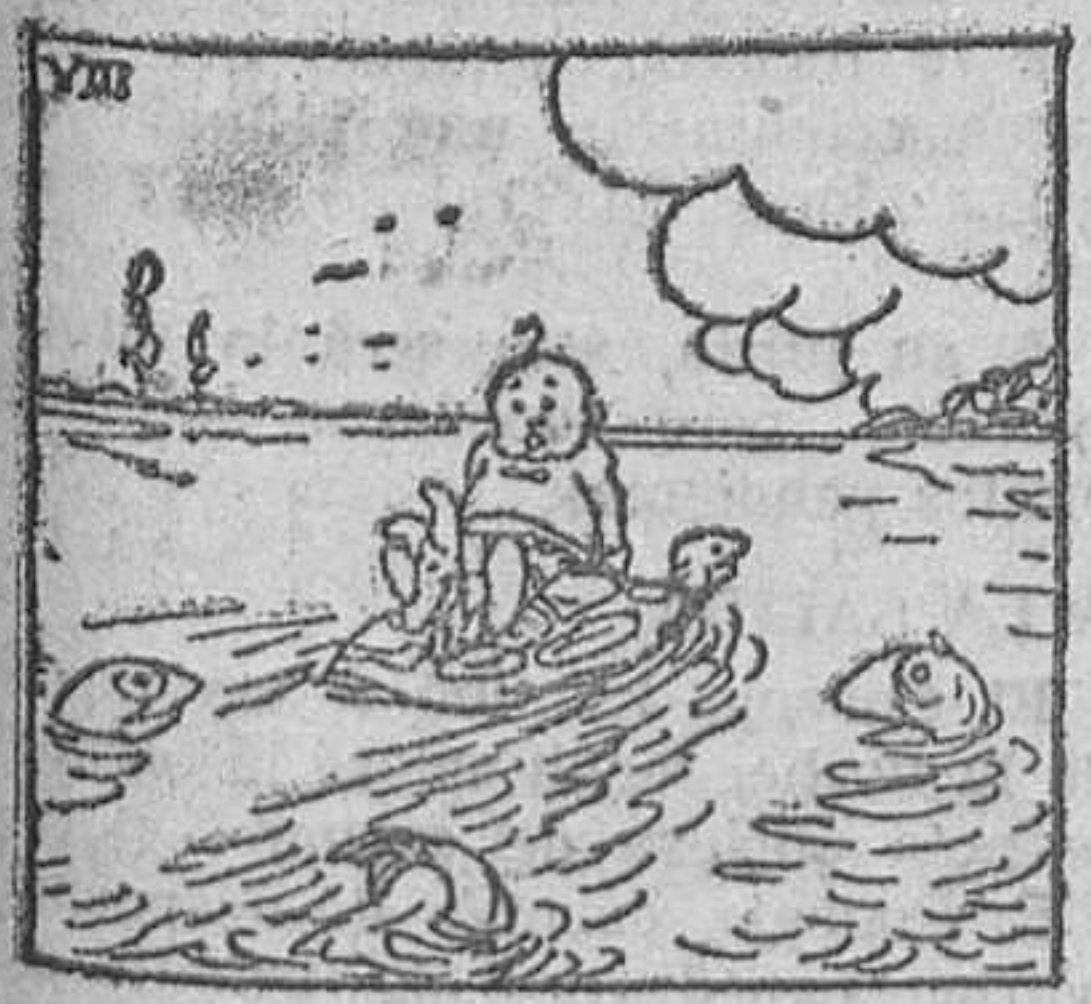
8. la cual, al sentir el golpeazo, creyendo que se le venía el mundo encima, emprendió veloz carrera hacia su guarida,