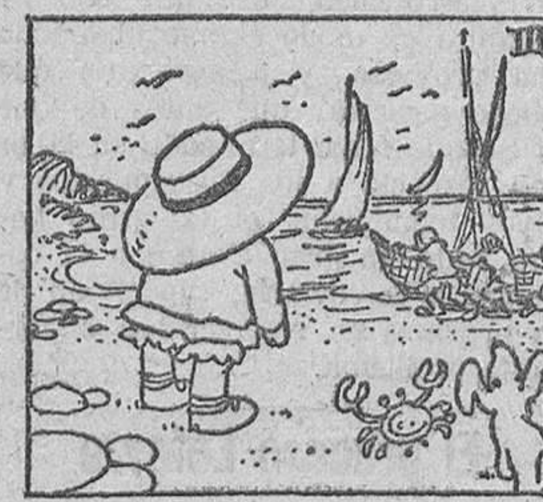
3. sino que también la laboriosa preparación de las barcas de pesca...