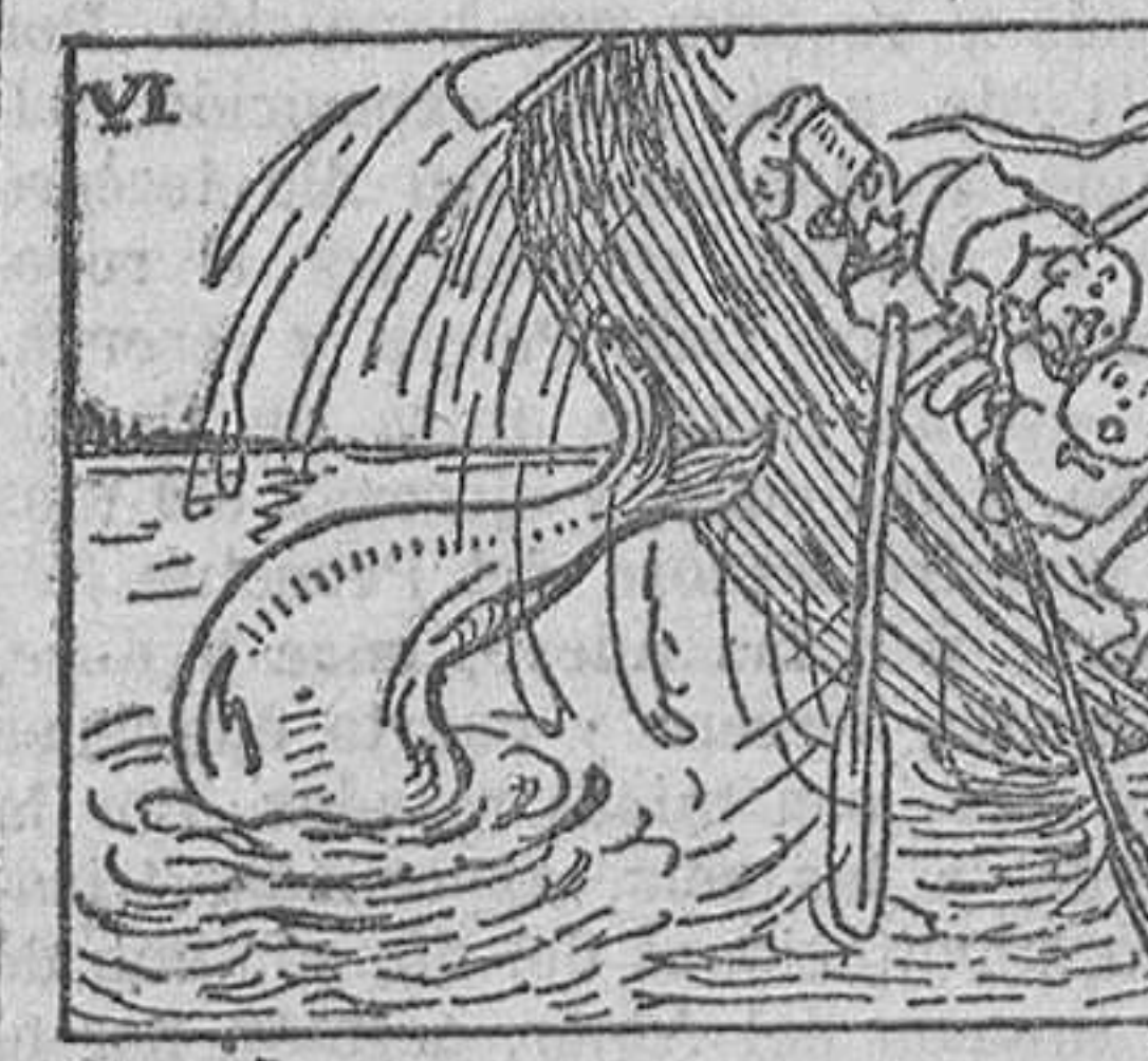
6. porque le había hecho saltados los filetes, y de un furioso colatazo convirtió a la barca en fantástico avión.