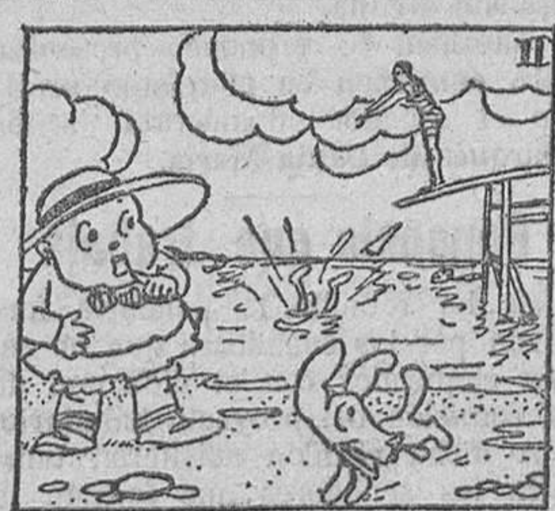
2. admirando no solo las proezas de los y las bañistas,