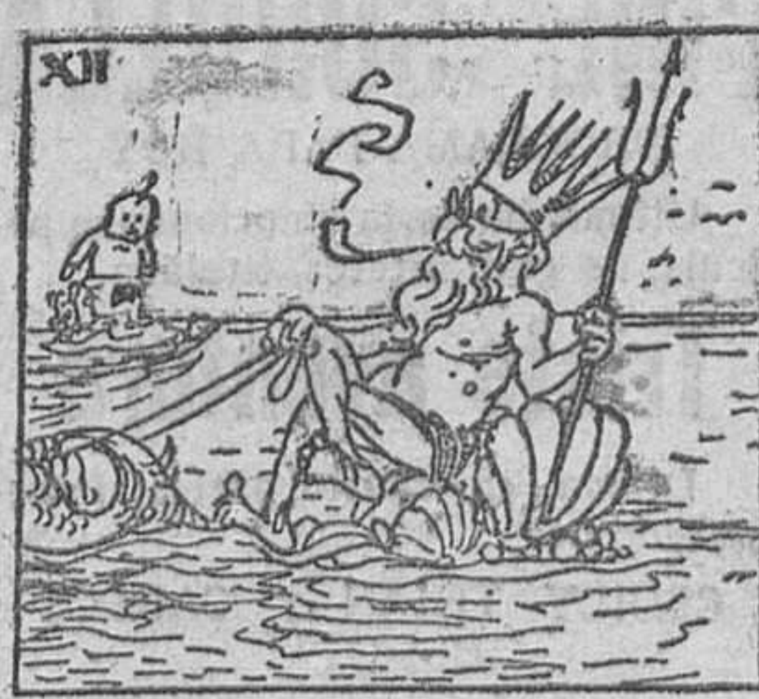
12. y al viejo Neptuno, en su carro de concha, tirado por dos caballos marinos,