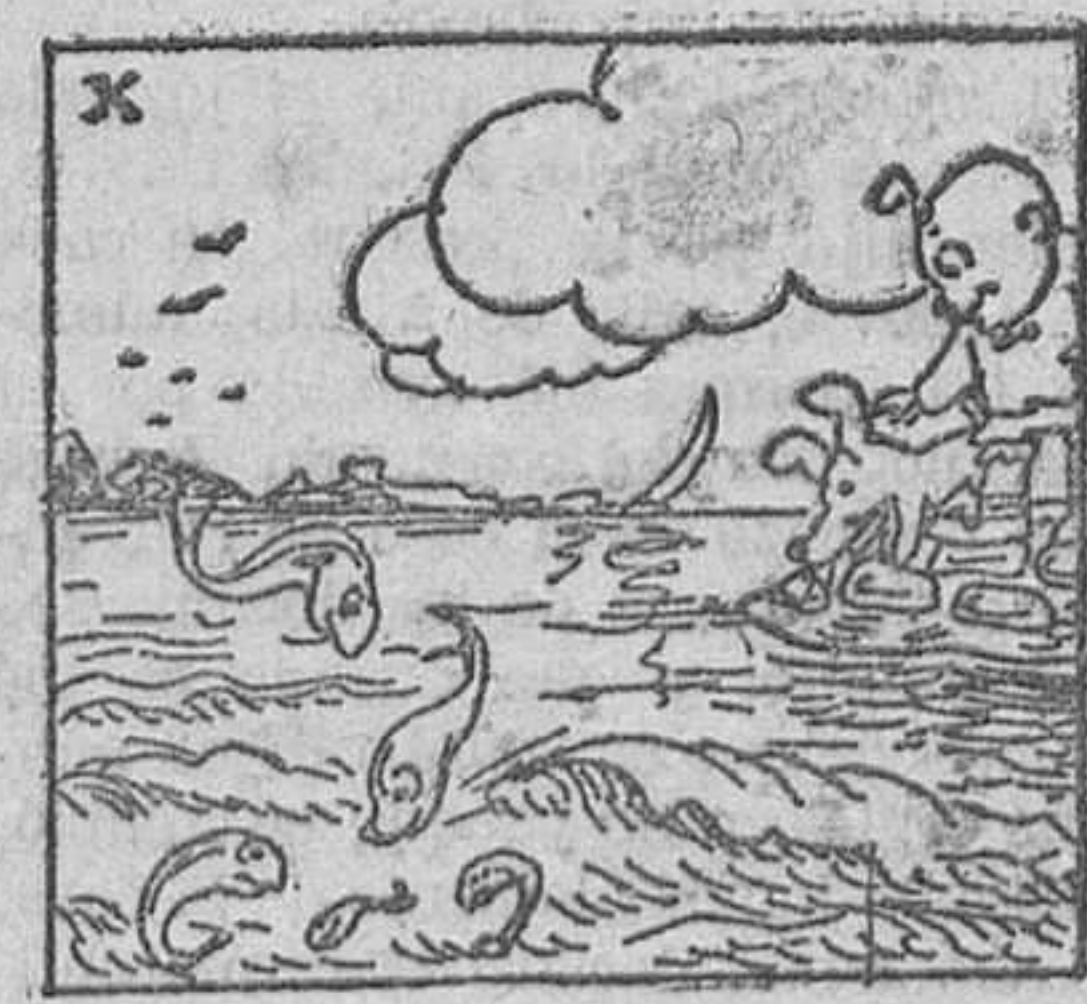
10. y cómo unos salmonetes jóvenes jugaban a saltacabrilla con las olas,