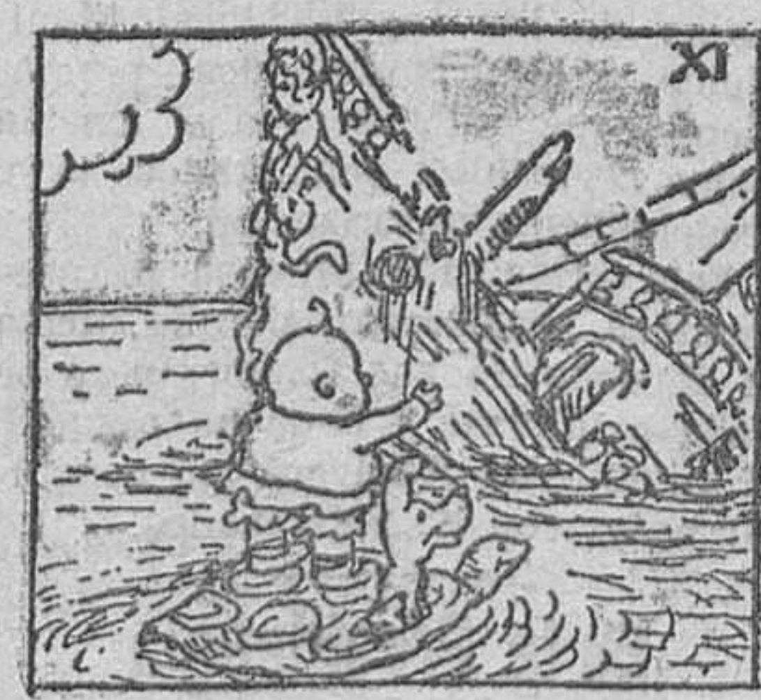
11. y los restos de un viejo galcón cargado de oro de las Indias, del que pudo, al pasar, llenarse los bolsillos