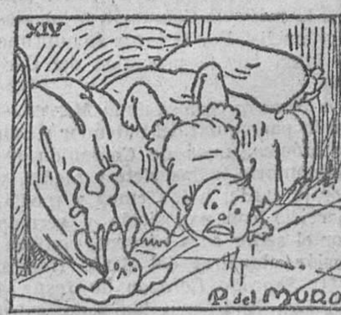
14. tirándole a tierra con gran estruendo, que puso en conmoción a toda la casa, acudiendo en socorro suyo papá, mamá, etc., etc.