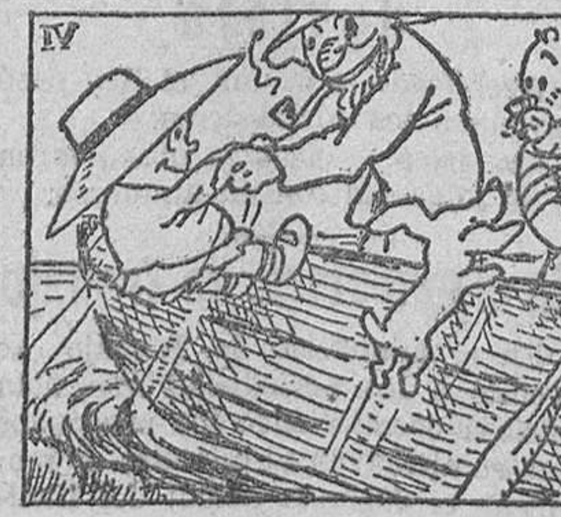
4. ...En una de las cuales fué admitido, encargándose del timón.