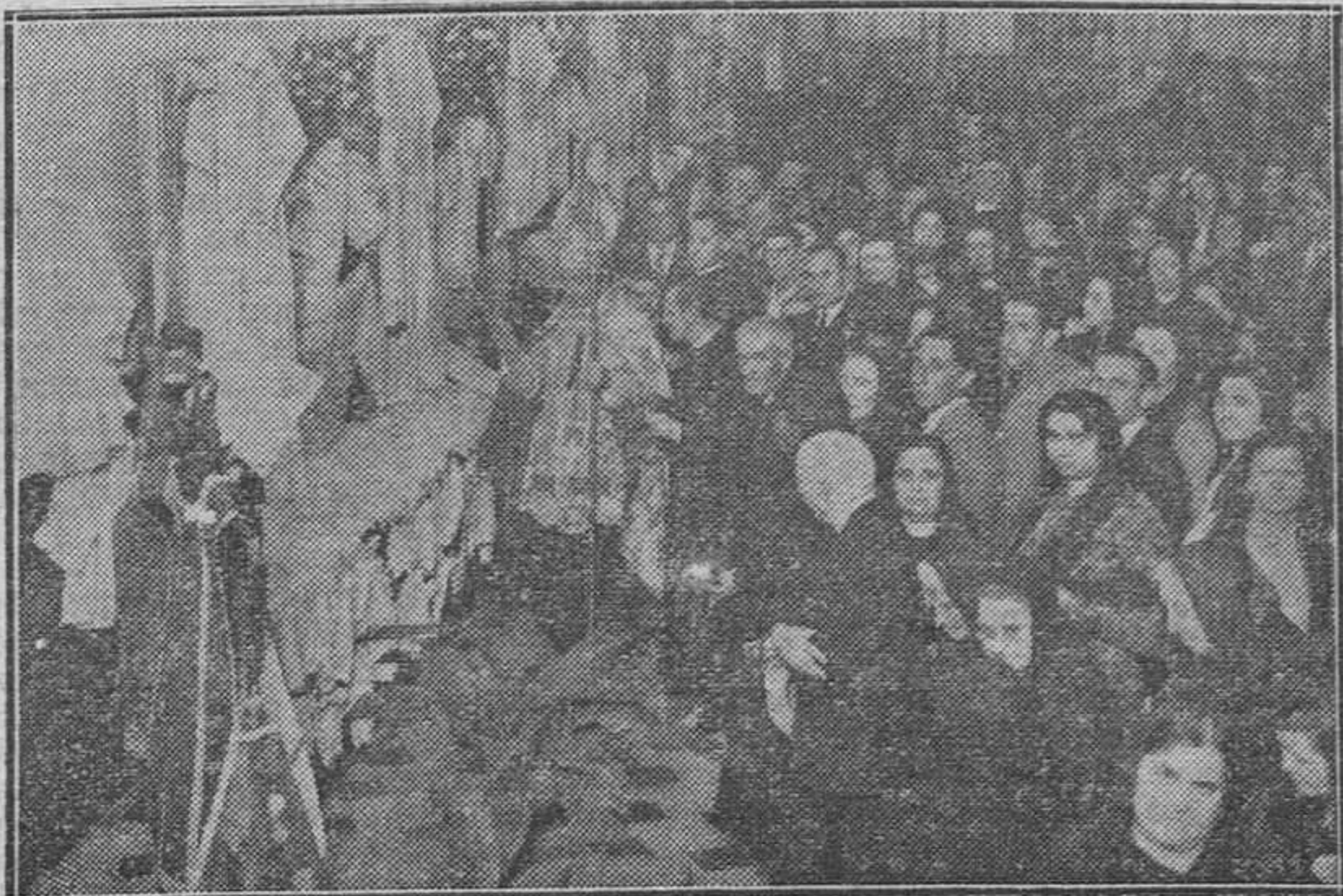
Inauguración de la Exposición Misional