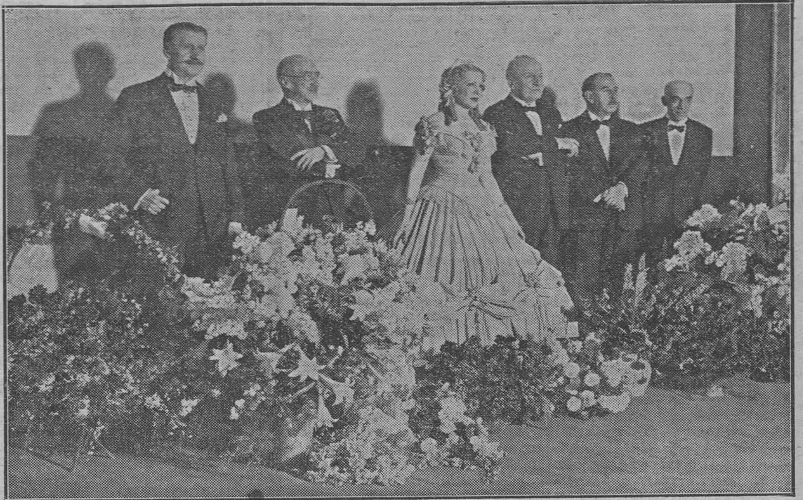
Homenaje y despedida del público madrileño de la gran artista Catalina Bárcena. En la fiesta celebrada en el Coliseum, tomaron parte los hermanos Alvarez Quintero, Benavente, Marquina y Gregorio Martínez Sierra.