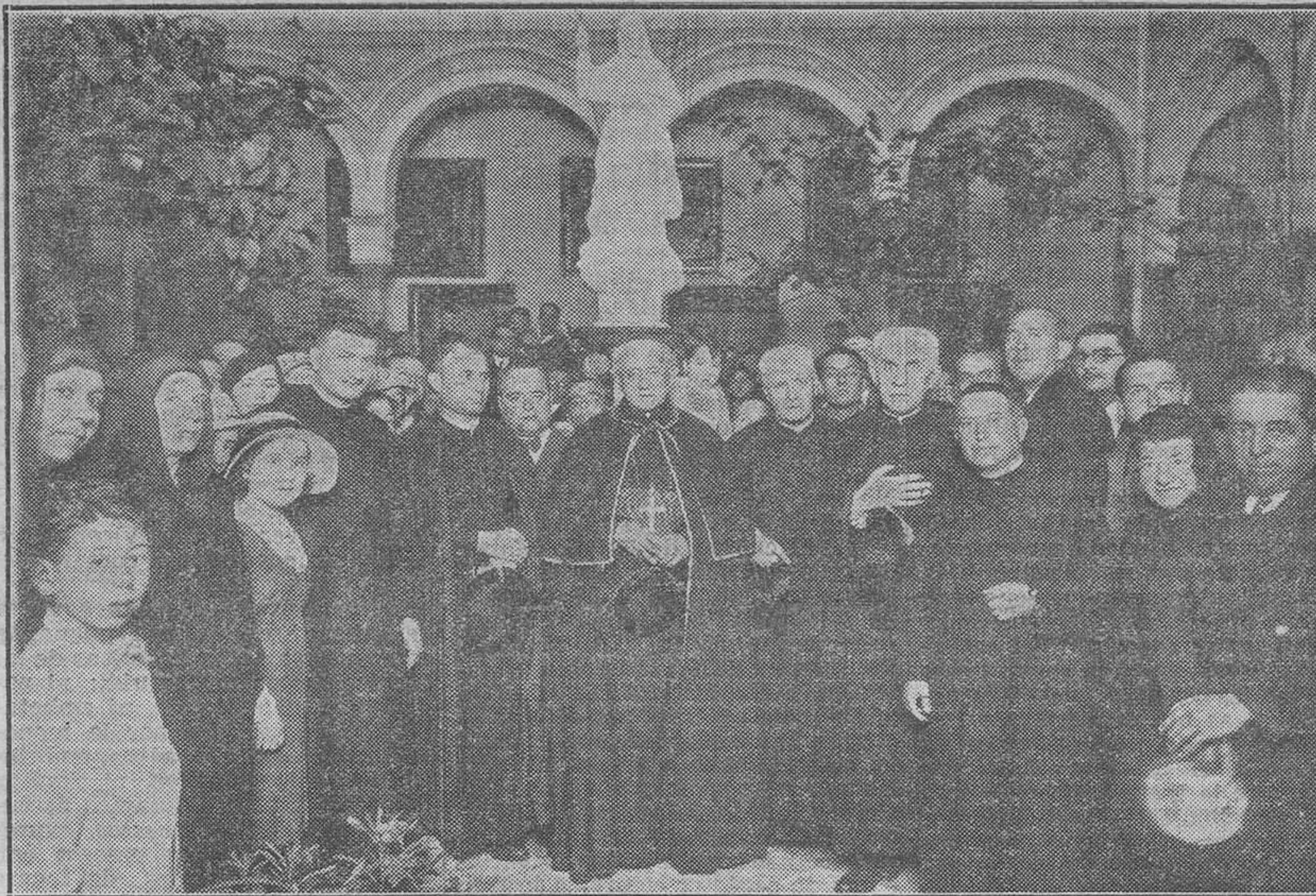
El Cardenal Illundain, con la Comunidad de Hermanos del Hospital de San Juan de Dios, después de la entronización. Sevilla, Abril 1934.