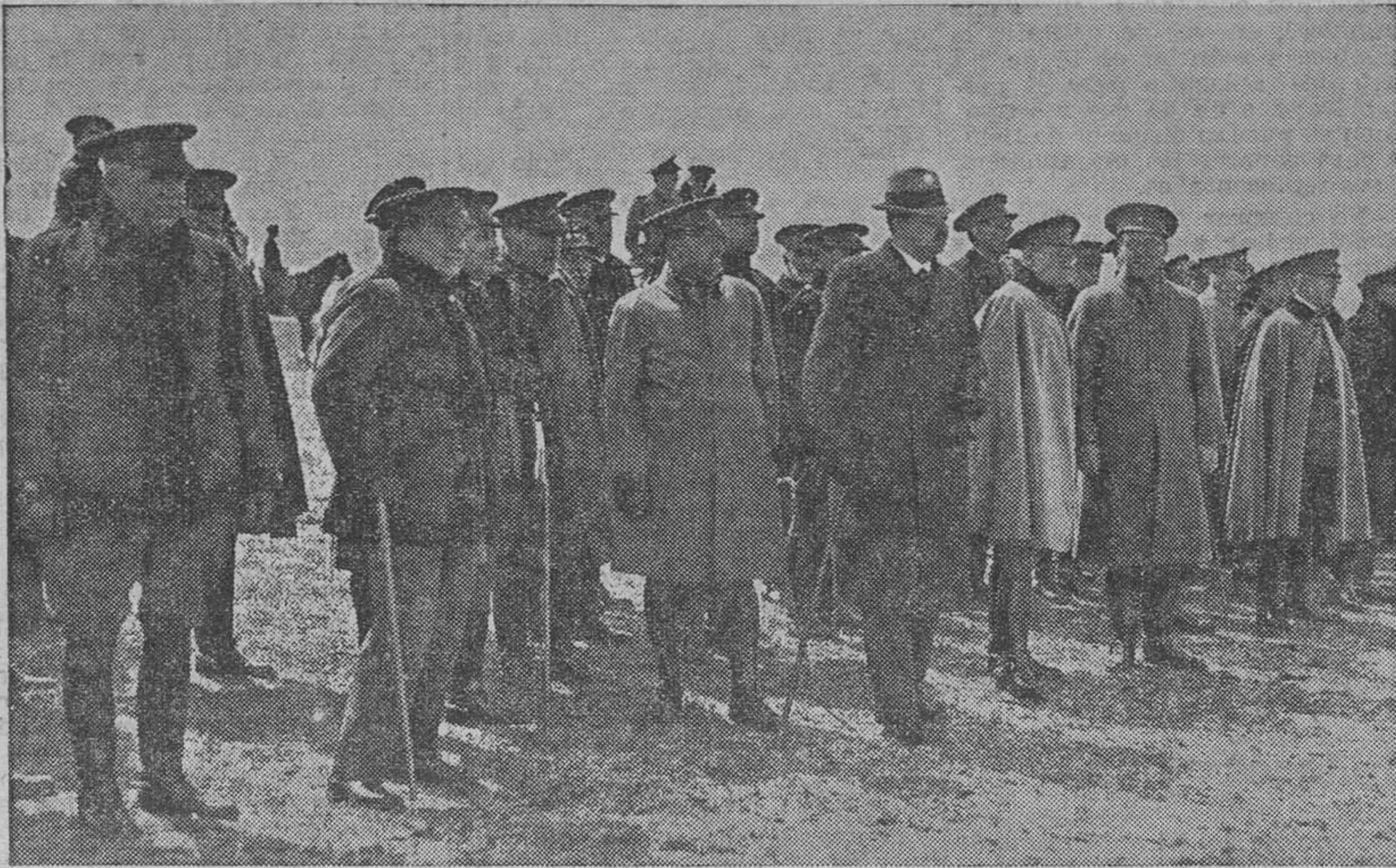
El ministro de la Guerra, con varios generales, presenciando las maniobras de Carabanchel

Además, que es inconducente obligar a salir a dicha vegetación en la forma que lo hace. Las Asociaciones protectoras de plantas debían tomar cartas en el asunto. Desde la Alameda se oían el otro día los lamentos y gritos de dolor que lanzaban las pobres plantitas que el año anterior quedaron en Llano del