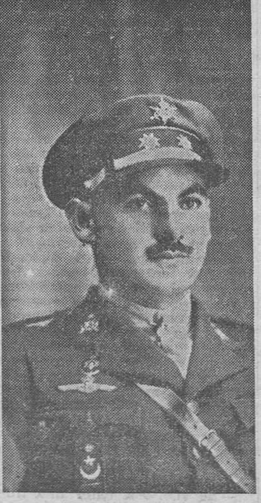
El coronel Capaz, director de las operaciones para ocupar Ifni