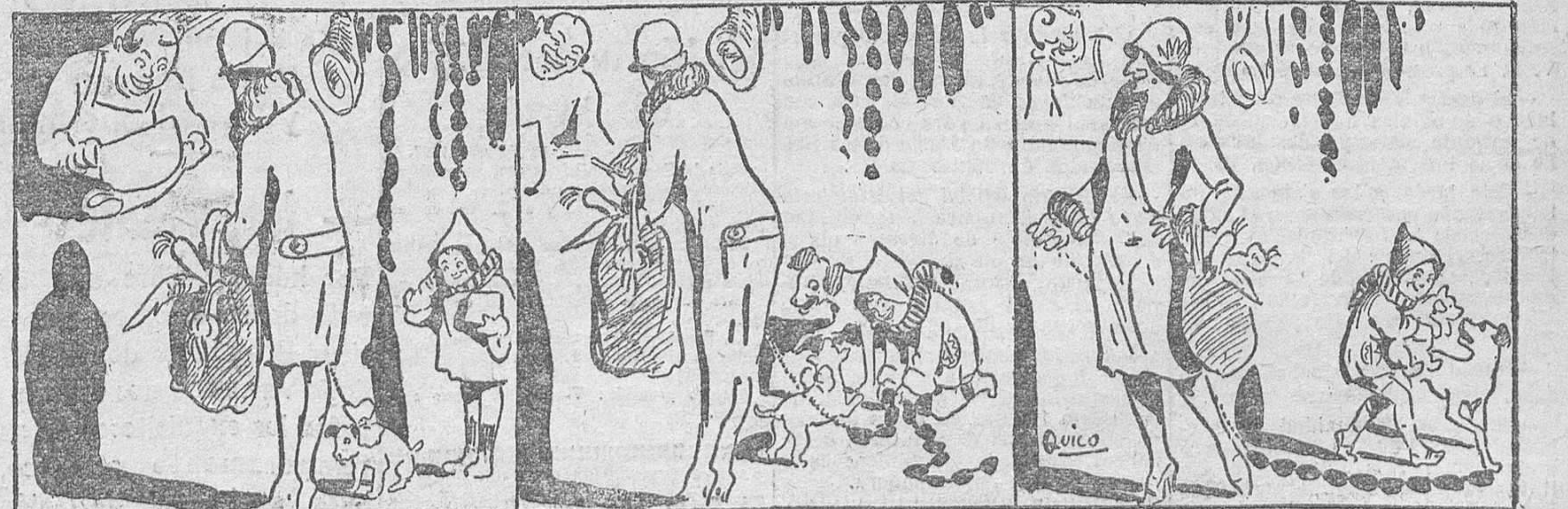
Caminito de la escuela se encuentra a doña Carmela.