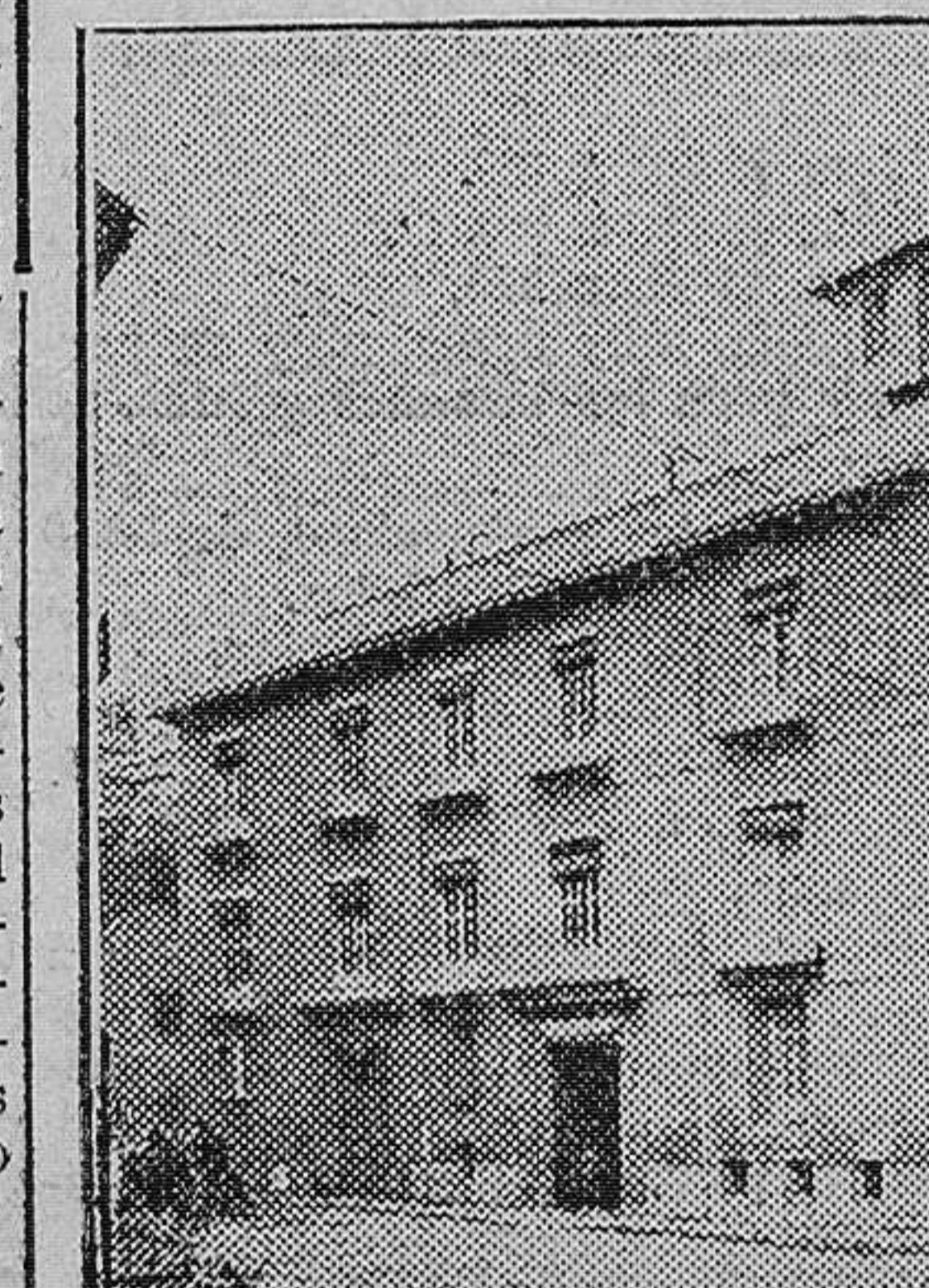
Casa Central propiedad de la Caja de Ahorros y Monte de Piedad

de Piedad de Valencia dará idea de lo que pueden una administración escrupulosa, inteligencias pre-