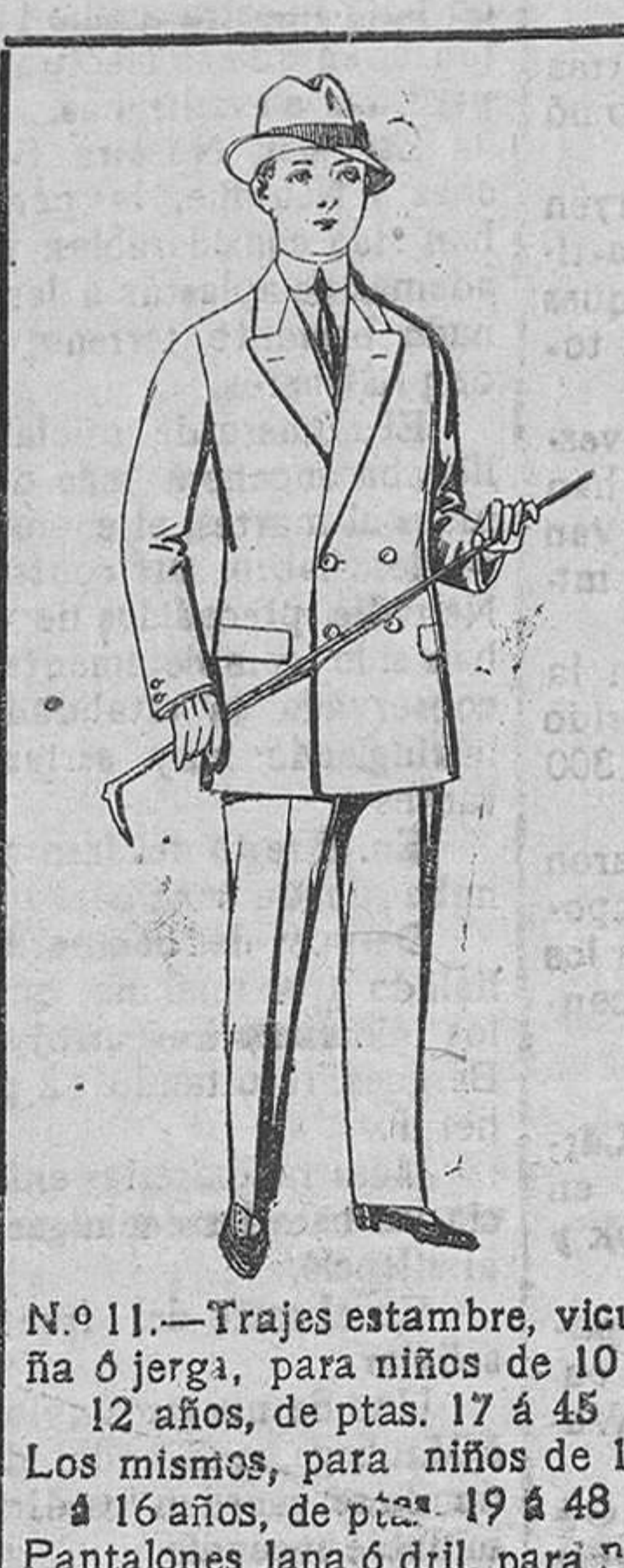
N.º 11.—Trajes estambre, vicuña ó jerga, para niños de 10 á 12 años, de ptas. 17 á 45. Los mismos, para niños de 13 á 16 años, de ptas. 19 á 48. Pantalones lana ó dril, para niños de 10 á 16 años, de 3 á 12.