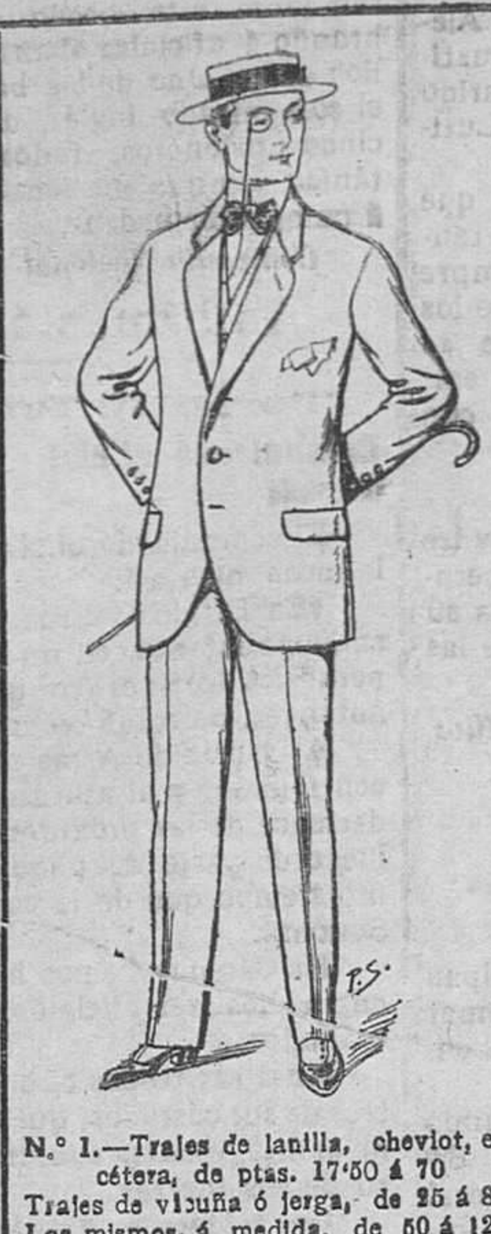
N.º 1.—Trajes de lanilla, cheviot, etcétera, de ptas. 17 50 á 70. Trajes de vicuña ó jerga, de 15 á 80. Los mismos, á medida, de 60 á 125.