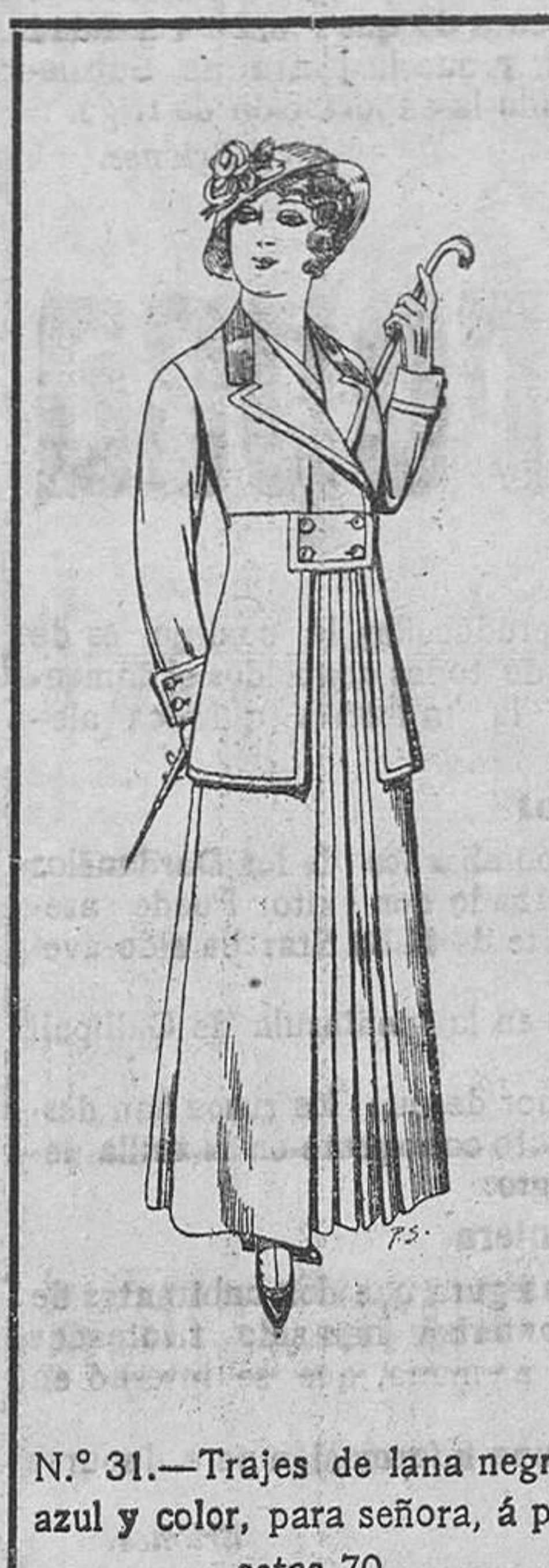
N.º 31.—Trajes de lana negra, azul y color, para señora, á pesetas 70.