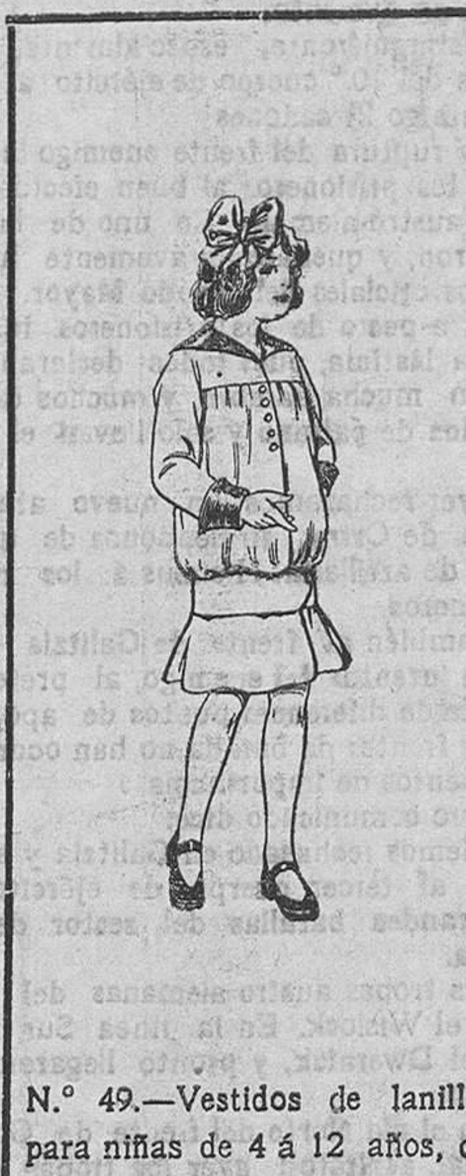
N.º 49.—Vestidos de lanilla, para niñas de 4 á 12 años, de pesetas 12 á 20.