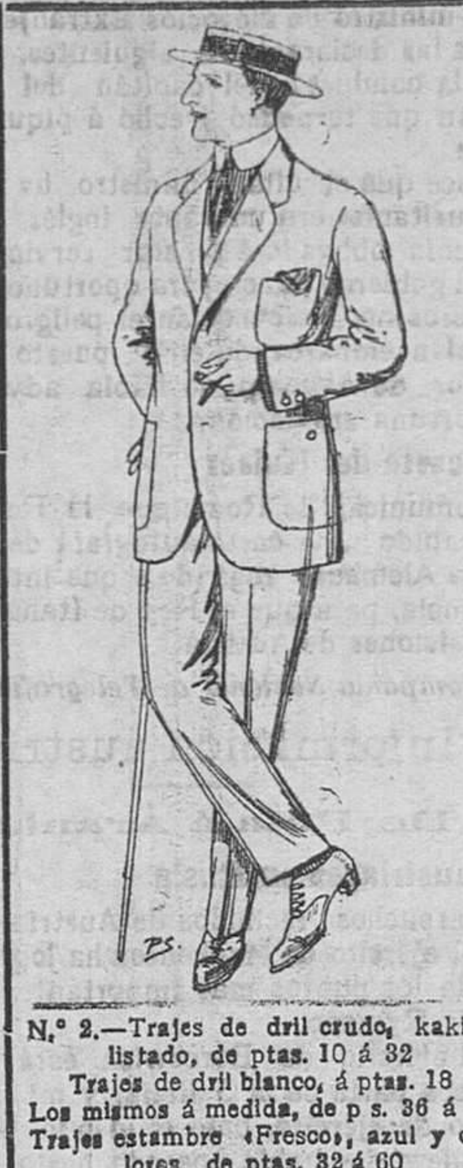
N.º 2.—Trajes de dril crudo, kaki ó listado, de ptas. 10 á 32. Trajes de dril blanco, á ptas. 18. Los mismos á medida, de p. s. 36 á 64. Trajes estambre, frescos, azul y colores, de ptas. 55 á 80.