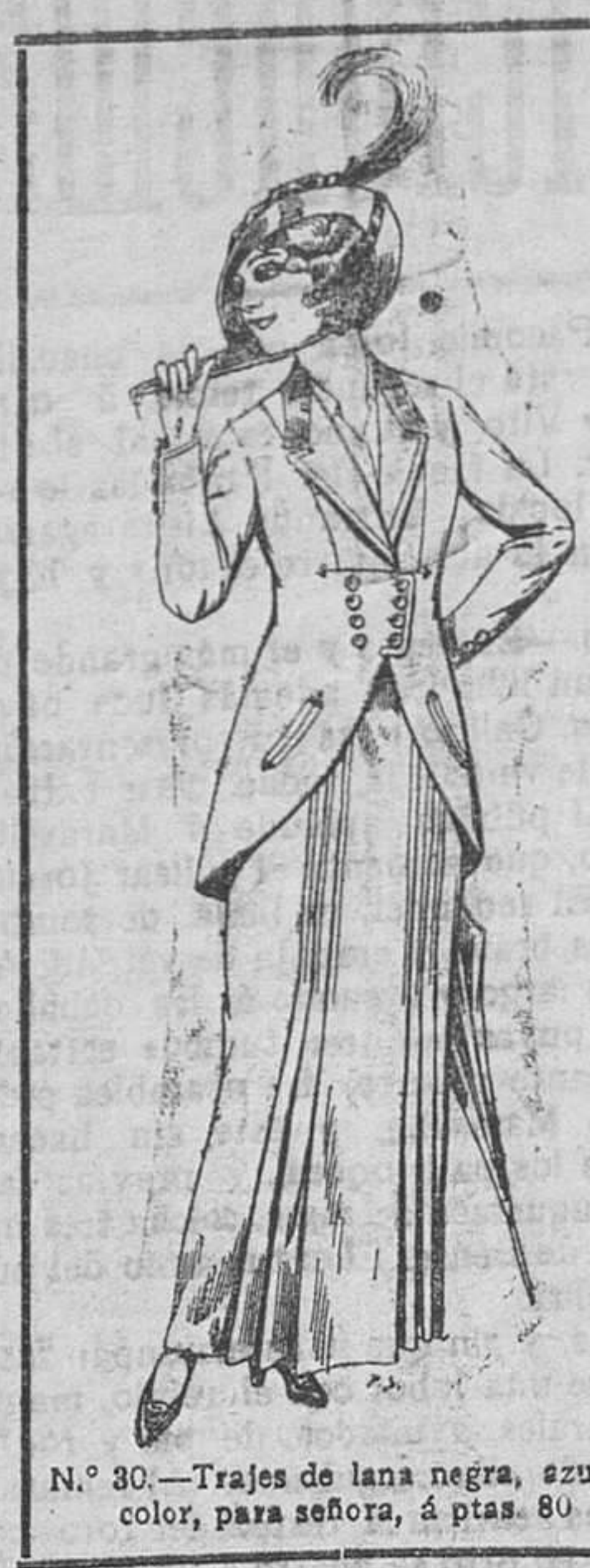
N.º 30.—Trajes de lana negra, azul y color, para señora, á ptas. 80.