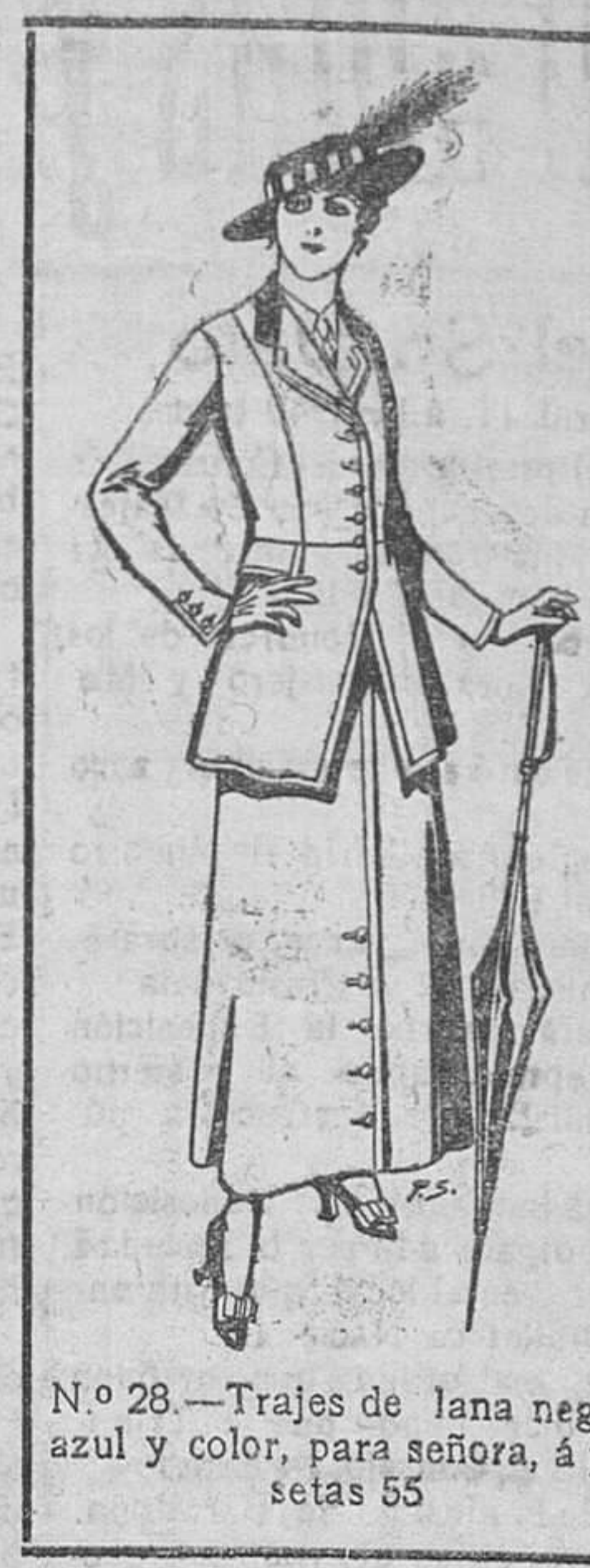
N.º 28.—Trajes de lana negra, azul y color, para señora, á pesetas 55.