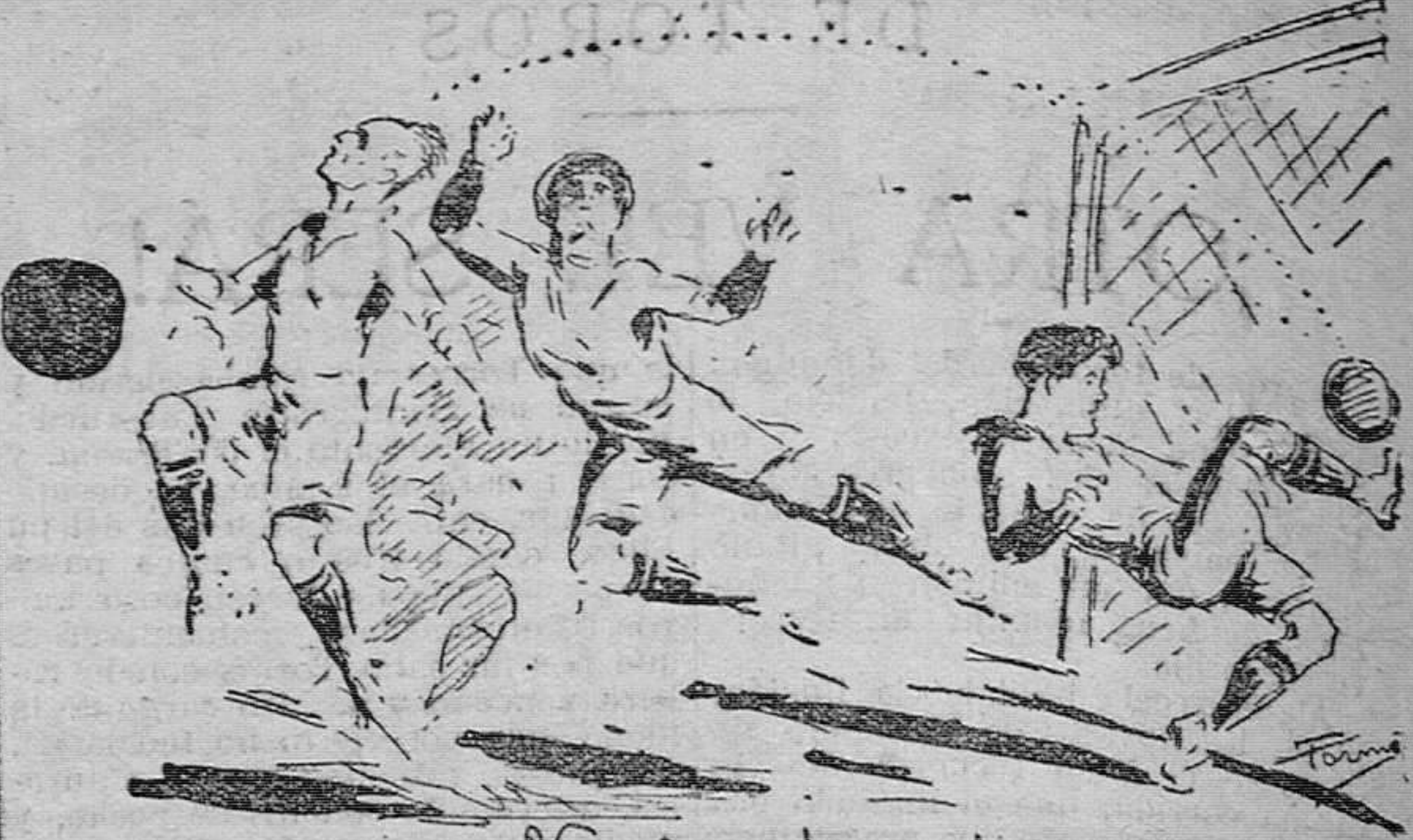
Una jugada en la puerta madriena que fué muy desafortunada de seguir.