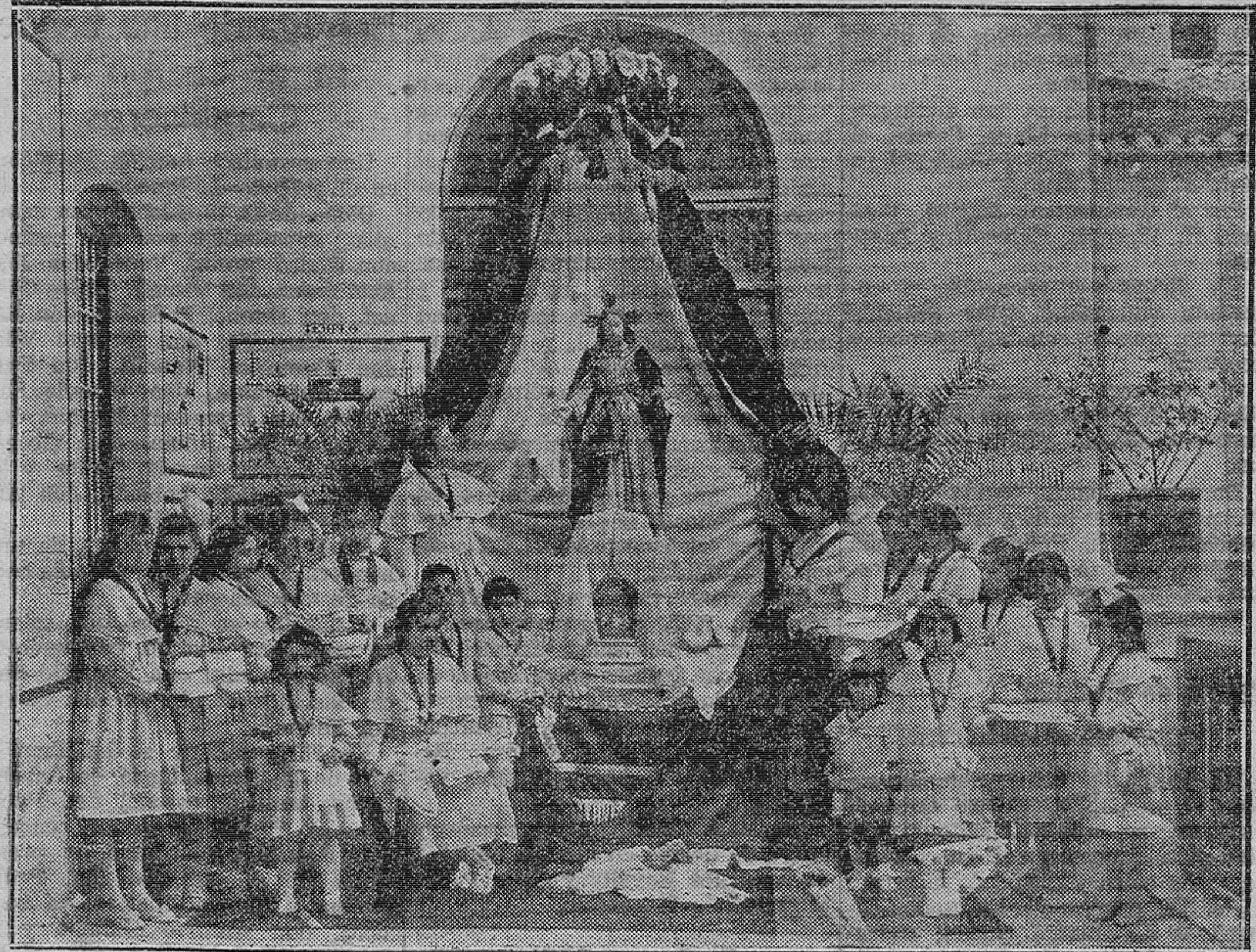
Capilla del Colegio de María Inmaculada

La práctica de relaciones sociales; modos de saludar según la categoría de las personas; vestios para paseos, visitas, teatro, iglesia; porte en los banquetes; cartas de amigas, a las autoridades, etc. De la maestría y originalidad que distinguen a estas religiosas, es prueba fehaciente, tanto las acabadísimas labores que presentan en sus Exposiciones, como el hecho de tener alumnas internas de Valen-