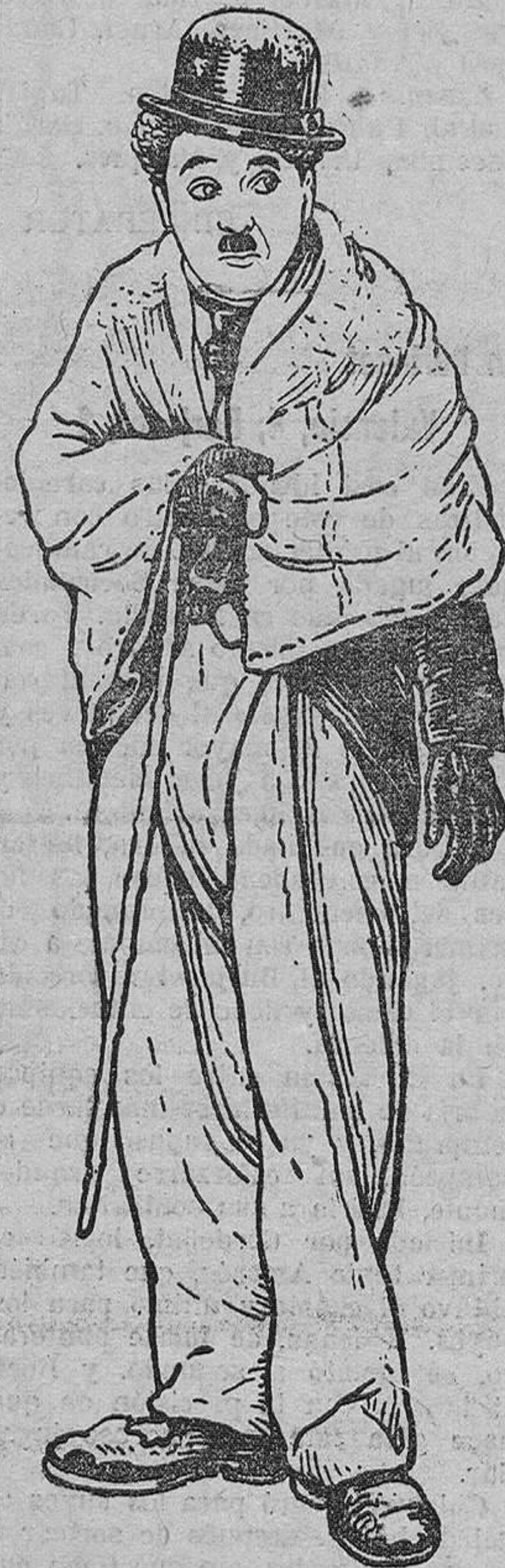
CHARLES CHAPLIN "CHARLOT" EN