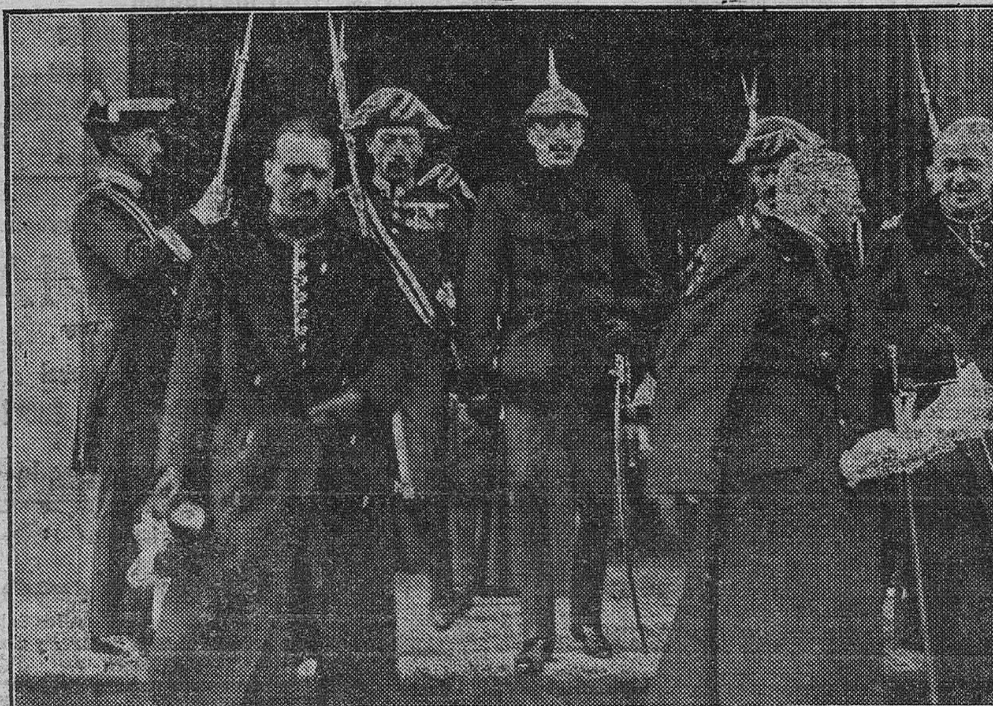
S. M. el Rey al salir de los funerales por don Antonio Maura, en San Francisco el Grande, que han sido costeados por el Gobierno