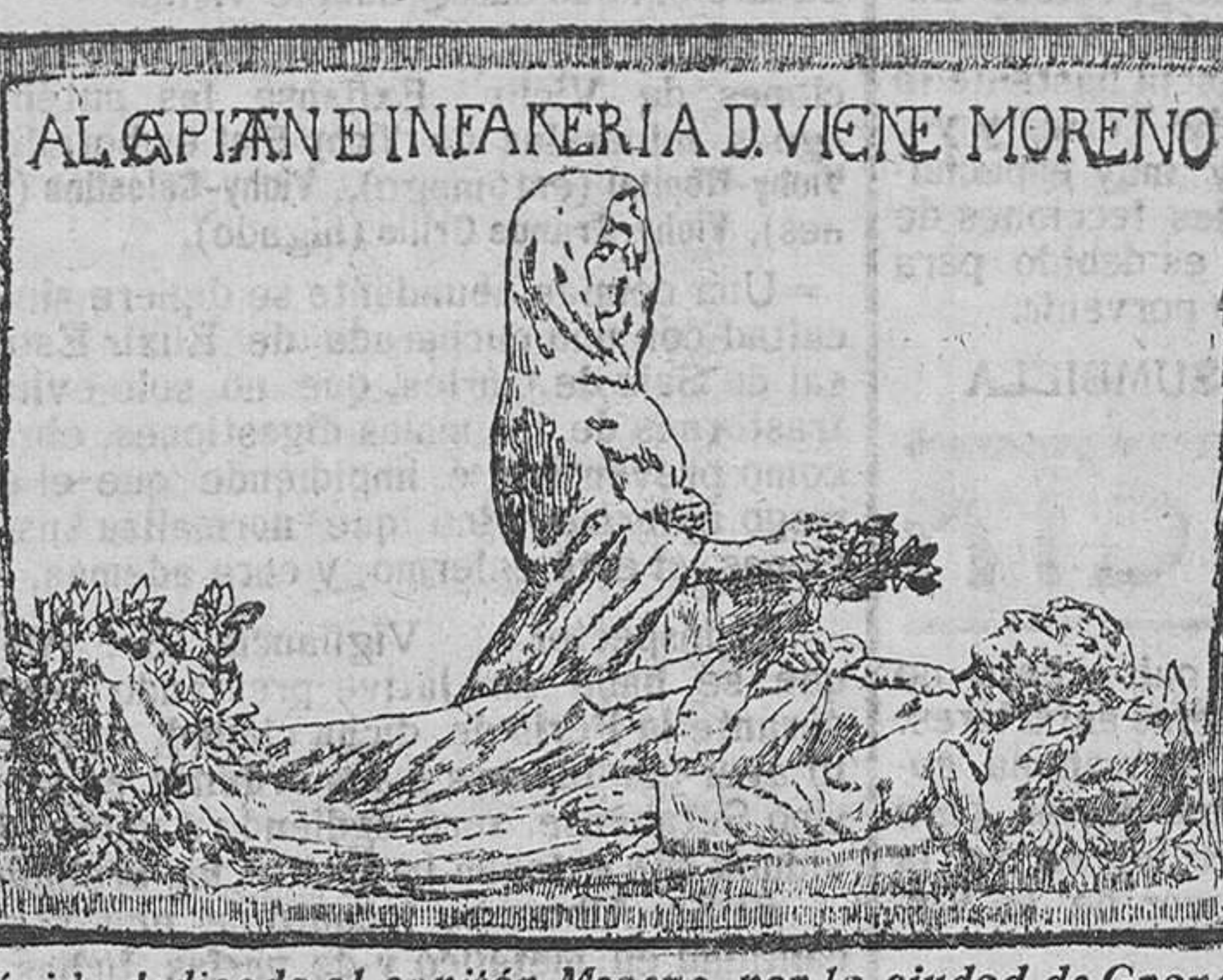
Lápida dedicada al capitán Moreno, por la ciudad de Granada

Cien años se han cumplido desde que el heroico capitán Moreno, gloria del ejército español y del regimiento de Melilla, en el que prestaba sus servicios peleando contra las huestes napoleónicas, sacrificó su vida en aras de la independencia española, muriendo como un héroe y como un mártir en la ciudad de Granada y dando un sitio ejemplo de civismo, de lealtad al juramento prestado y de amor patria.