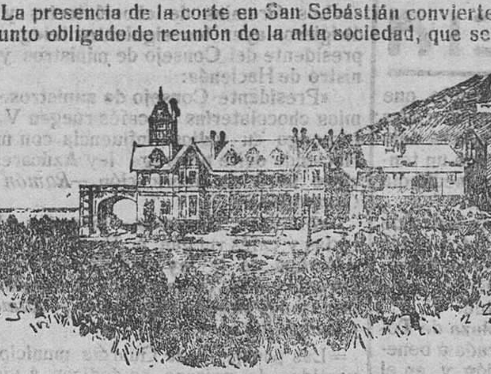
El palacio de Miramar.