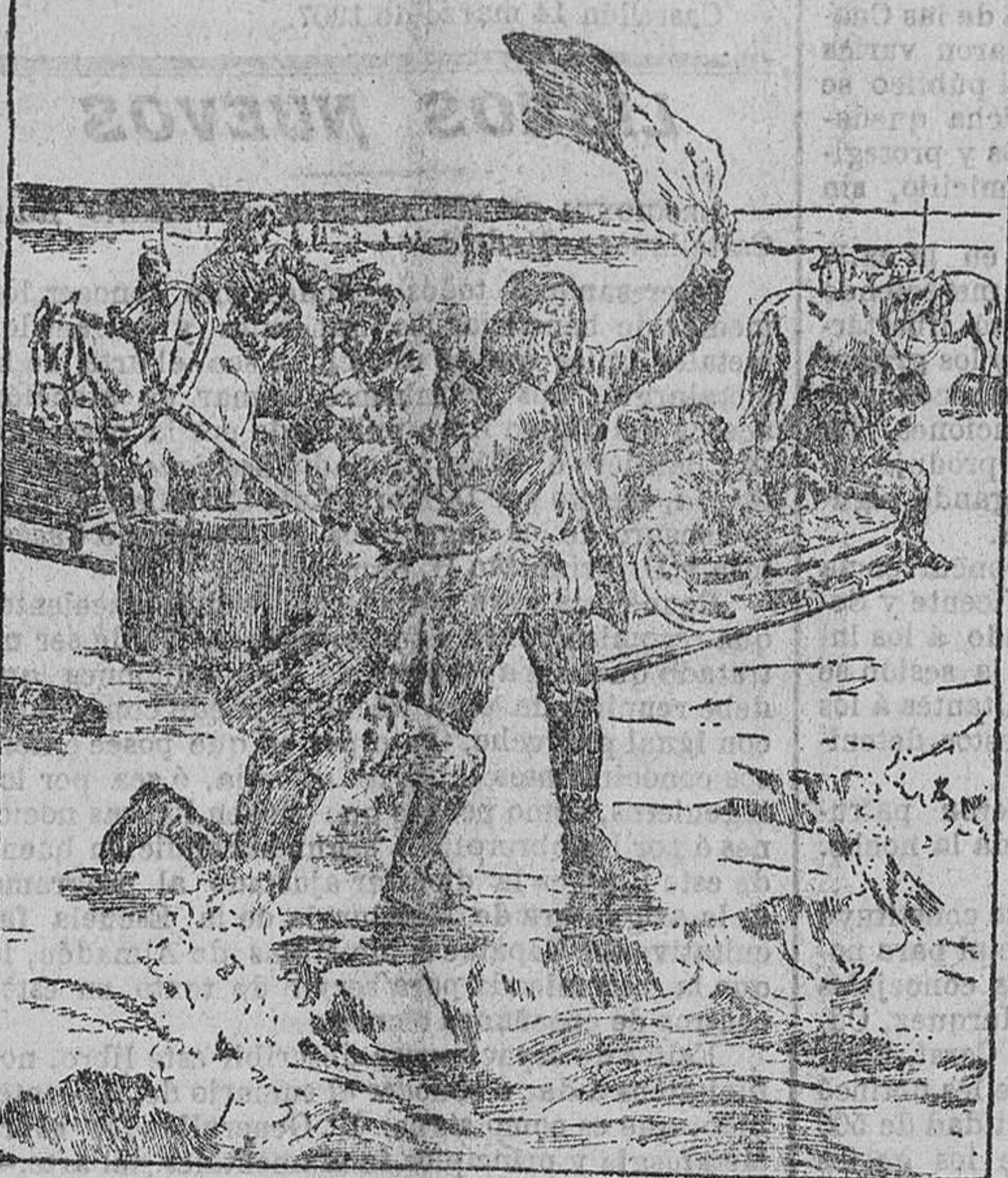
Pescadores escandinavos sobre un témpano de hielo

Las grandes depresiones que vienen sucediéndose casi sin interrupción en los mares del Norte desde mediados de febrero, han producido en las costas de Viborg, en el golfo de Finlandia, una catástrofe en que han perecido varias familias.