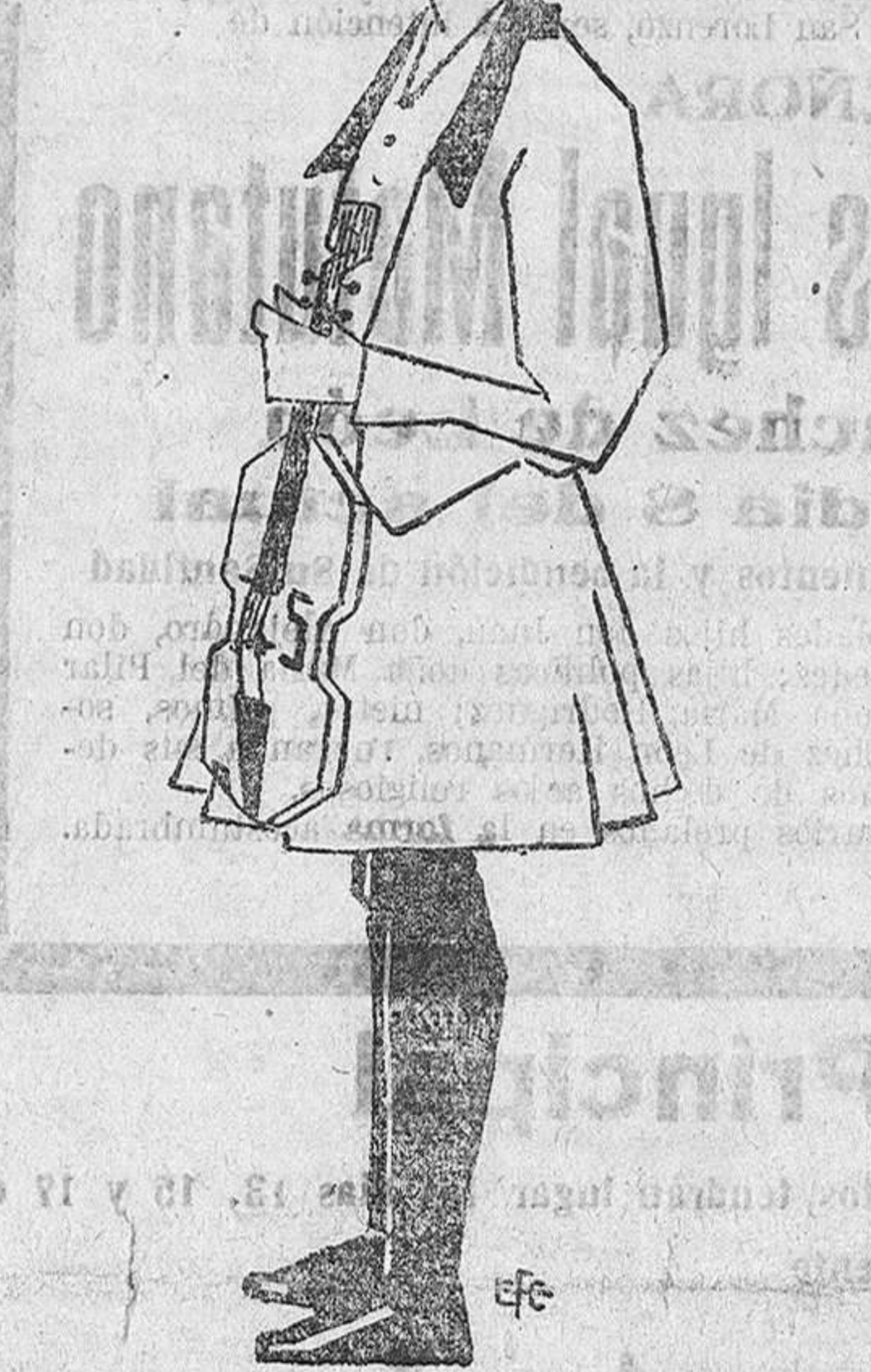
El Duque de El...

La dama misteriosa a quien dediqué estas líneas es la señora Braddyll, pintada por Reynolds.