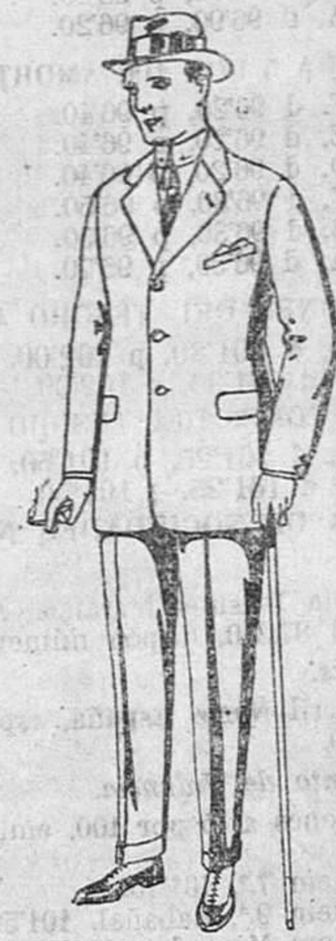
Trajes de cheviot, con cinturón, elegante corte, para sportman. De ptas. 53 a 125.