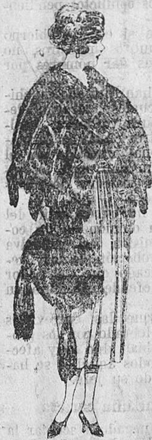
Juego pieles, imitación Renard negro. De ptas. 100 a 150.