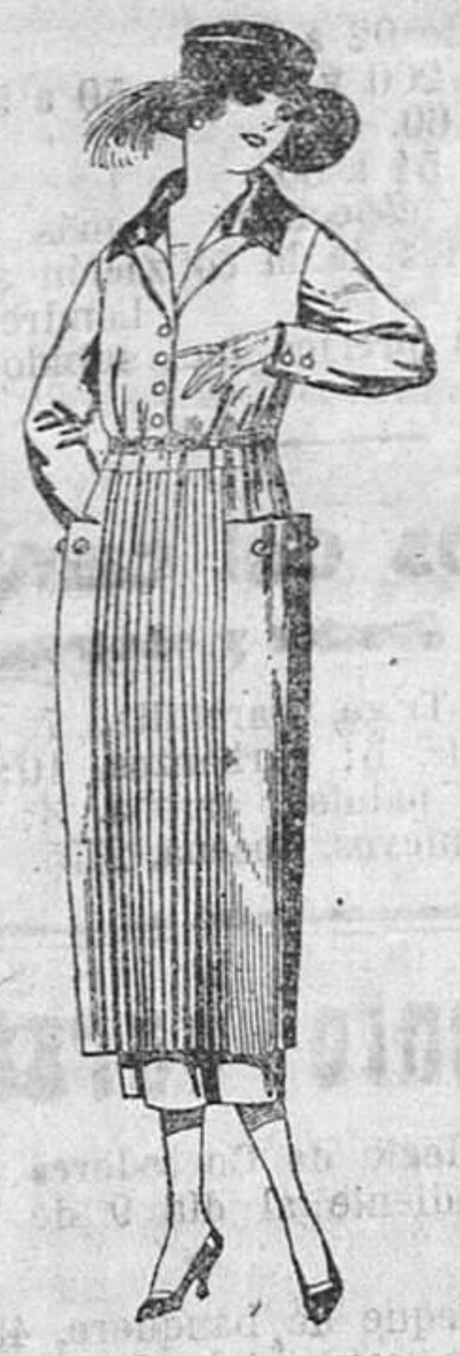
Vestidos de sarga inglesa, estambre, etc., en negro, azul y color, adornos punto. De ptas. 118 a 150.