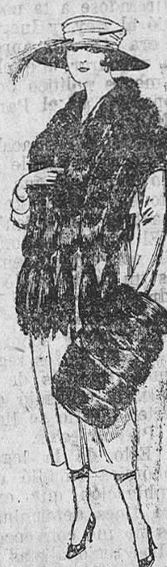
Juego pieles, imitación "Columbia", negro. De ptas. 40 a 100.