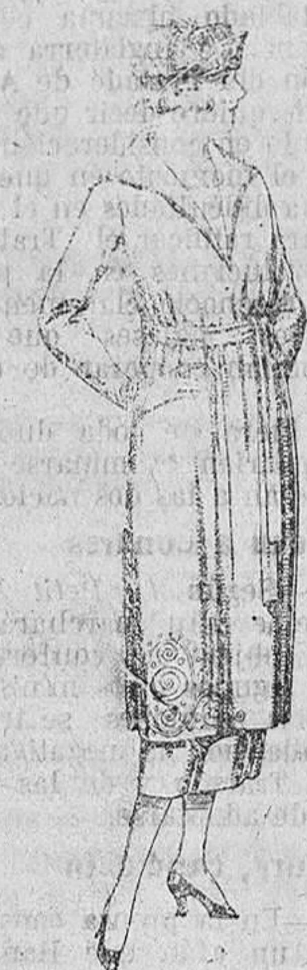
Vestidos de punto, de lana azul y color, adornos bordados. De ptas. 145 a 250.