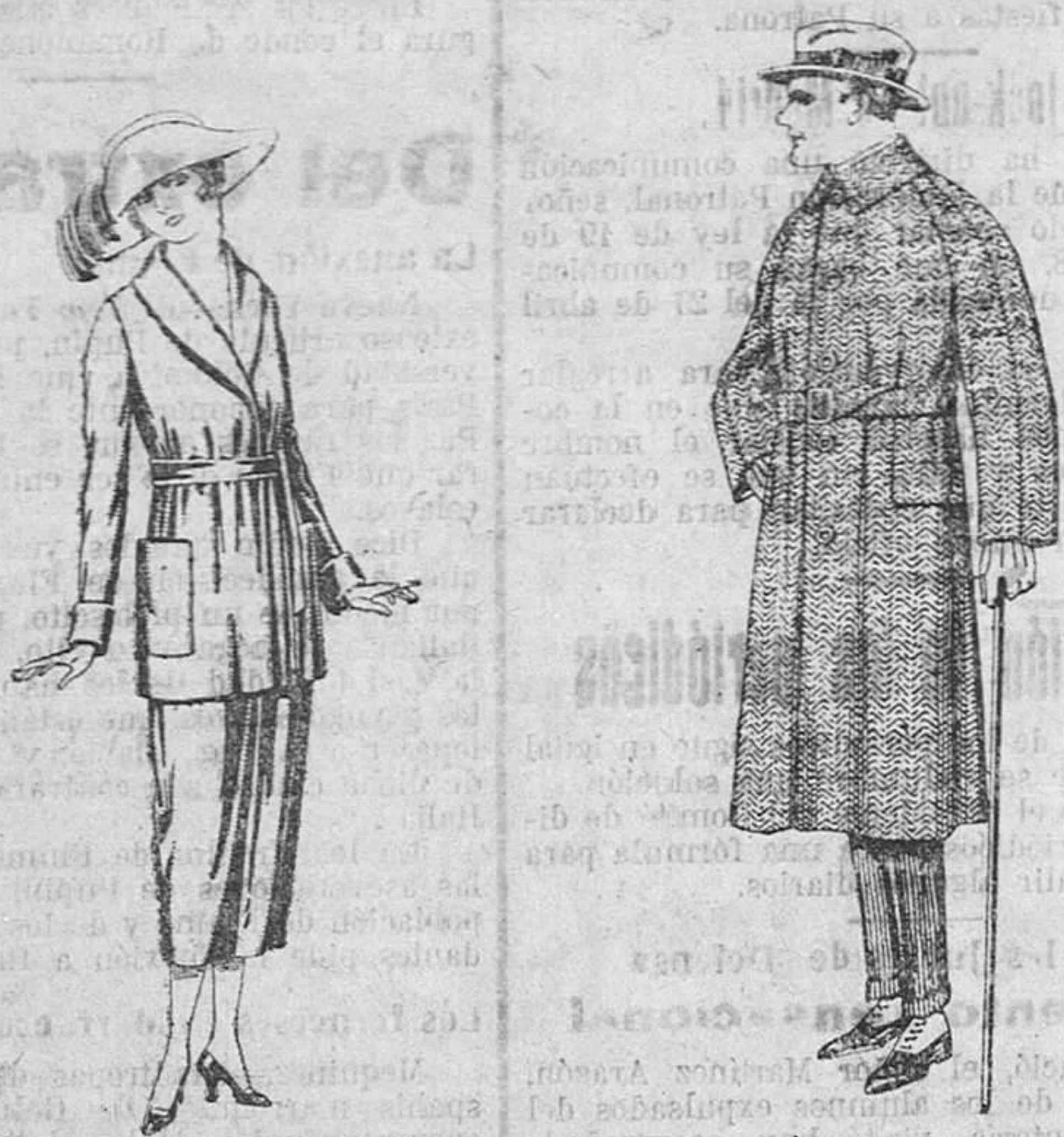
Trajes de punto, de lana, en negro, azul y colores. De ptas. 150 a 250.

Madrid, Barcelona, Alicante, Almería, Bilbao, Cádiz, Cartagena, Gijón, Granada, Málaga, Palma de Mallorca, Santander, Sevilla, Valladolid y Zaragoza.