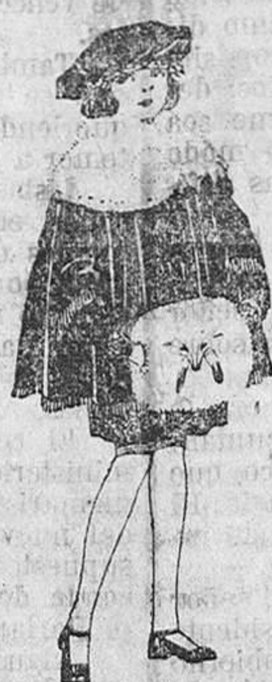
Juego de pieles blanco, imitación armiño, para niñas. De ptas. 16 a 21.