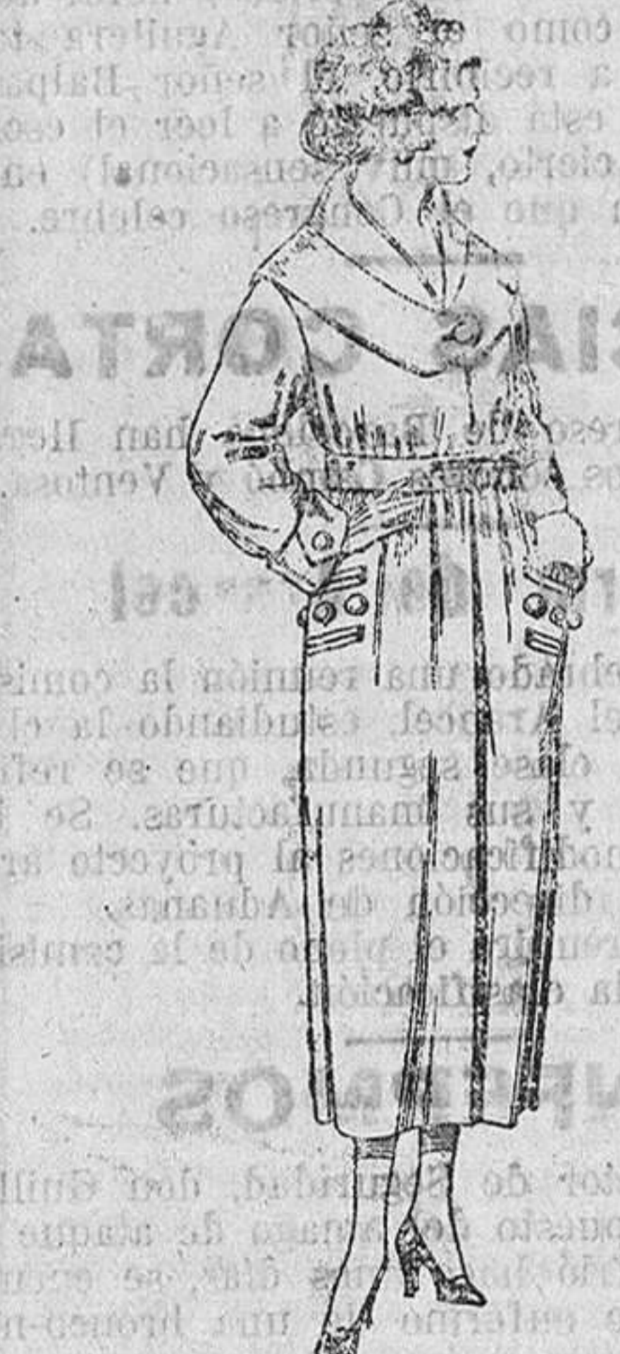
Abrigos de gamuza, pañolet, etc., en negro, azul y color. De ptas. 45 a 90.