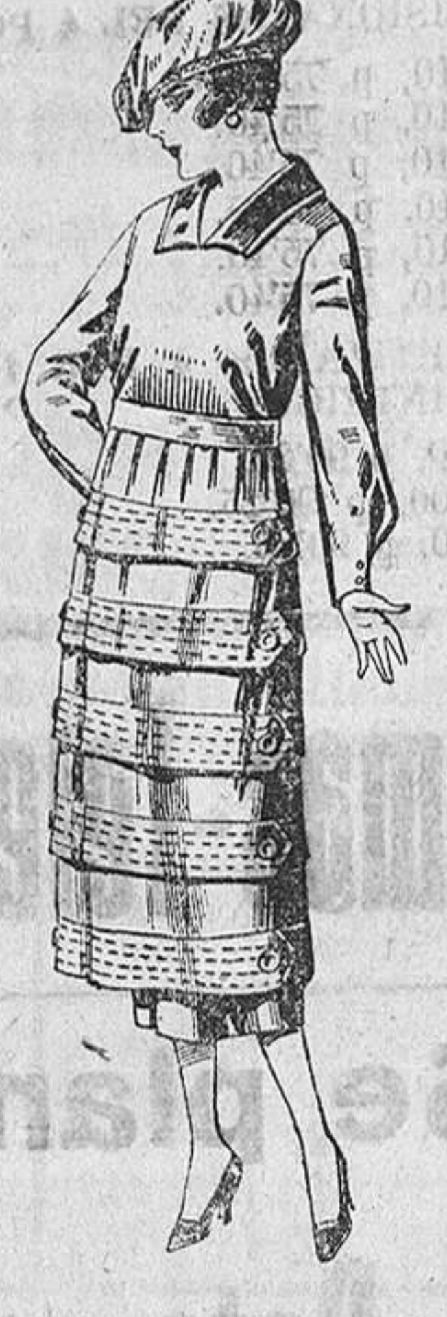
Vestidos de estambre, gabardina, sarga, etc., en negro, azul y color, pespunte de adorno. De ptas. 110 a 140.

Ropas confeccionadas para caballero, señora, niño y niña. Peletería, Camisería, Géneros de punto, Corbatería, Guantería, Sombrerería, Zapatería, Paraguas, :: Bastones y Artículos de viaje ::