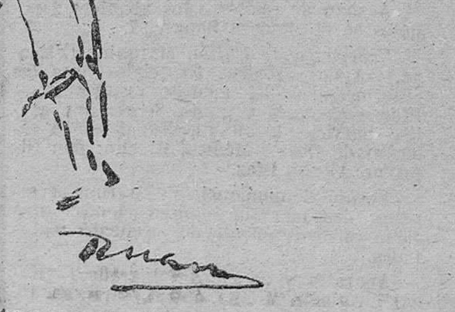
Galito rematando un pase

¡Adiós, torero gitano! ¡Adiós, rey de los colores! ¡Adiós, diestro soberano, el mejor de los mejores!