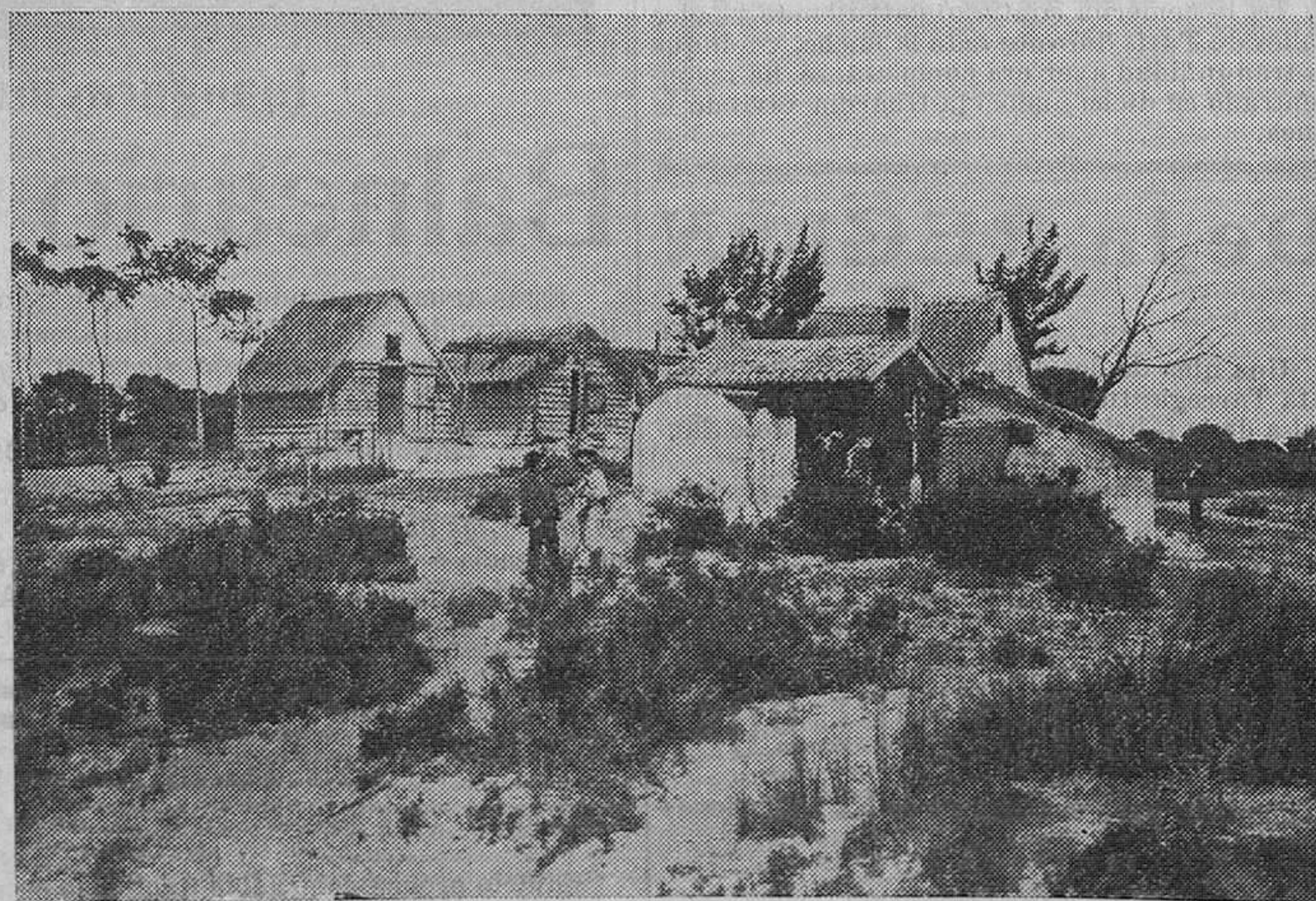
La Mata del Fanch.

Y se está dando el caso, por demás dolorosísimo, que mientras la codicia de unos cercena terrenos á la laguna, la ambición de otros pretende apoderarse de la Dehesa, y á seguir por este camino, no ha de tardar el día en que nuestra famosa Albufera desaparezca del mapa, convertida en merienda de negros, sin beneficio