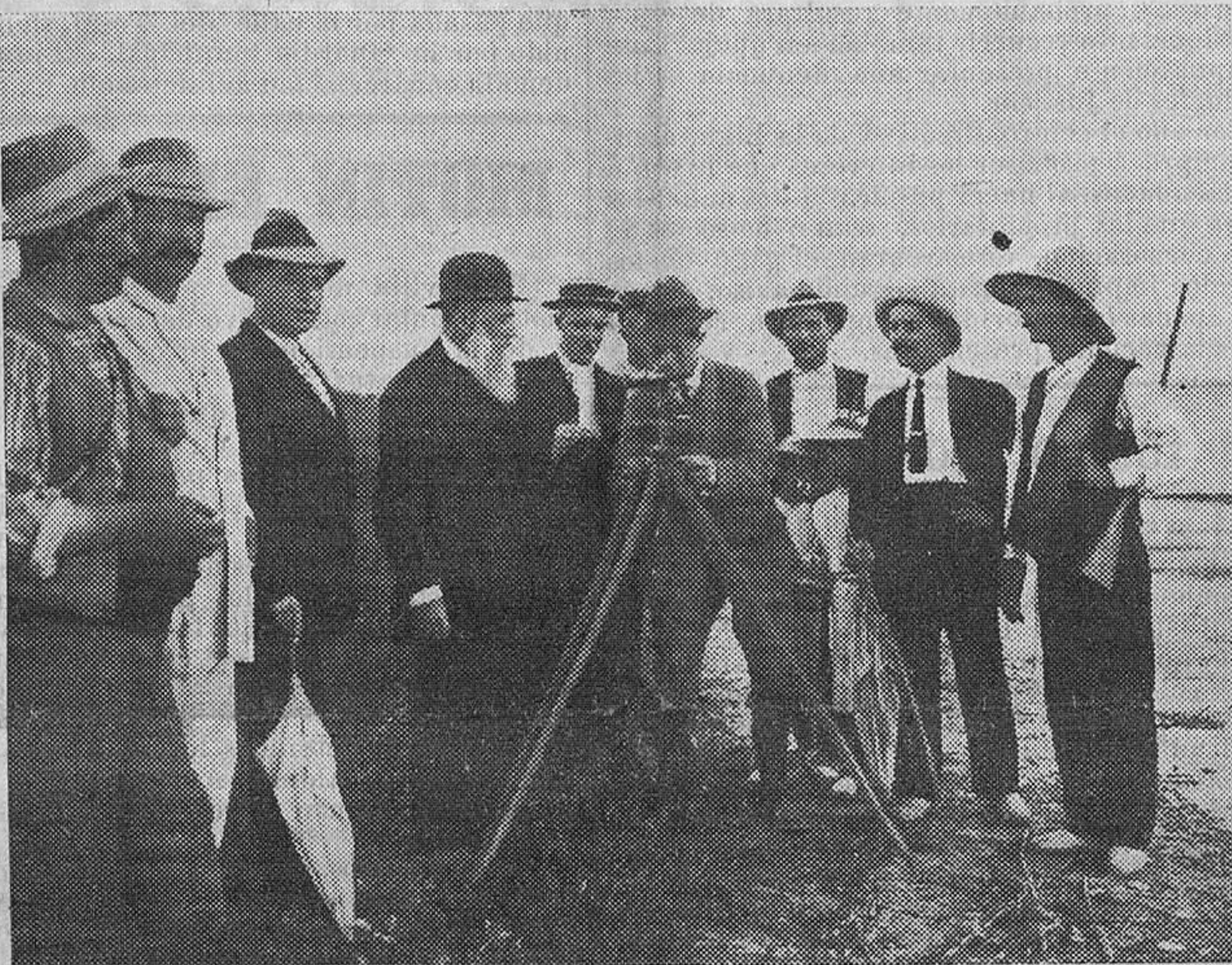
Los ingenieros investigando el limite del terreno de las supuestas minas.