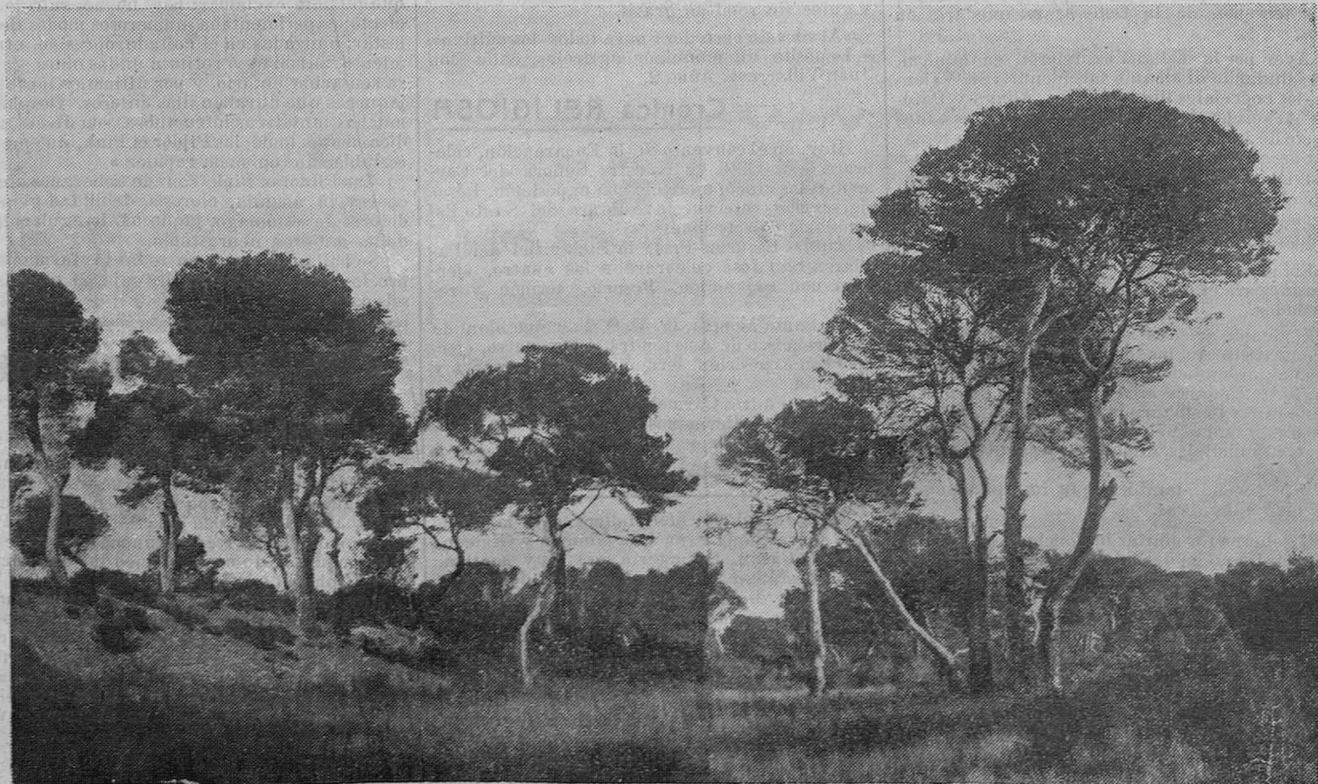
Interior de la Dehesa.

Y algo análogo ocurre con la caza y la pesca, que constituyen, como puede verse por