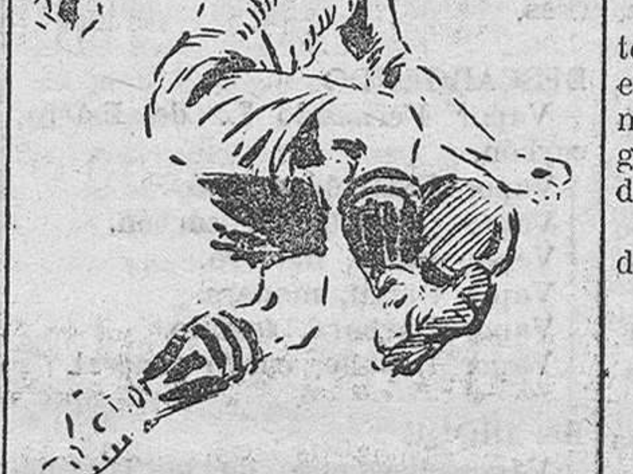
Chacar preparando el balón para el gol