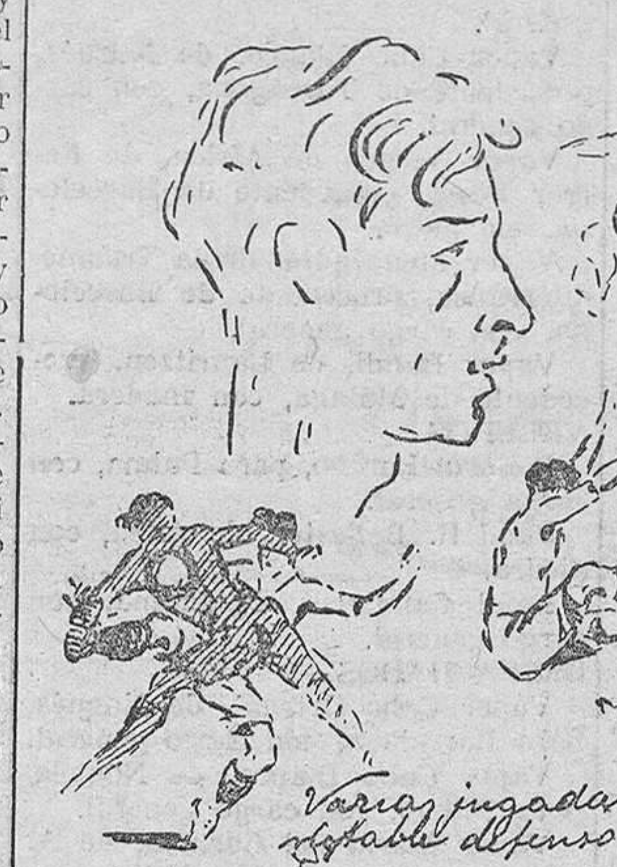
Varias jugadas del notable defensor Perico