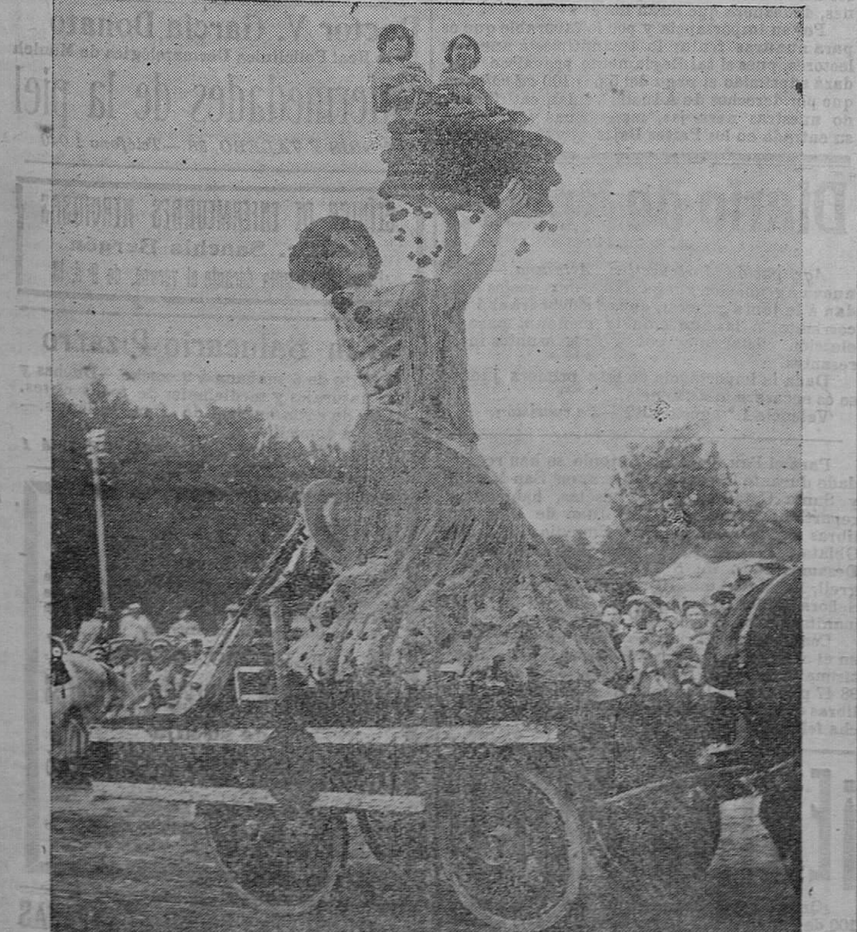
Coche presentado por el Ateneo Mercantil