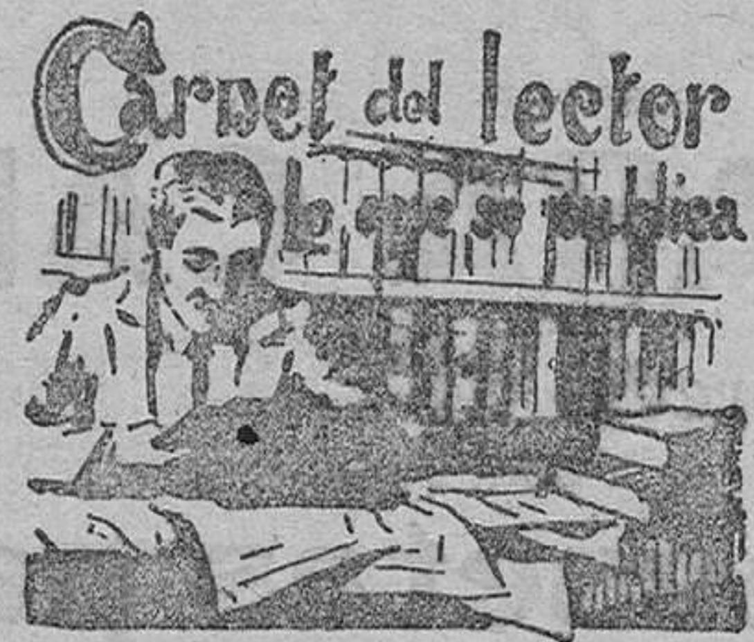
NOUEVOS CANTARES, por Narciso Díaz de Escovar.