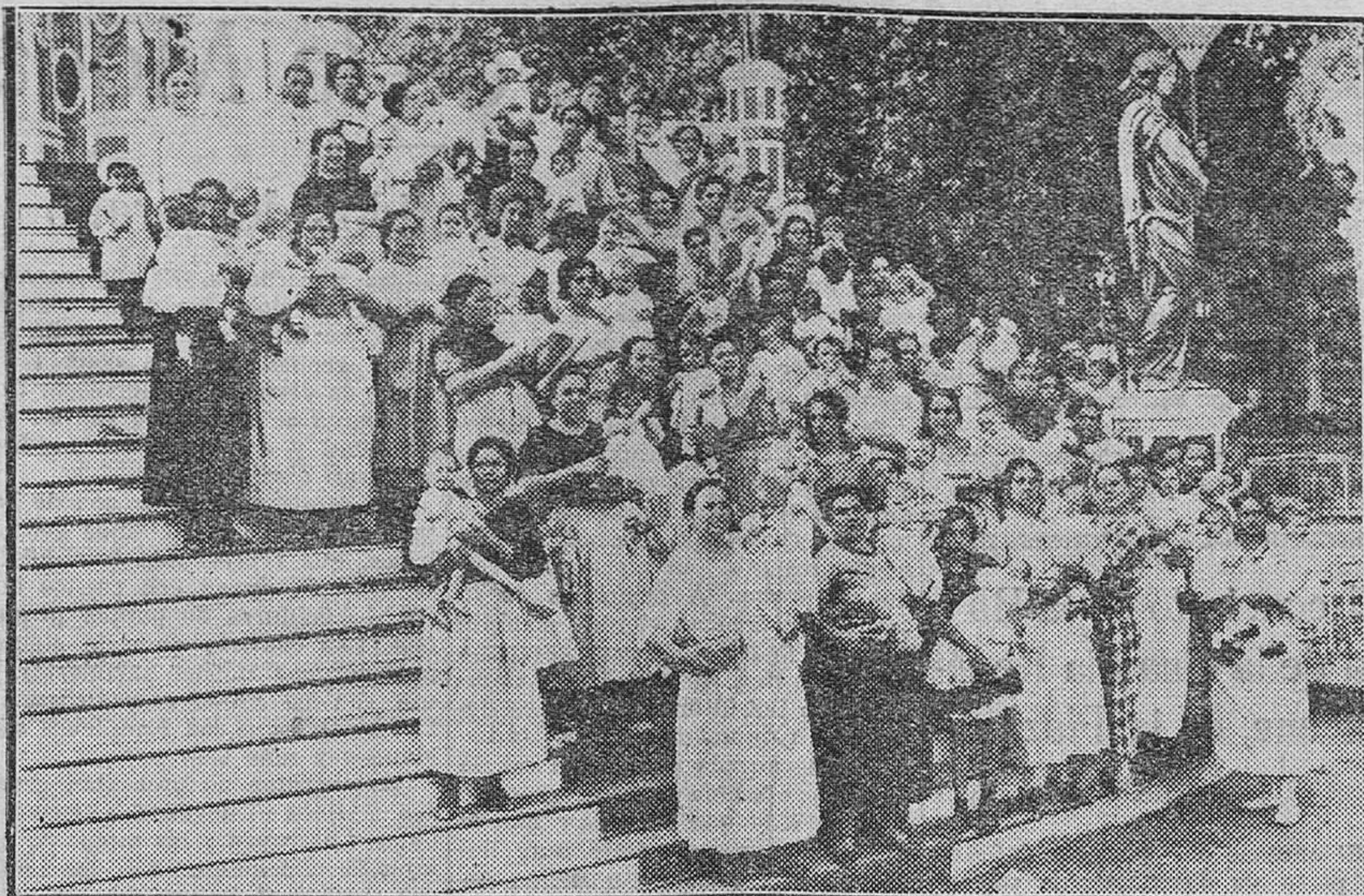
Grupo de madres lactantes que han obtenido premio en el Concurso abierto por la Junta de Protección a la Infancia