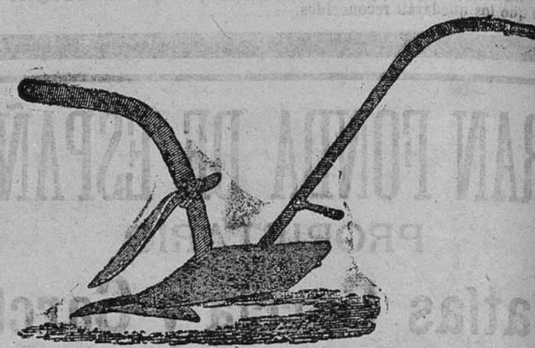
Arado para viñas, Pesetas 37'50

Herramientas de todas clases, Bombas, Herrajes para obras, Cubertería de metal blanco, Cuchillería, Tijeras, Máquinas para picar carne, Water-Closets, Palanganeros, Telas metálicas, Corta-naranjas, Tijeras para podar, Cafeteras.