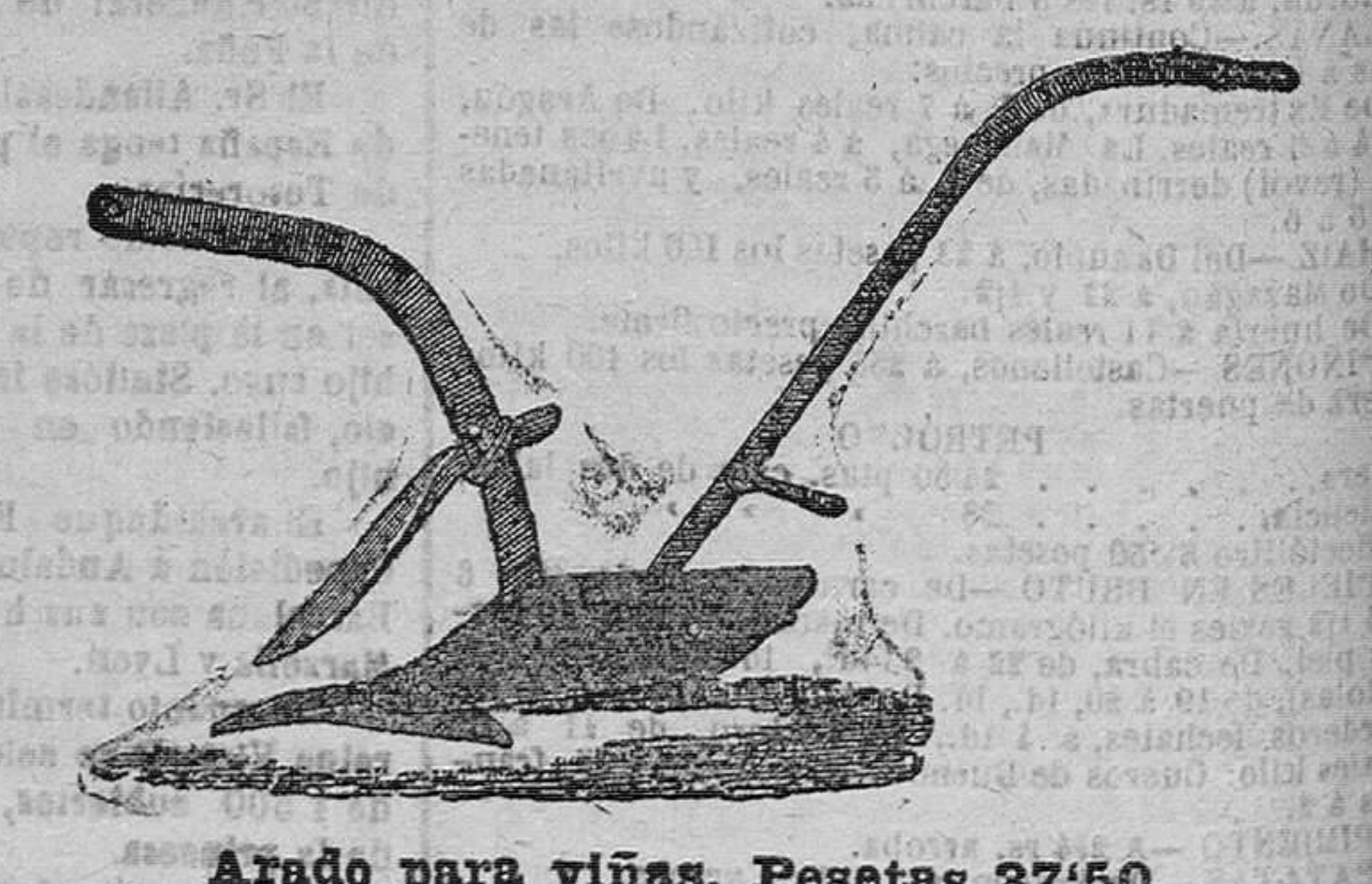
Arado para viñas, Pesetas 37-50

Herramientas de todas clases, Bombas, Herrajes para obras, Cubertería de metal blanco, Cuchillería, Tijeras, Máquinas para picar carne, Water-Closets, Palanganeros, Telas metálicas, Corta-naranjas, Tijeras para podar, Cafeteras.