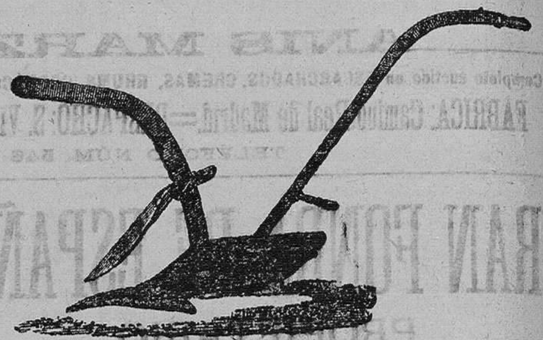
Arado para viñas, Pesetas 37'50

Herramientas de todas clases, Bombas, Herrajes para obras, Cubertería de metal blanco, Cuchillería, Tijeras, Máquinas para picar carne, Water-Closets, Palanganeros, Telas metálicas, Corta-naranjas, Tijeras para podar, Cafeteras.