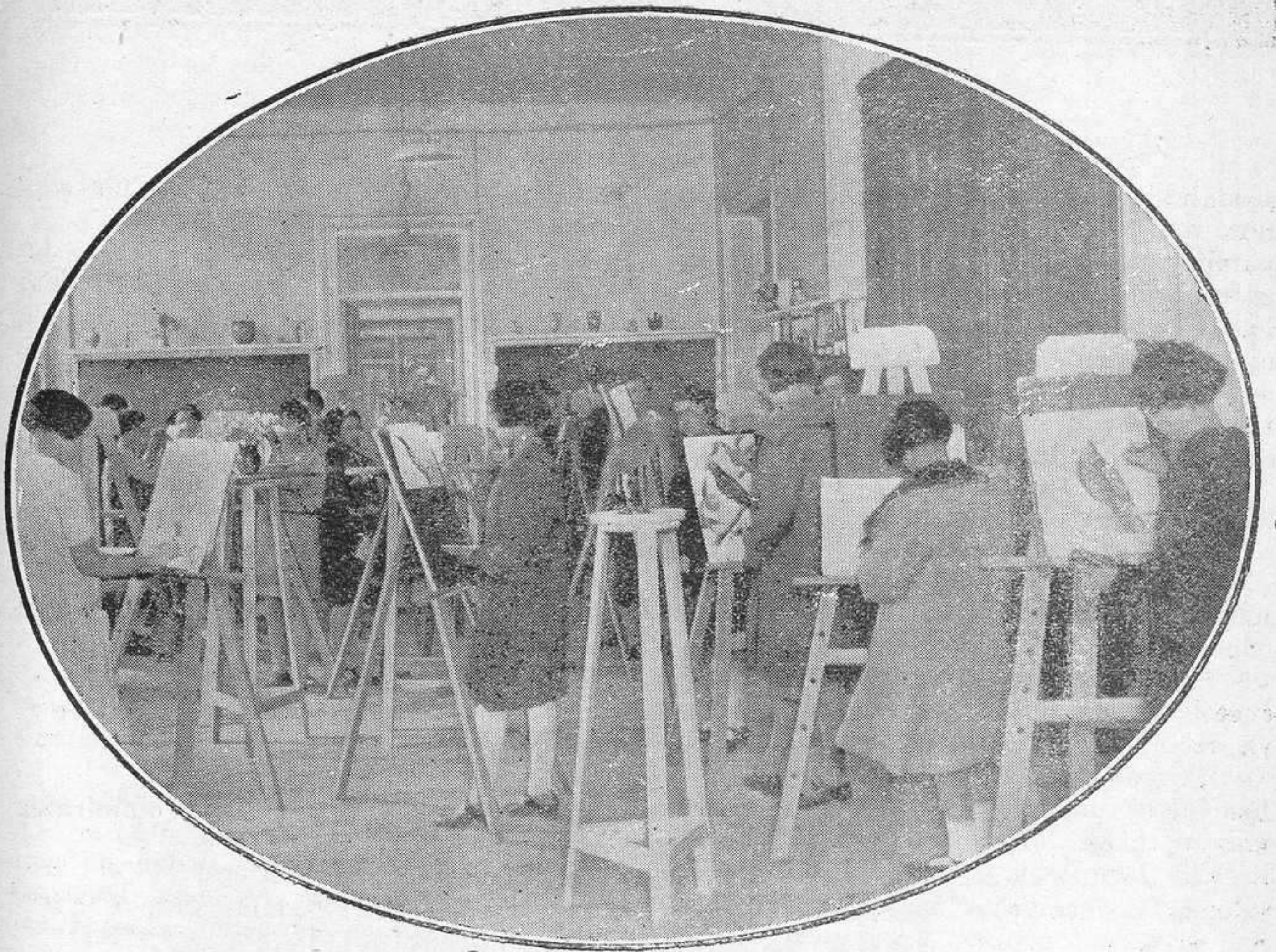
La clase de dibujo.

jamás faltan flores, que ellas mismas adquieren con las aportaciones de céntimos que todas hacen y que una se encarga de gastar. En todos los grupos hay cargos, desempeñados por los mismos muchachos, unos electivos y otros turnantes. Hay un interventor administrativo, que recoge las cuotas de los niños con destino a excursiones e interviene en las cuentas de éstas; otro, encargado del material de deportes; otro, que anota diariamente las faltas de asistencia de sus compañeros, entregando la nota al profesor, y dos, encargados del arreglo del local, como cosa de la comunidad. Estos, terminada la clase, limpian encerados, abren ventanas, ponen todas las cosas en or-