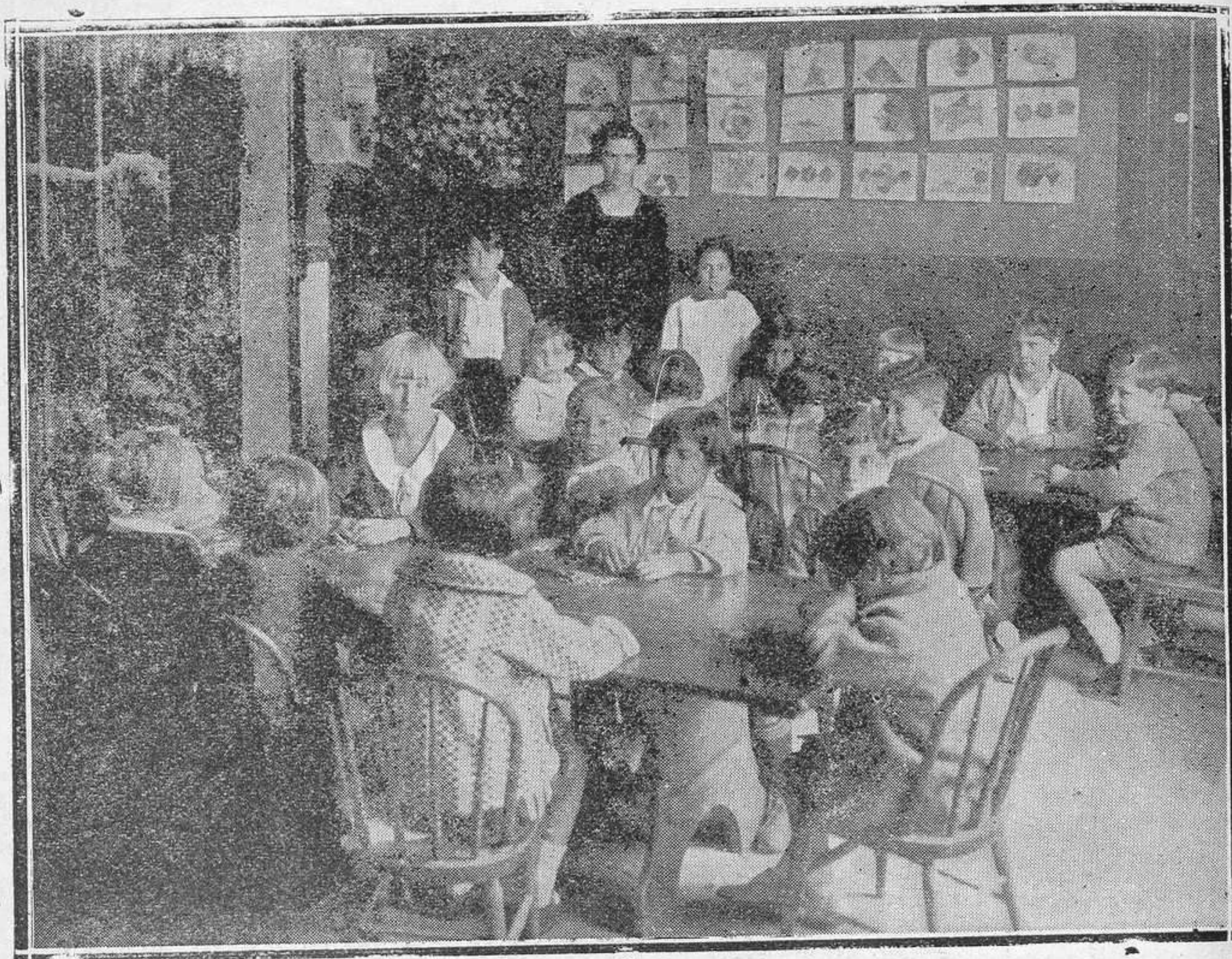
Una clase de párvulos.

vulos hasta la Universidad, es decir, recibe alumnos desde la edad de cinco años y los retiene por lo menos hasta los diez y siete, edad mínima en que puede otorgar el título de Bachiller.»