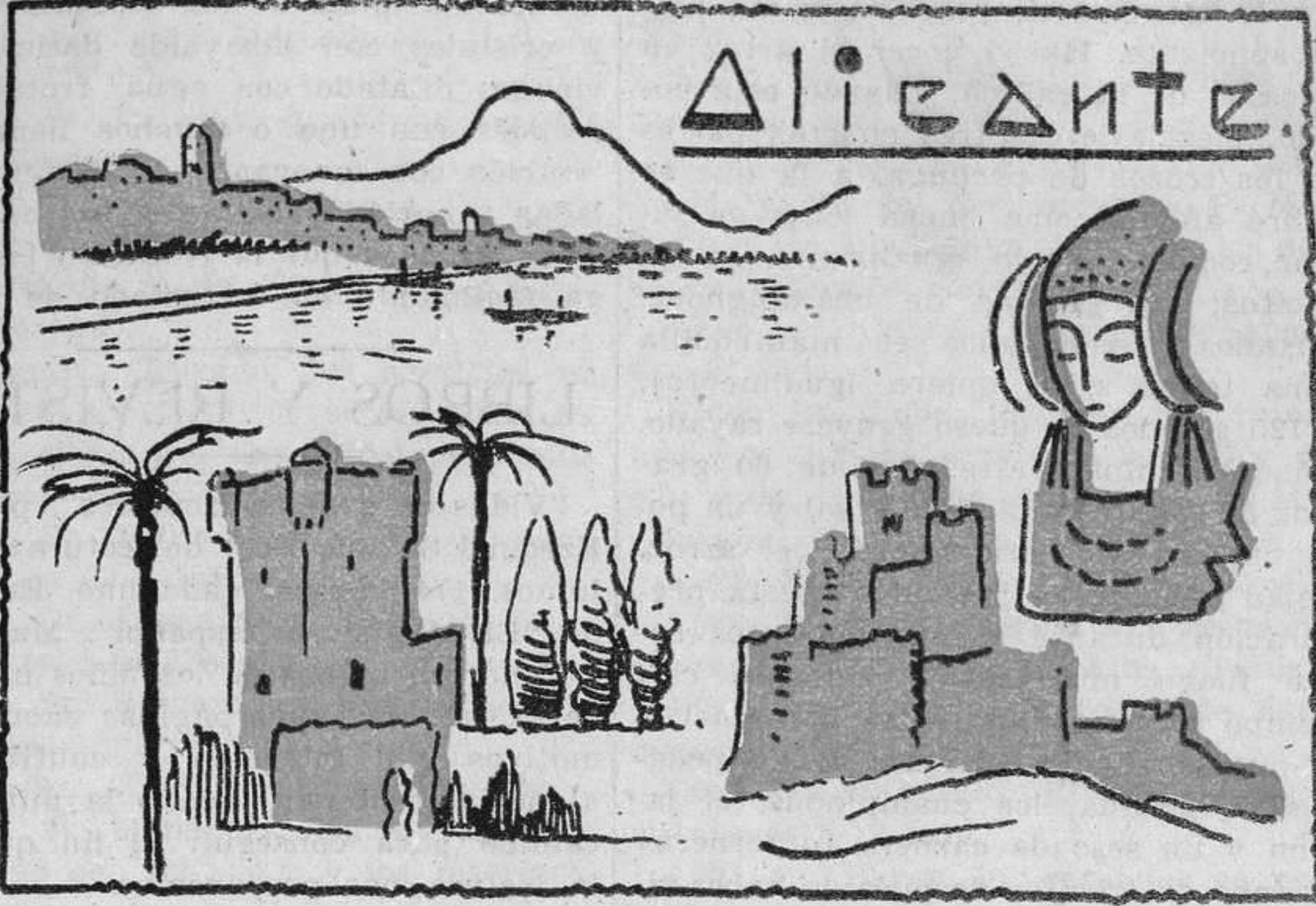
Sencillos esquemas para ilustrar una lección. Vista de la capital, torreón de la Santa Faz, castillo de Villena y busto ibérico. (Elche)