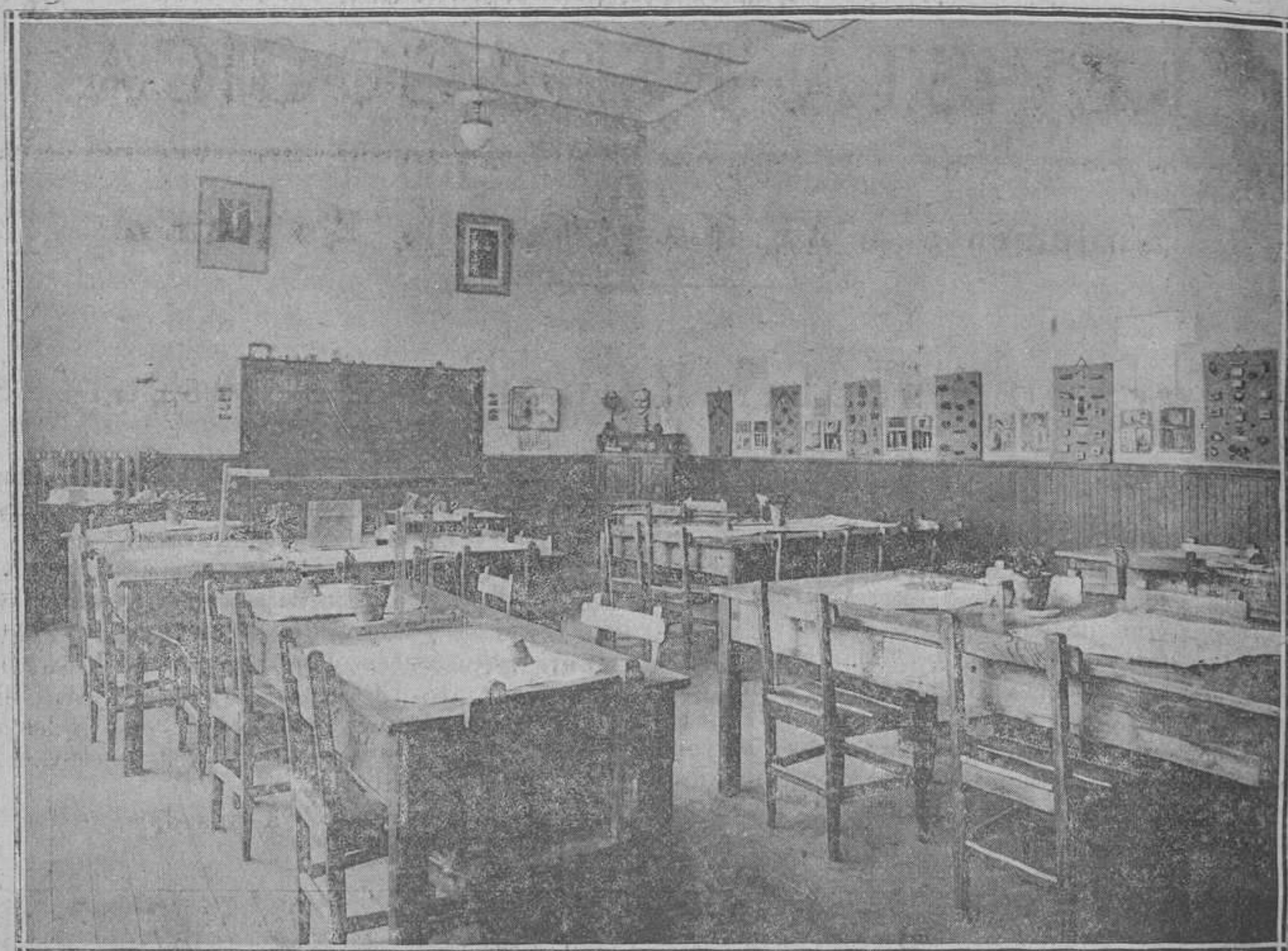
Una de las clases, con el mobiliario plano

un ministro de Instrucción pública, el señor Ruiz Jiménez, gran propulsor de la enseñanza, quiso dotar a Madrid de dos grandes centros de enseñanza primaria que sirvieran a las dos zonas de Madrid de gran censo infantil, perteneciente a familias de la clase más necesitada, de esa tutela cultural. Uno de estos edificios está situado en la glorieta de Cuatro Caminos; otro, del que vamos a ocuparnos, Príncipe de Asturias, ocupa los jardines que un día pertenecieron al Casino de la Reina . Y he aquí cómo aquellos jardines, que fueron hace un siglo solaz y recreo de unos infantes, han vuelto a ser ocupados por otros infantes, que vuelven a alegrar con sus juegos las frondas silenciosas. Los pájaros, que vivían solos, tienen ya la compañía de otros revoltosos pajarillos: los niños.