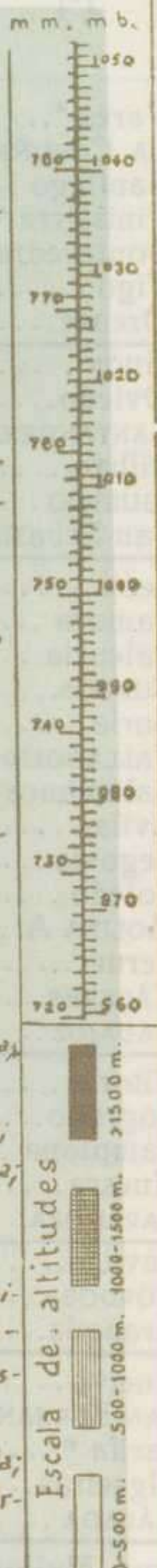
A 1ª (TMG) del Escala de 1:35.000.000

Presión.- Se indica por las isobaras trazadas de 5 en 5 milibares. A, máximo; B, mínimo. Frentes.- frío; cálido; ocluido. Temperatura.- Es el número de la derecha. En los barcos figura bajo un trazo, la del agua. Viento.- Dirección, la de la flecha. Fuerza: calma; 1-4-9-16-23-31-40-K/h. Nubosidad.- despejado; 0,1-1/4-1/2-3/4-0,9; cubierto; cielo invisible. Meteoros.- calma; niebla; + llovizna; e lluvia; aguaceros; * nieve; tormenta; granizo. Para cualquier meteoro, x; |x, aumenta; |x|, disminuye; x|, cesa; |x|, intermitente; (x), a la vista; , más intenso. Mar.- marejada; gruesa; Arbolada.