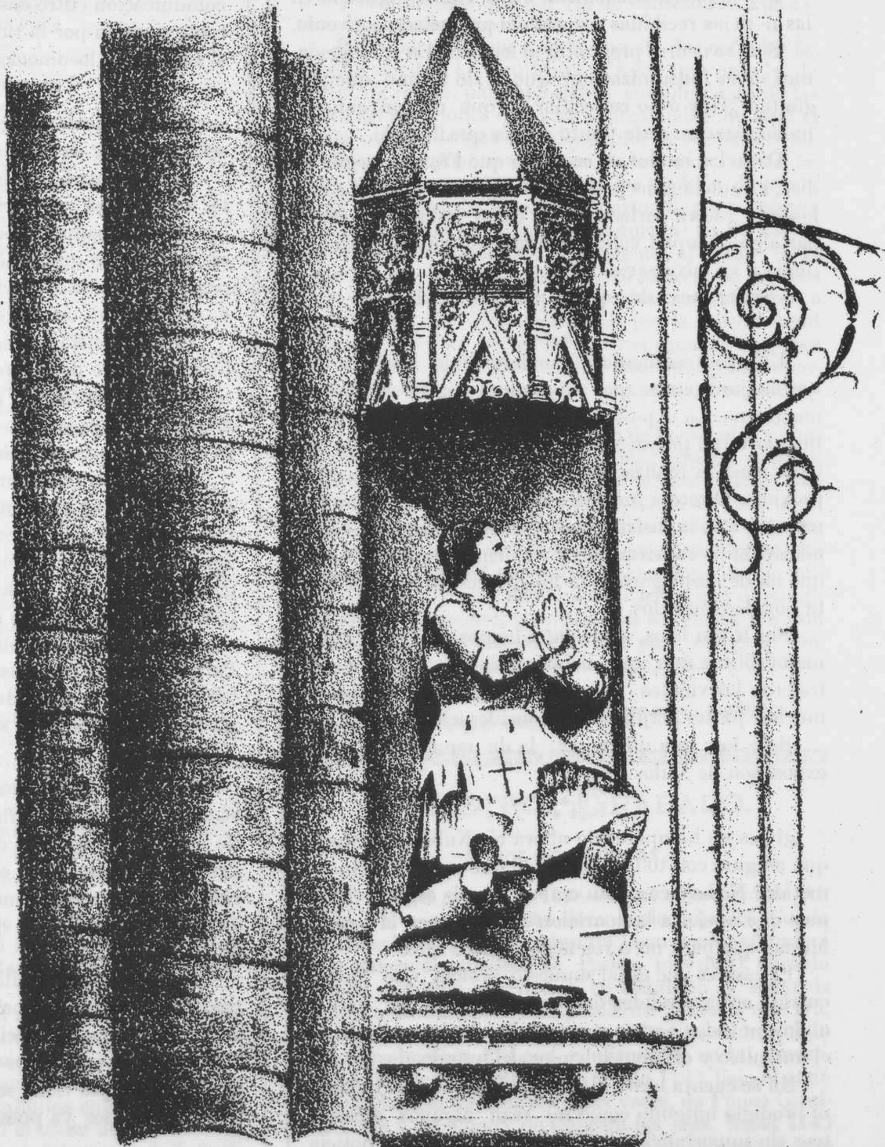
SEPULCRO DE PONCE DE GABRERA.