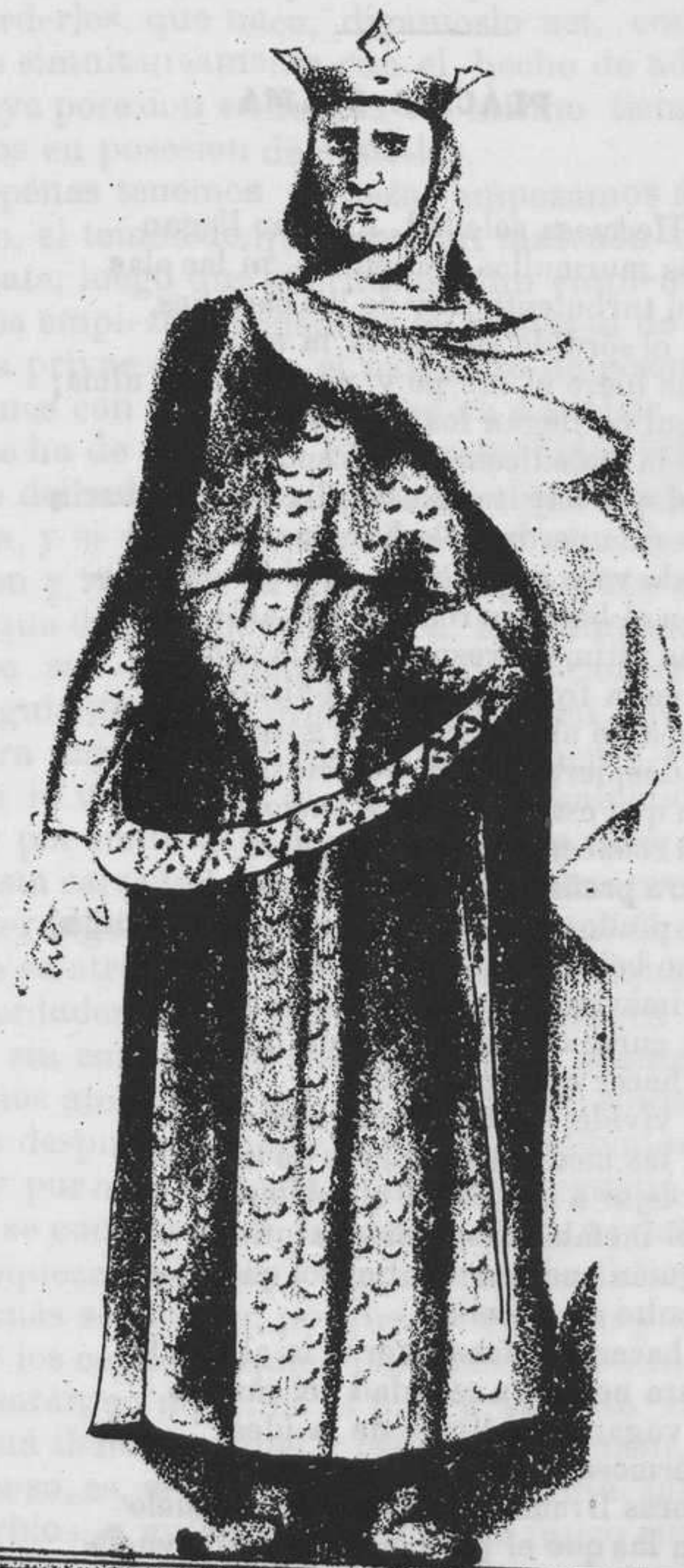
DON JUAN II

Se suscribe en la calle de la Rúa, 31. Correspondencia Sacramento