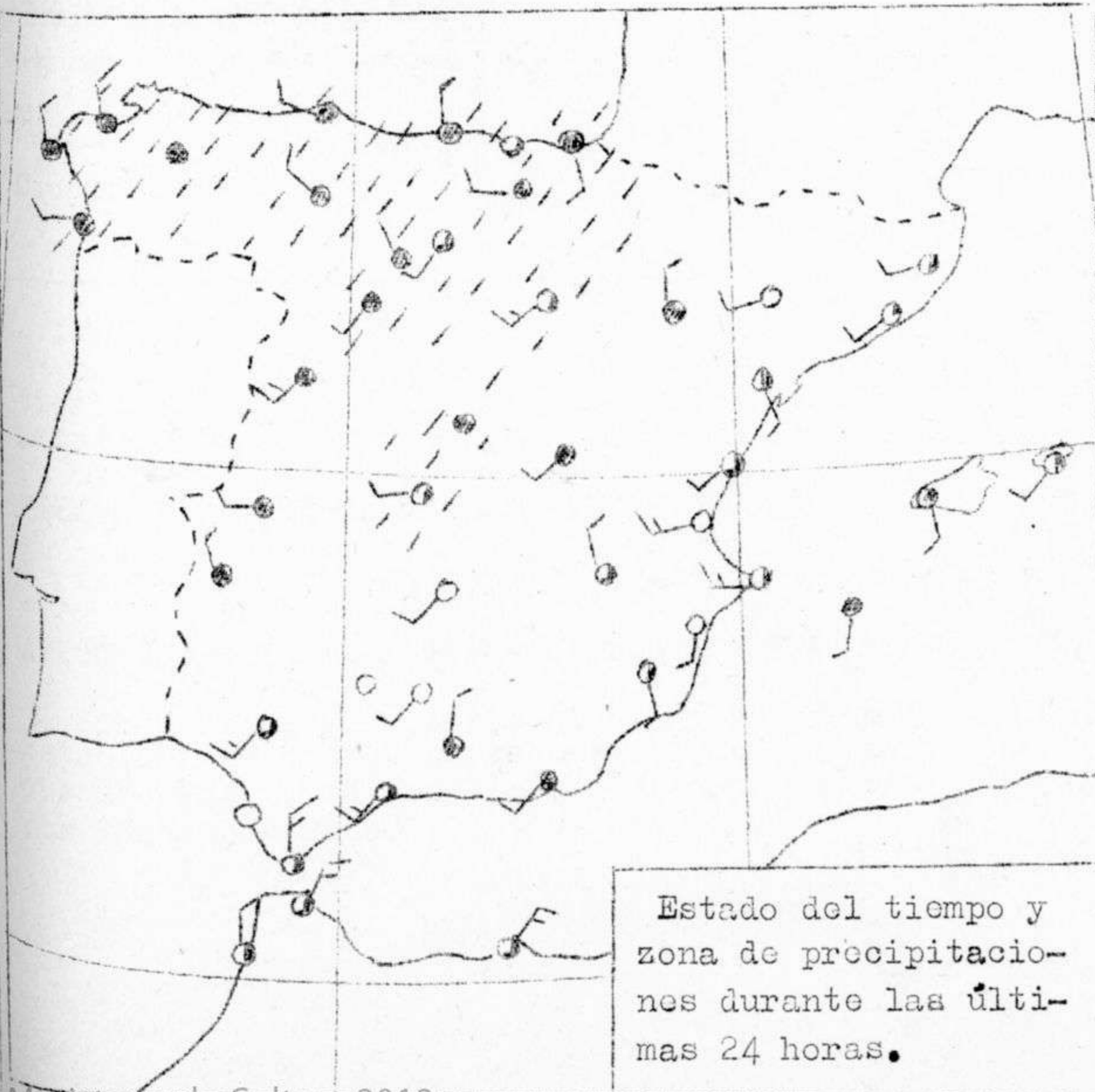
Estado del tiempo y zona de precipitaciones durante las últimas 24 horas.