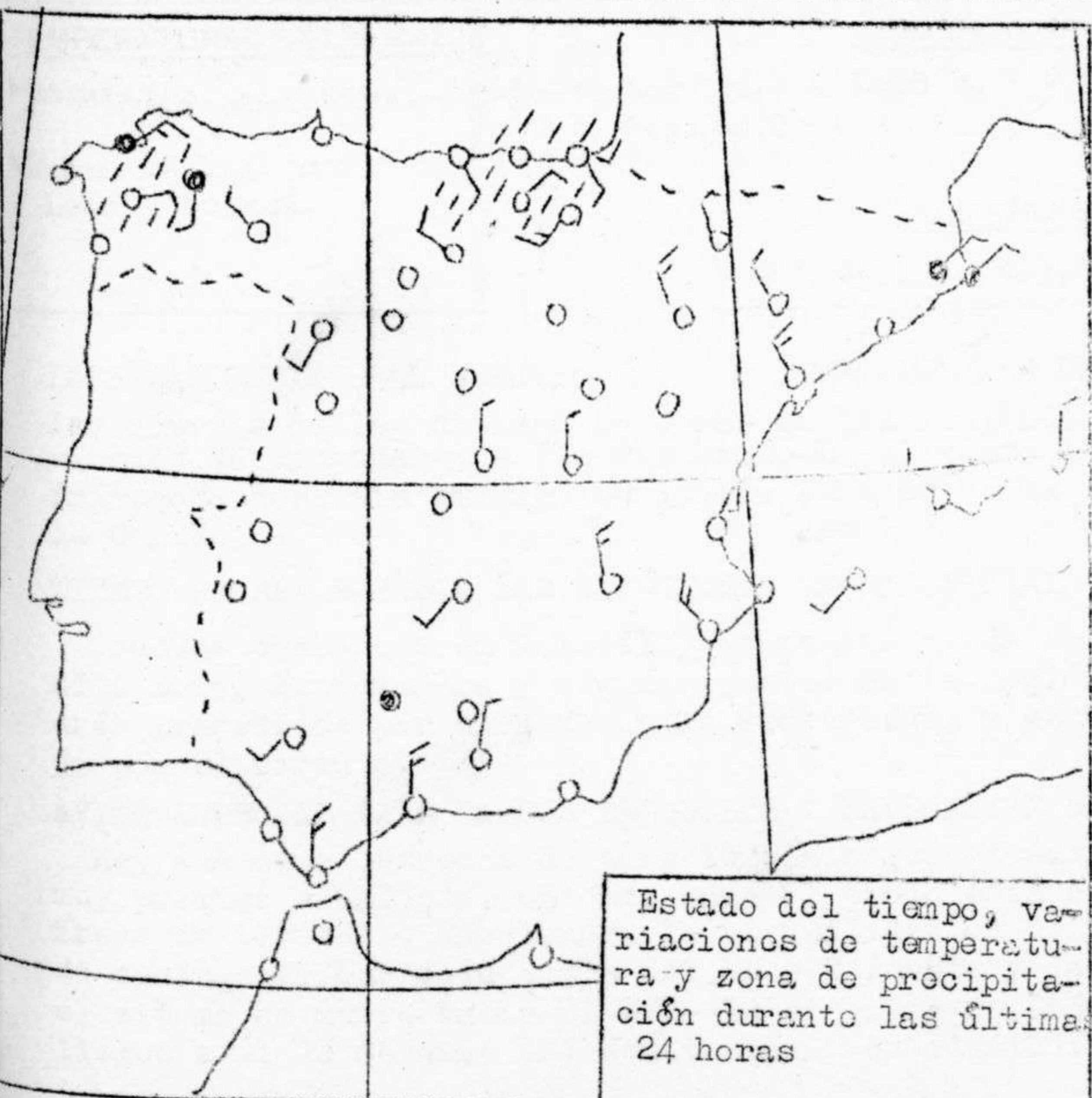
Estado del tiempo, variaciones de temperatura y zona de precipitación durante las últimas 24 horas