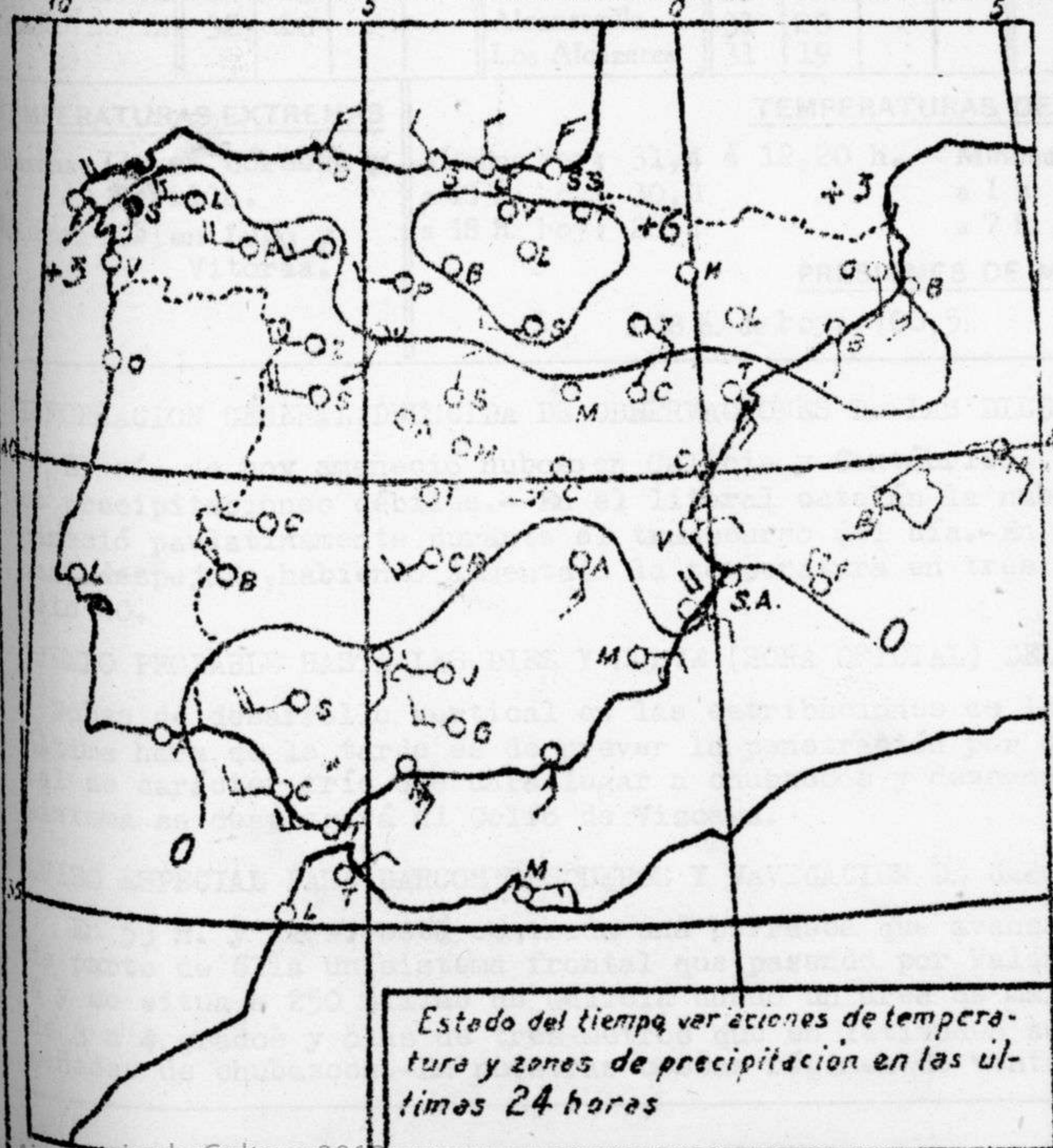
Estado del tiempo variaciones de temperatura y zonas de precipitación en las últimas 24 horas