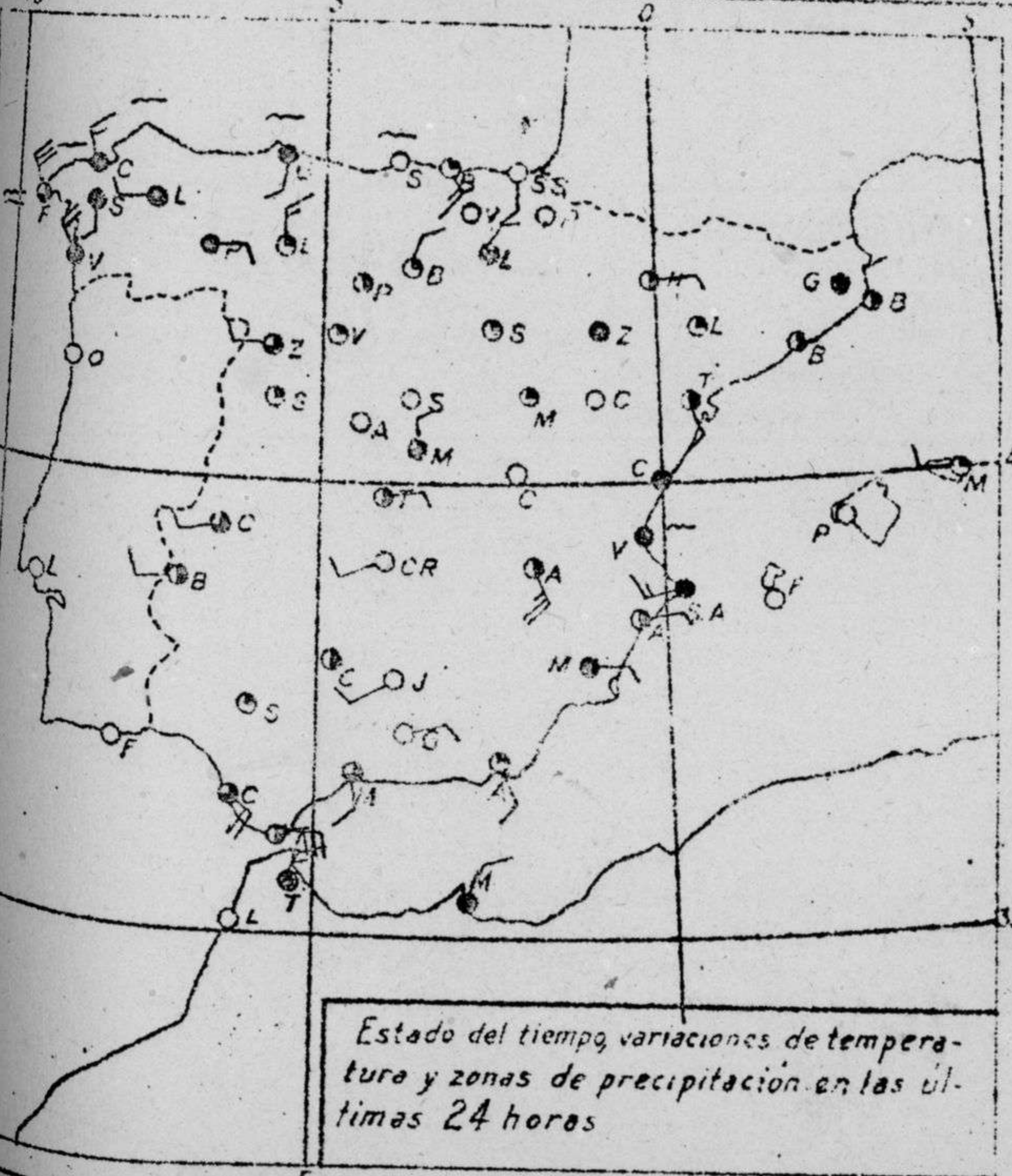
Estado del tiempo, variaciones de temperatura y zonas de precipitación en las últimas 24 horas