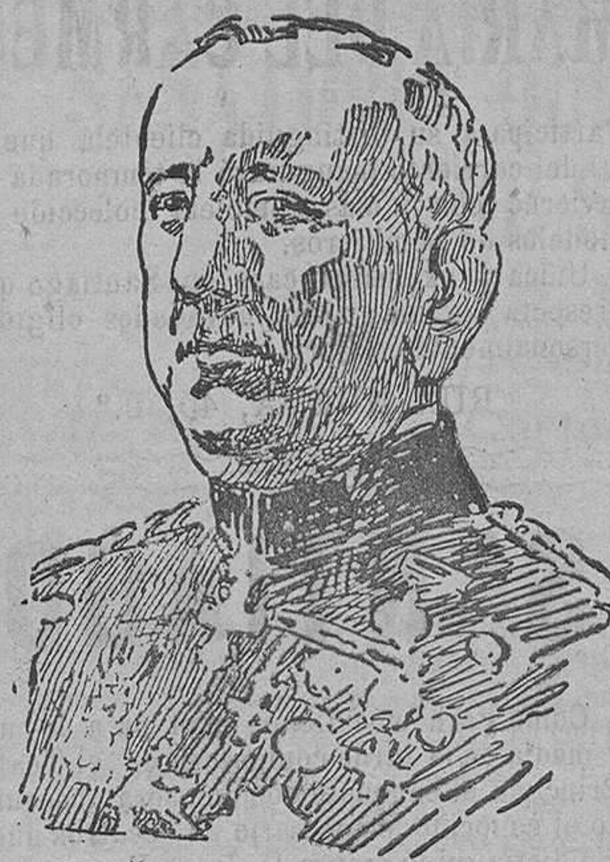
El general Arlegui, jefe superior de policía en Barcelona, que ha sido destituido por el Gobierno.