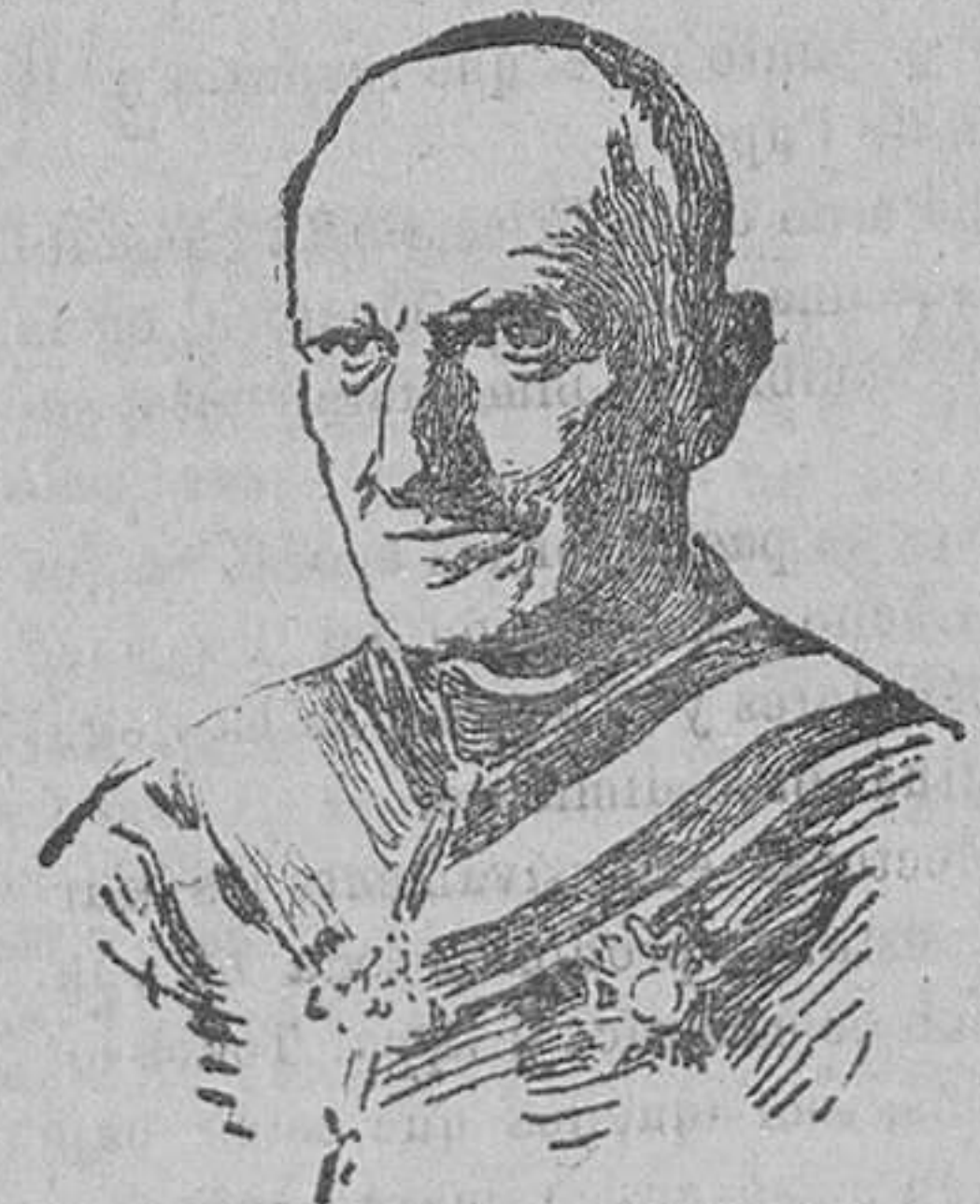
El Cardenal Vidal y Barraquer, Arzobispo de Tarragona que, con los de Zaragoza y Burgos se dirige a Roma para tomar parte en la elección de nuevo Papa.

Gregorio XVI (Mauro Capellari), nacido en Ballenno; prefecto de la Propaganda. Fué elegido en Roma el 2 de febrero de 1831, y murió el 1 de junio de 1846.