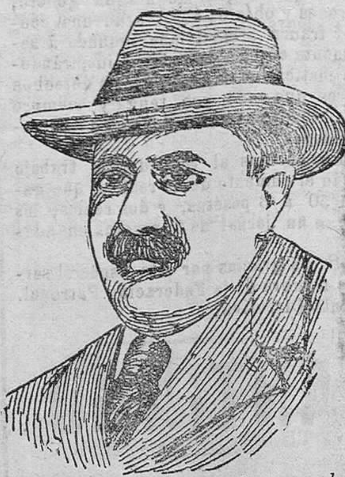
Mister Carter, uno de los exploradores de la tumba de Tutankamen que acaba de dar unas brillantes conferencias sobre las exploraciones realizadas, en Madrid.

Dos mil pesetas recaudadas por suscripción popular sólo pueden constituir una suma respetable—y aun más respetable, fabulosa—tratándose de un homenaje a un periodista.