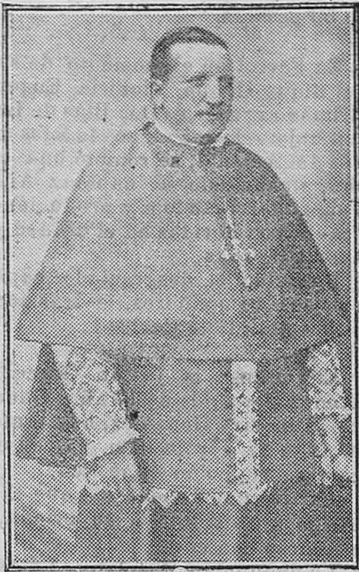
El Excmo. y Redmo. Sr. Arzobispo de Santiago que presidió hoy la apertura del curso académico en el Seminario.

—No haga el demonio que no. —¿Más qué quieres de él?—¿Qué quiero?