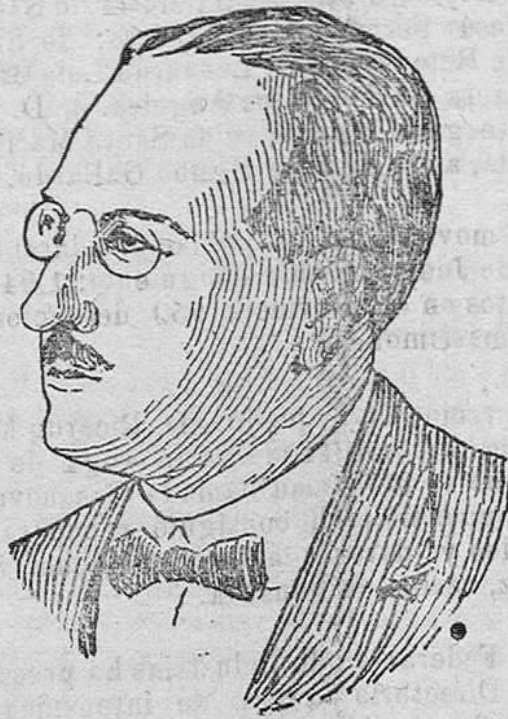
El Doctor Don Carlos Campos, presidente del Estado de San Pablo (Brasil) contra quien se han revolucionado sus súbditos, estando a punto de renunciar la presidencia.

oponen a la sencillez que ha de ser la característica del vestido.