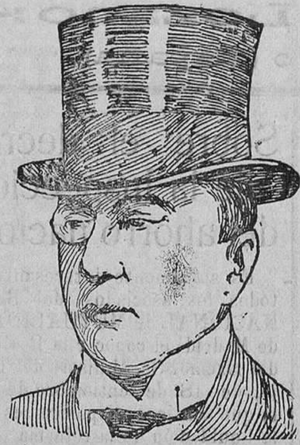
Mr. Chamberlain, ministro inglés al que se le ha otorgado el Premio Nobel de Paz de 1926.