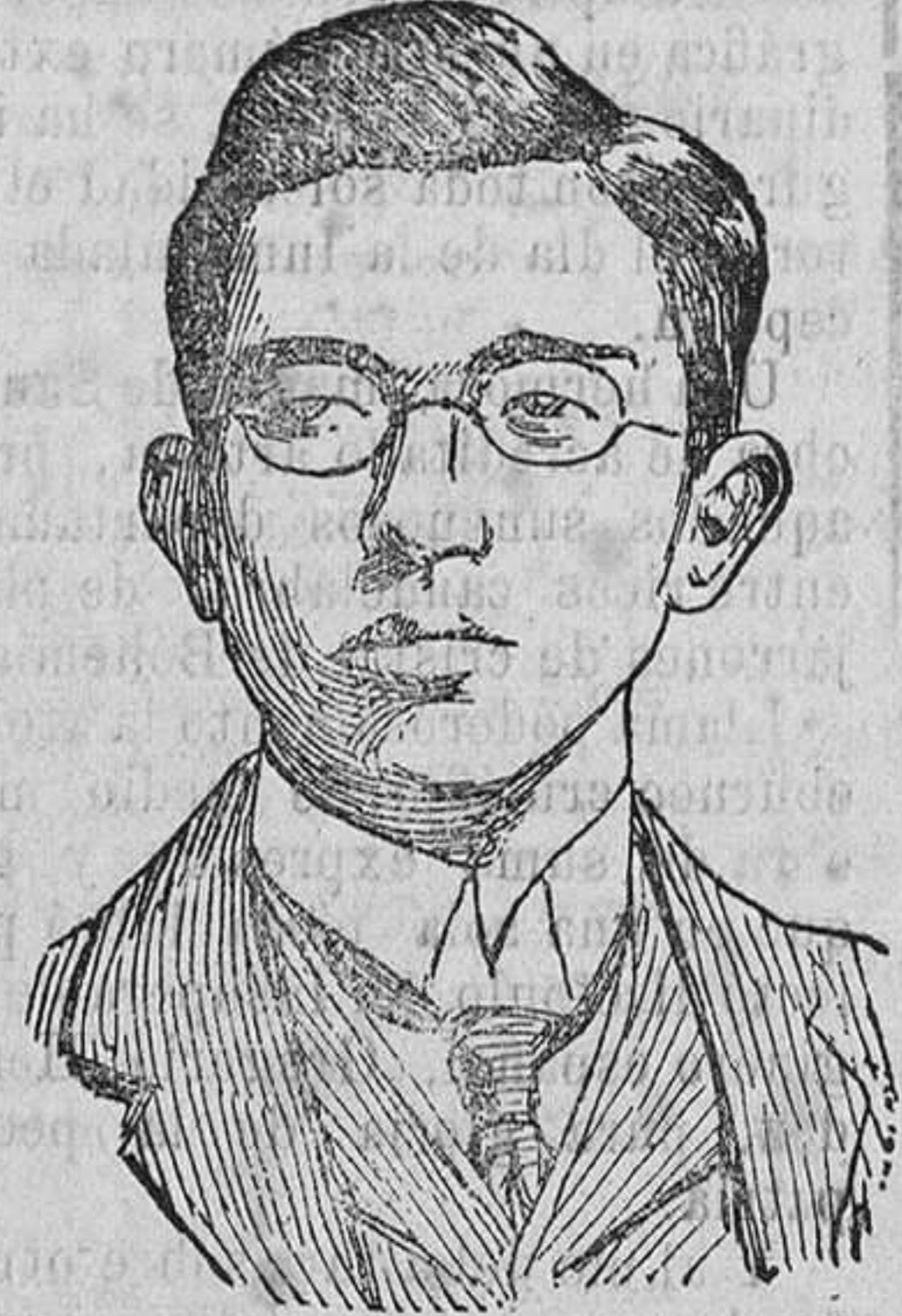
El emperador del Japon Fshihito que tan gravemente enfermo halla que se teme su fallecimiento.