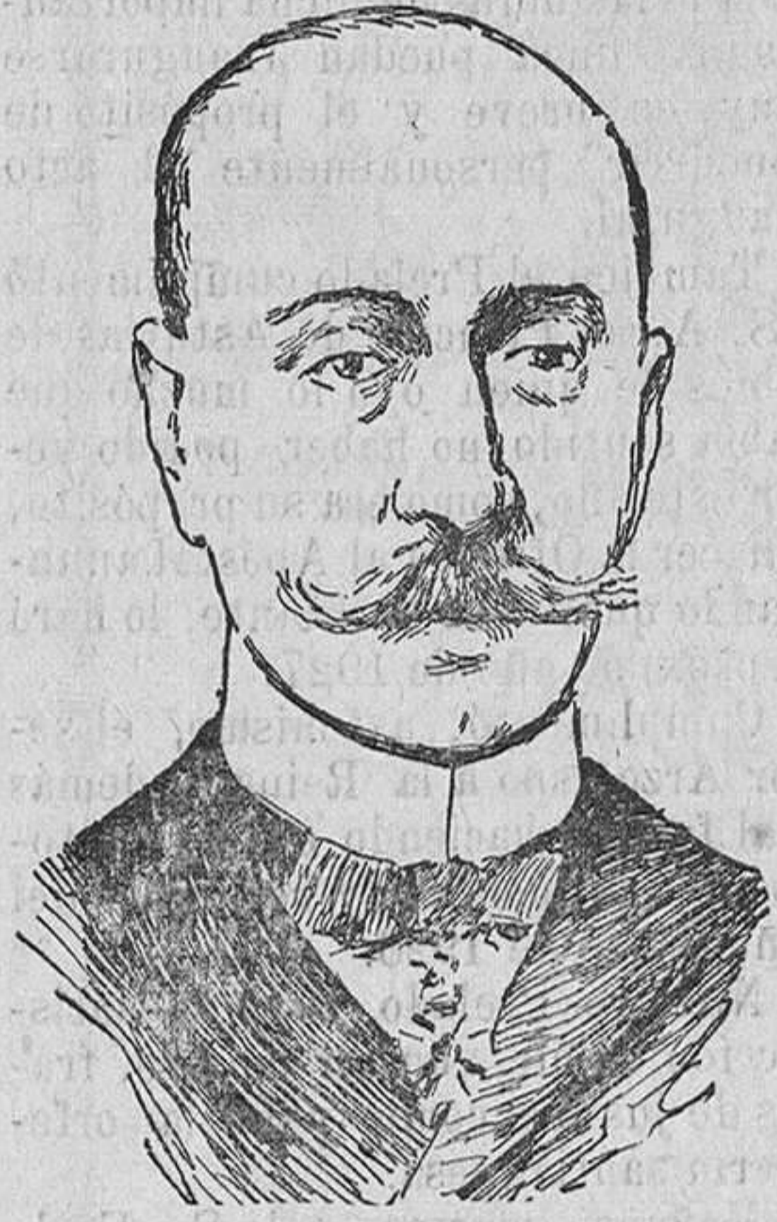
El almirante Conduriotis que ha sido repuesto en la Presidencia de la República griega por el general Condilys.

grafía e historia de América, elementos de geometría, nociones de física y química, historia de la literatura española, religión (segundo curso), francés (segundo curso).