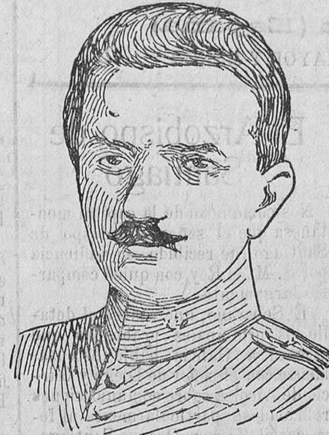
El general Condilys autor del golpe de Estado griego, y que se ha nombrado jefe del Gobierno.