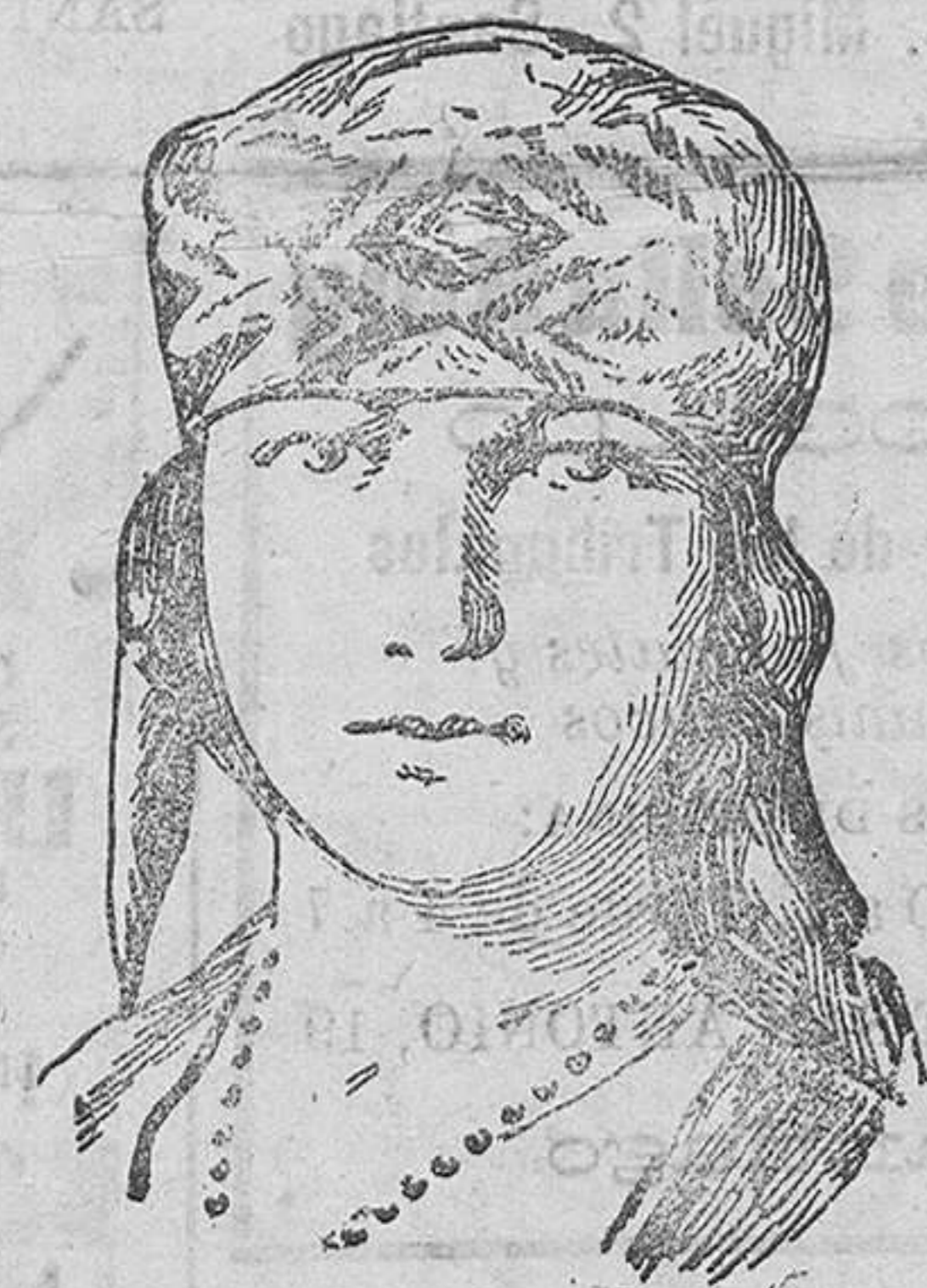
Princesita Illeana de Rumania

Aunque desde la localidad donde reside actualmente la princesa Illeana de Rumania se desmiente la versión del compromiso, las crónicas telegráficas insisten en que él se ha hecho efectivo. La única hija soltera de los actuales soberanos rumanos pasaría a ser de este modo duquesa de las Apulias. De la novia y de su belleza no nos queda mucho que decir. Es en Europa una de las princesas más hermosas y más jóvenes y de ella nos hemos ocupado en diversas oportunidades puesto que las niñas de su condición