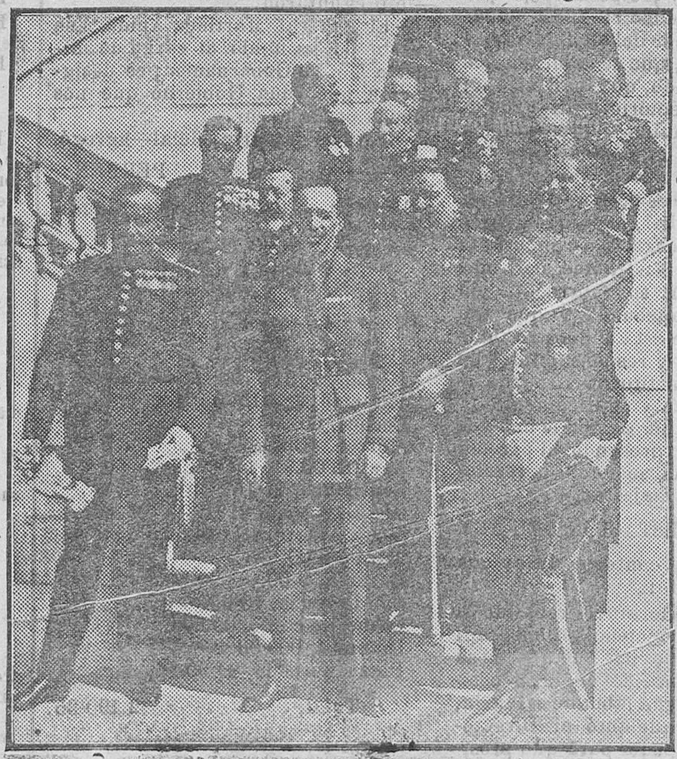
S. M. el Rey con el Directorio Militar y los generales Cavalcanti y Berenguer al constituirse e aquél en 16 de Septiembre de 1923

cuanto con tantos rumores y calendarios, que me pareció, de acuerdo con mis compañeros de Directorio, conveniente y preciso lo hecho, para evitar la situación de posibles quebrantos e inquietudes en la opinión pública, ya que había candidaturas tan diversas. Así lo expresé anoche al Rey y su majestad lo juzgó igual. Pedíle autorización para concretar en un escrito las razones que tenía para fundamentar mi opinión.