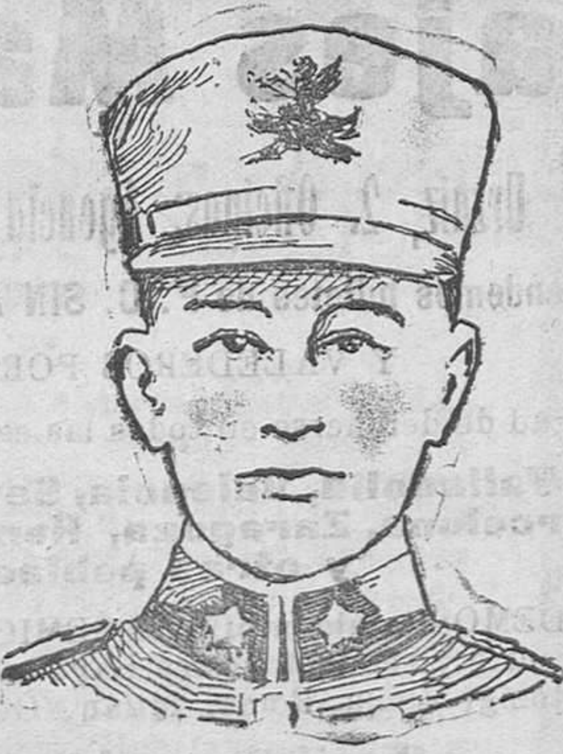
El duque de Apulias

y rango están expuestas a que la fantasía de los corresponsales les busque pretendientes reales ajenos por completo a sus simpatías y sentimientos. Con frecuencia se anuncia como inminente un compromiso con el actual rey de Bulgaria, Boris. Otras veces se habla del príncipe de Piemonte no pocas se insinúa la posibilidad de que fuera el duque de Brabante el aspirante a la mano de la bellísima princesa y hasta se aludió al príncipe de Gales, en el mismo sentido. Pero los fantaseos corresponsales se han equivocado sufriendo un chasco. Al igual que su hermana mayor la que fué reina de Grecia y que esperó ocho años a su prometido el entonces heredero del trono griego a pesar de haber sido despojado durante la guerra de sus derechos legítimos y que al casarse lo hacía solo con el hombre por ella elegido y no con el príncipe que sería rey, convenida de que no sería reina y acaso lamente el