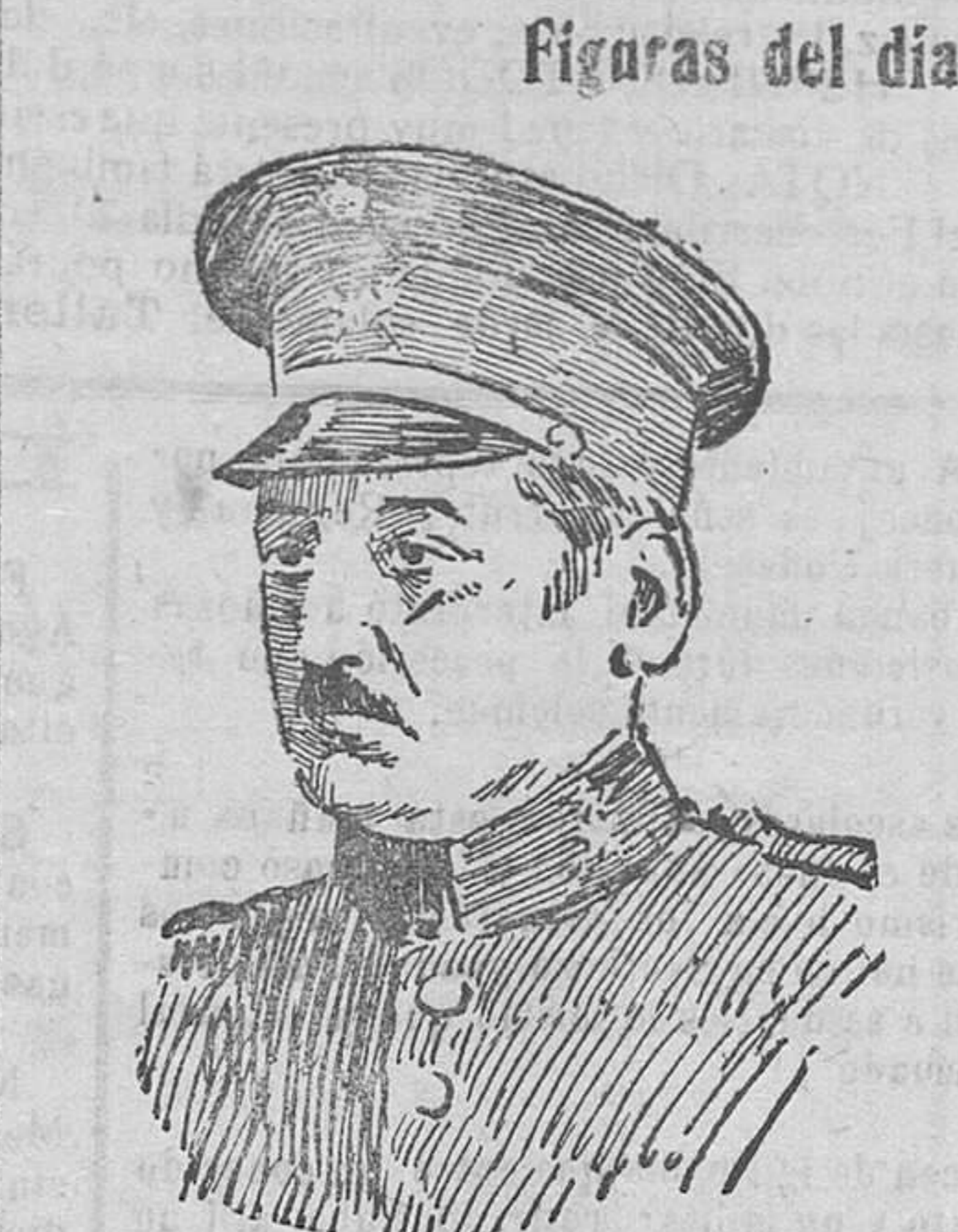
El general Sanjurjo ascendido a teniente general por méritos de guerra.